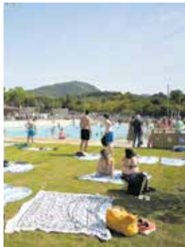
La piscina també és refugi climàtic. || Q.P.

L'objectiu és proporcionar llocs frescos on poder recuperar-se del cansament i la pressió tèrmica durant els dies de calor intensa. Entre els deu equipaments hi ha centres cívics, equipaments esportius, la biblioteca, el mercat i diverses piscines. La novetat principal d'enguany és la Piscina Municipal Colobrers (ronda de Tolosa, 28), que obre fins al 14 de setembre amb ho-