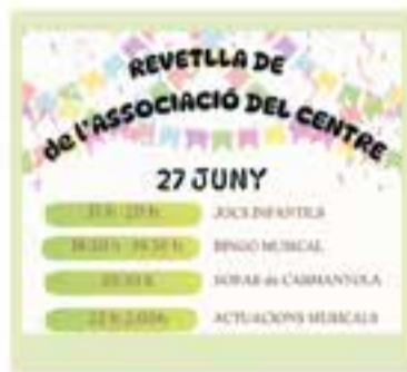
Associació del Centre

+ INFO: tel. 639129327, Instagram @calcalisso