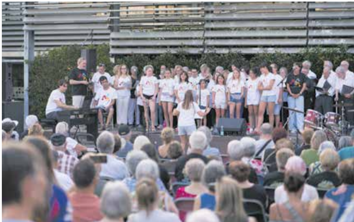
Un dels moments més entranyables de l'acte va ser la col·laboració entre les corals Xiribec i Pas a Pas.

Com que el sol encara castigava quan van arrencar les actuacions, una part del públic es va haver de moure a la recerca d'ombres mentre alguns eren capaços d'aguantar l'assolellada per no perdre perspectiva de l'escenari per on van desfilar una desena d'entitats musicals. Justament, l'arrencada va ser força espectacular gràcies a la JOCVA. La Jove Orquestra de Castellar d'Acció Musical, integrada per una vintena de músics i sota la direcció de Carles Miró, va interpretar "Sant