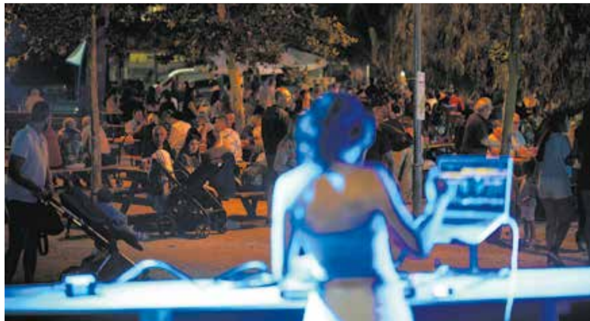
Moment de música amb una discjòquei, durant les Nits d'Estiu de l'any passat.

Dissabte s'ha previst Rodeo de la companyia La Banda de Otro, un espectacle de circ contemporani inspirat en els rodeos que donarà pas a un karaoke popular a la fresca que convidarà els assistents a convertir-se en protagonistes de la nit.