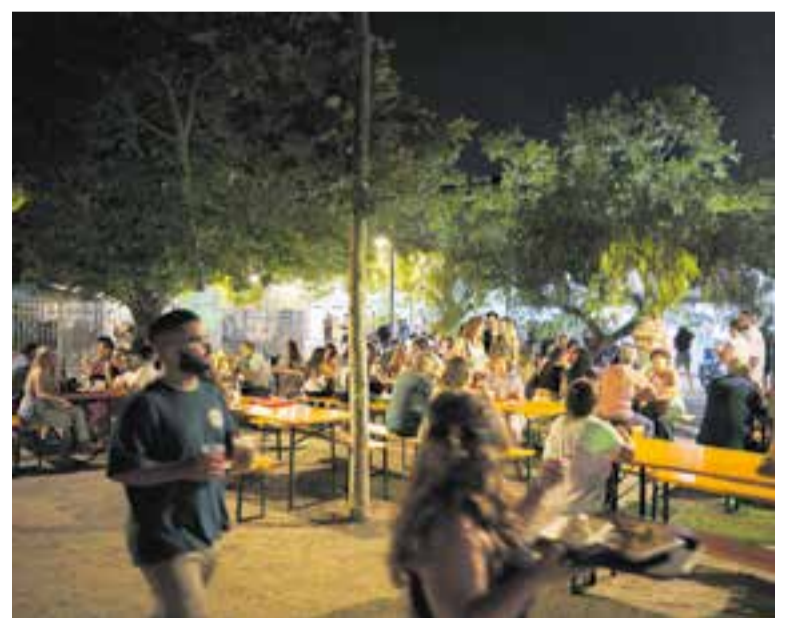
Ambient durant el Tast d'Estiu de l'any passat a la plaça de Catalunya.

Els establiments participants en aquesta edició de Botigues a la fresca! són Cuca Bag, DecoArt, Herois, Kids & Us Castellar del Vallès,