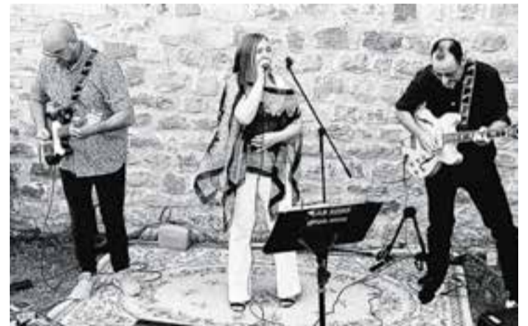
La banda Lab Sons actua aquest divendres al Calissó.

Els Lab Sons acumulen anys d'experiència sobre els escenaris. La formació ja havia actuat anteriorment al Calissó. “Recordo que hi vam ser fa un parell o tres d'anys i va ser una vetllada molt agradable”. + || M. A.