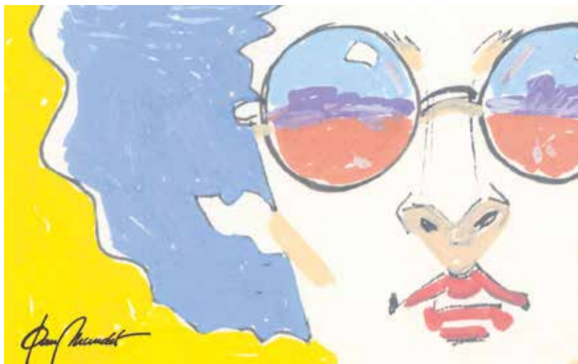
© 'Genèric d'estiu'. || JOAN MUNDET

el vehicle arribi quan bonament pugui. Com que a la ciutadania, moltes vegades, se'ns acusa més d'apuntar problemes més que no pas aportar solucions, penso que és bo que jo n'indiqui una de molt econòmica. Com que la despesa ja està feta i el panell lluminós es pot llegir per les dues cares, penso que es podrien anar alternant els horaris de sortida dels autobusos amb la publicitat: ara apareix el llistat i deu segons més tard s'hi pot llegir l'anunci: tants a tants. La tipografia ompliria, forçosament, tot l'espai i, com a resultat, els passatgers i la seva paciència (i impaciència) hi sortiria guanyant. També és cert que la lectura d'aquesta informació la majoria de vegades aporta ben poca cosa més que la tranquil·litat de l'usuari. En molt comptades ocasions, jo he vist marxar algú de la parada després de clavar una ullada al panell de sortides. En general, conèixer aquesta informació et dona poc joc: ni estar al corrent de l'horari avança l'arribada dels busos ni es rep cap prebenda extra per l'espera. A tot estirar, entre les diverses alternatives se'ns presenten pel fet d'estar al