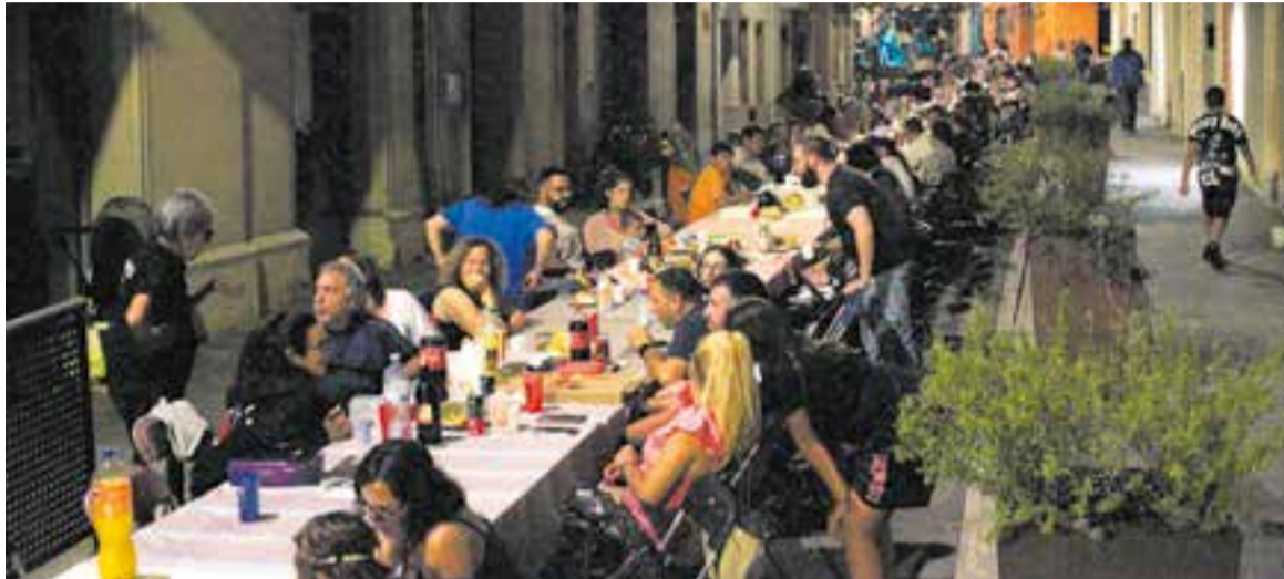
Sopar de la Revetlla de Sant Pere, l'any passat, al carrer Major.