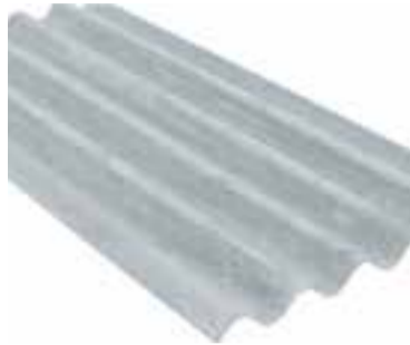
Placa ondulada de fibrociment.

La llei preveu eliminar el fibrociment d'edificis i instal·lacions pri-