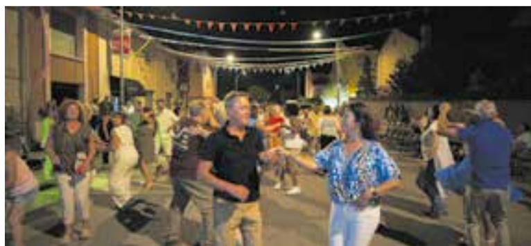
Moment de la revetlla de Sant Joan a la Festa Major de Can Carner. || Q. P.

La Festa Major va finalitzar el 24 de juny amb una festa de l'escuma i animació infantil. A la tarda es va fer el lliurament de premis i, al vespre, el tradicional sopar popular amb botifarrada. La cloenda va anar a càrrec del Grup Terral, que va oferir una cantada d'havaneres. +