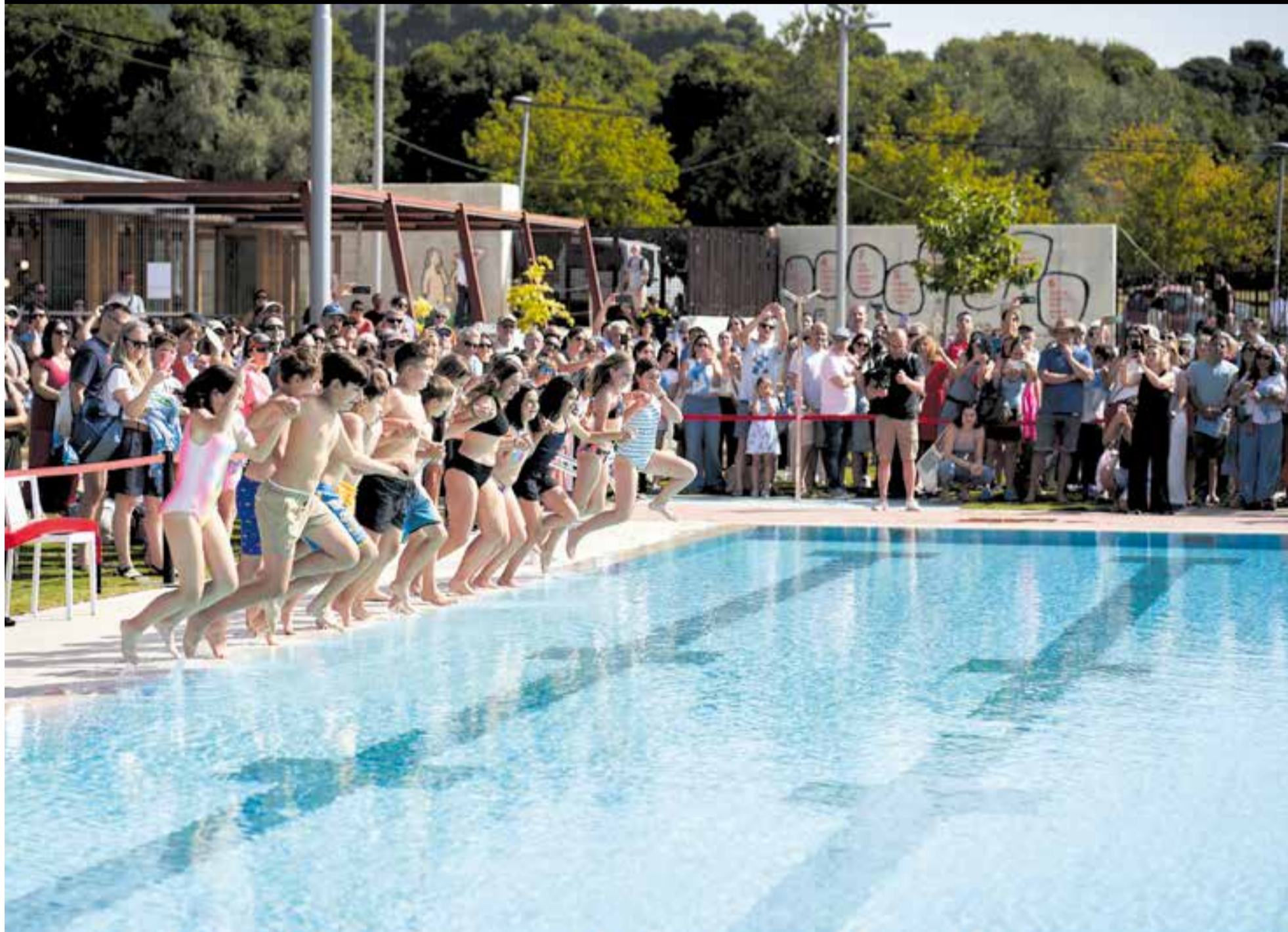
Els protagonistes del primer bany de les noves piscines Colobrers van ser els i les membres del Consell Municipal d'Infants, un dels col·lectius que històricament ha reclamat una piscina d'estiu.