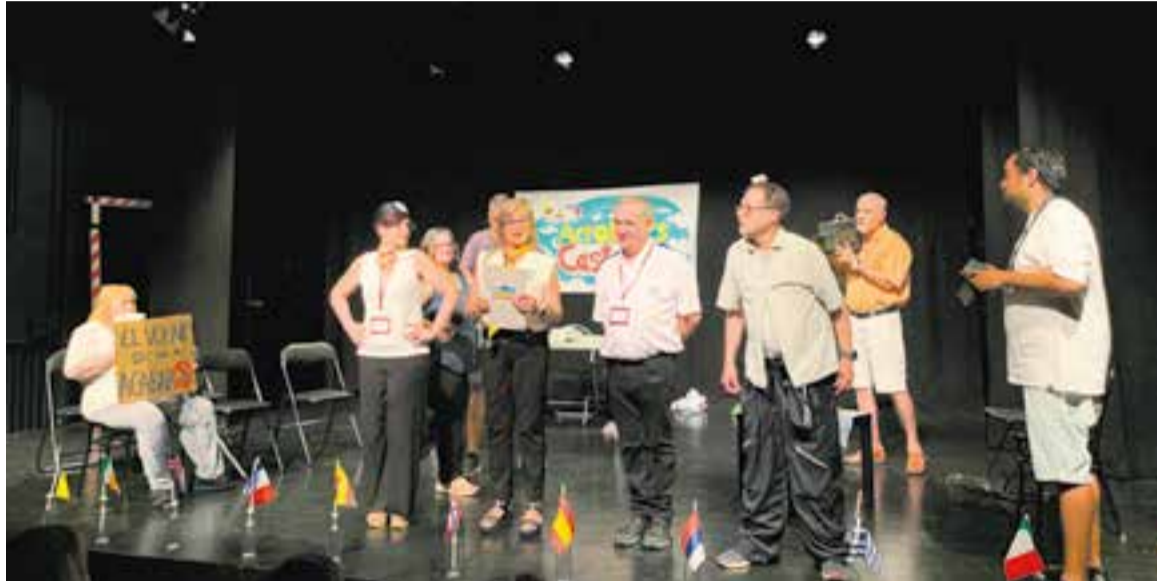
Els actors d'"Aerolínes Castellar" dalt de l'escenari.

Aerolínes Castellar és una comèdia fruit del treball col·laboratiu de tots els seus participants, els quals, des del mes de febrer, s'han trobat cada dilluns i han treballat en equip per elaborar el guió i els personatges. És una obra satírica que planteja una solució tant insòlita com enginyosa a les habituals cues de trànsit que es formen en hores punta a la carretera de Castellar: un servei d'aviació de proximitat entre Castellar del Vallès