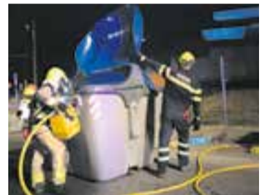
Contenidor cremat

Segons l'Ajuntament i els cossos de Protecció Civil, Castellar va viure una nit de Sant Joan força tranquil·la, amb poques sortides. En total, no van ser més de mitja dotzena de serveis sense gaires complicacions com el de la imatge, un contenidor que va cremar al carrer Camamilla, a l'Airesol C. + || REDACCIÓ