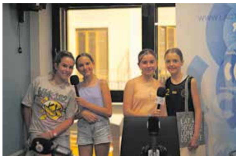
Els equips Les L. B. i Les Ai!, en ordre. || C. ARAGONÈS