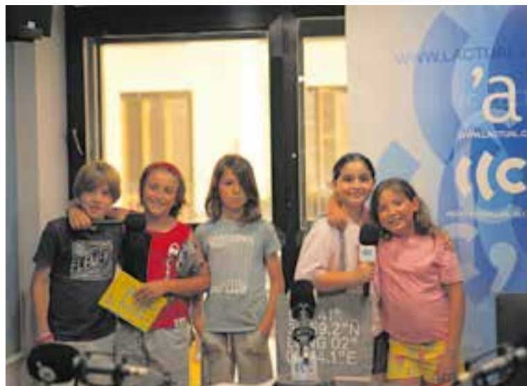
Els equips Mai Perdrem i Les Twins, en ordre.

Finalment, els equips que van disputar la final van ser Les Ai!, Mai Perdrem, Les Twins i Les L. B. D'aquests, Les Twins es van proclamar guanyadores en la categoria dels equips petits, mentre que Les L. B. van obtenir la victòria en la categoria dels equips grans. Els participants premiats van rebre una selecció de premis cedits per Comerç Castellar, Kids&Us i Teranova T14 Castellar. ➔