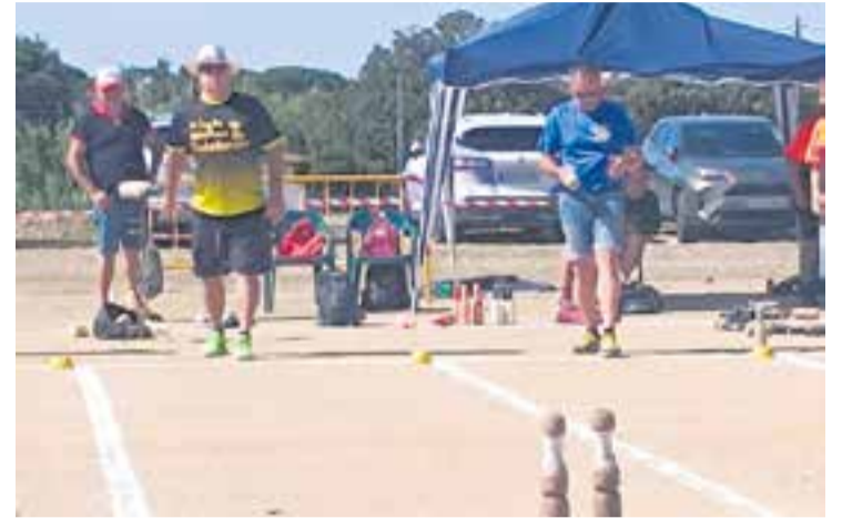
Quatre representants del CBC van disputar la final catalana individual.