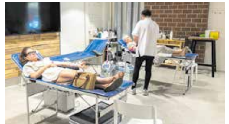
Dues donants durant l'extracció de sang feta a La Fàbrica.

El recinte de La Fàbrica va ser, dimarts passat, la seu d'una nova campanya de donació de sang i plasma, promoguda pel Banc de Sang i Teixits.