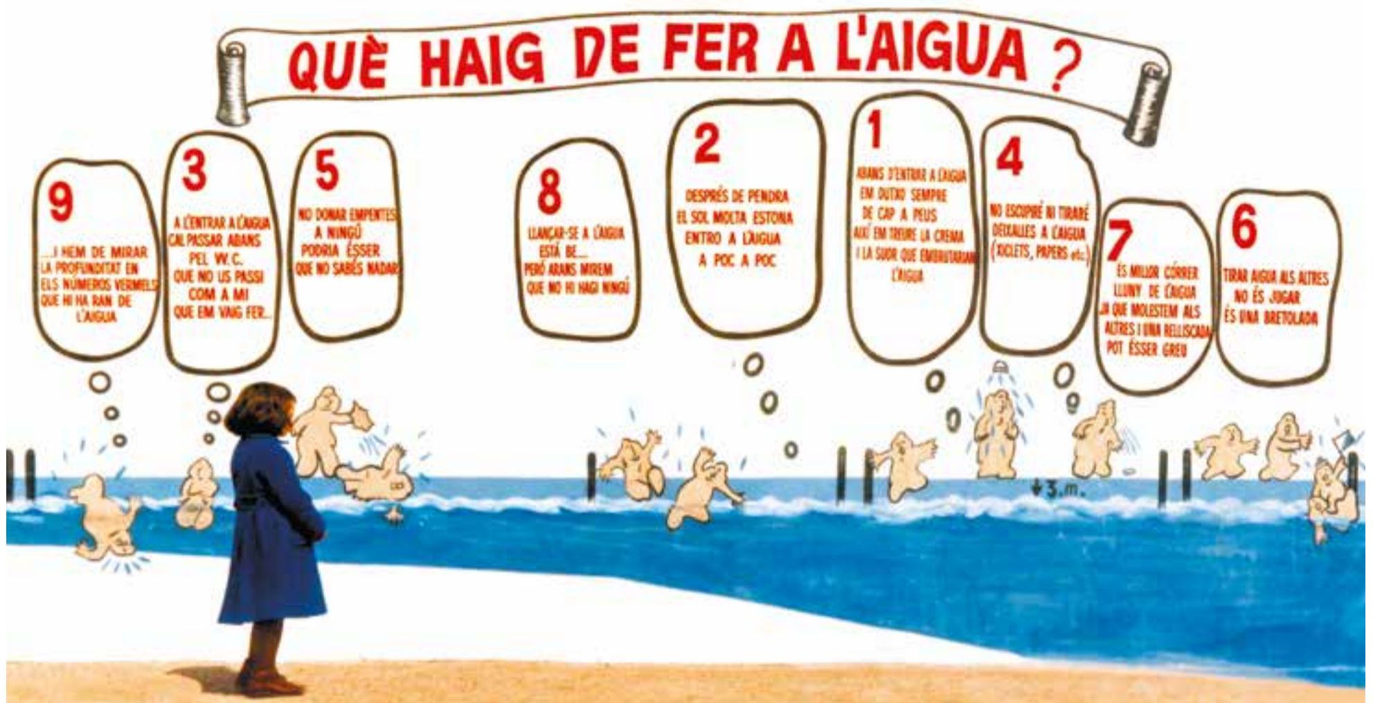
Una nena observa el mural de les antigues piscines del carrer de Sant Feliu. Fons Garrós / març 1982

Les persones usuàries han de respectar les normes de seguretat, d'higiene i de convivència que es detallen a continuació, així com la resta de normes contingudes a l'ordenança de municipal de convivència i el civisme i la resta de l'ordenament jurídic aplicable: