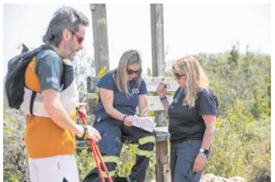
A dalt, tres participants ja albiren el Puig de la Creu, a la seva dreta. A sota, voluntàries del Serna al cim del Pic del Vent. || A. SAN ANDRÉS