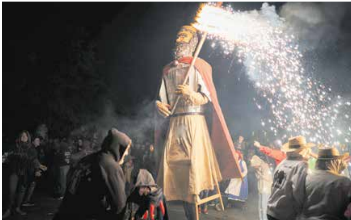
El nou gegant creat per l'Esbart Teatral de Castellar, el Guifré, va tenir un gran protagonisme en la Triforca d'aquest any.

Entre les novetats principals d'aquesta edició destacava la presentació del Guifré, un gegant construït íntegrament pels membres de l'entitat. A més, també s'hi han incorporat noves peces musicals, creades pels mateixos integrants de la colla, fet que reforça el caràcter participatiu i autogestionat de la proposta. Ruben Corral vol agrair la impli-