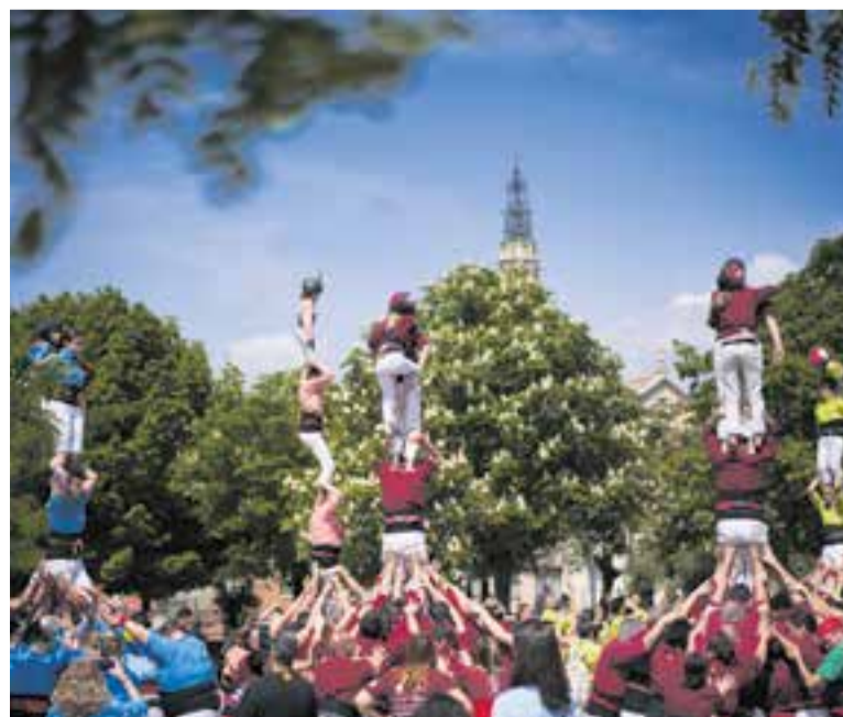
Celebració del 12è aniversari dels Capgirats, diumenge passat, a la plaça Major.

Els Castellers de Castellar estan molt contents amb la diada, en què van sumar gairebé 80 persones, entre les quals, alguns capgirats que actuaven per primer cop