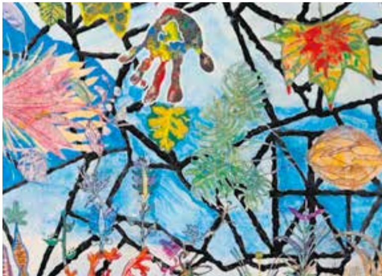
Fragment d'una de les obres que es poden veure al local social de Can Font.