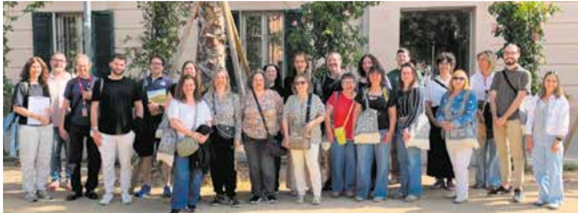
Foto de família dels responsables de punts d'informació turística al Palau Tolrà.

Per això són tan vitals aquestes trobades. “Si no coneixem, no estimem, i si no estimem, no preservem i no cuidem” , constatava Sánchez. Amb aquesta preservació, s'intenta anar cap a un turisme sostenible, que cuidi el seu patrimoni i el seu entorn. Fa tot just quinze dies, es van distingir 26 punts d'informació