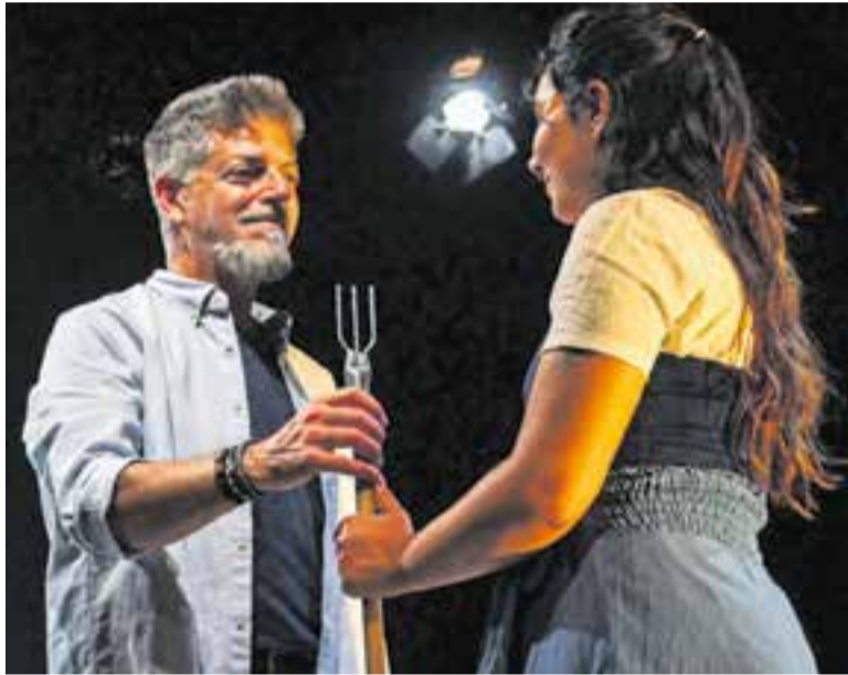
Moment de 'Més enllà de les onades, la filla del mar', a la Sala de Petit Format.

'Més enllà de les onades, la filla del mar' va omplir la Sala de Petit Format