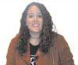
NEUS SEGALÈS Pintora

“El trasllat temporal podria ser una oportunitat per a un diàleg més profund”