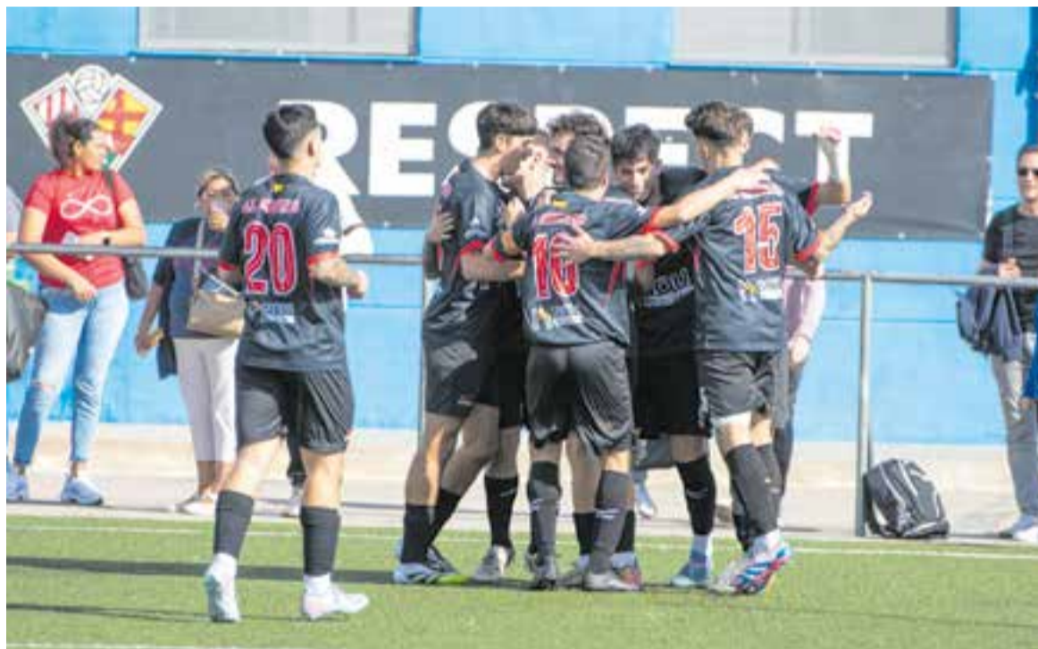
Els jugadors de la UE Castellar celebren un gol en un partit lluny del Joan Cortiella.

La UE Castellar s'imposa amb contundència a Balaguer (0-3)