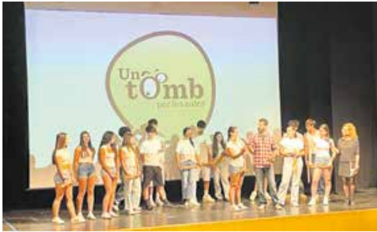
Un dels moments de l'edició 2026 del festival 'Un tomb per les aules', dimarts.

La IX edició del festival Un tomb per les aules , organitzat per Ràdio Castellar - L'Actual i Serveis Educatius Vallès Occidental VIII, va omplir amb gairebé 200 alumnes l'Auditori Miquel Pont aquest dimarts passat. Els sis centres castellarencs participants van mostrar amb èxit diferents propostes educatives.