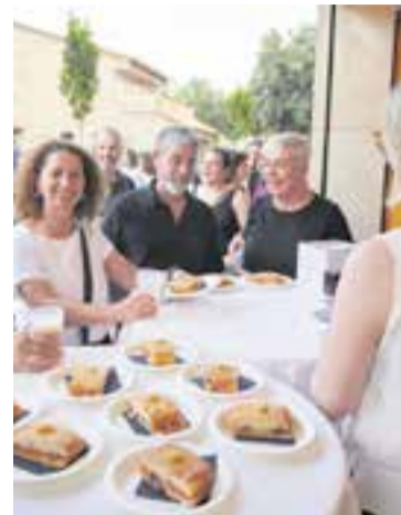
CorreTapa de l'any 2025.

D'acord amb la voluntat de combatre la situació d'emergència climàtica i segons la instrucció per a l'eliminació de productes de plàstic d'un sol ús en equipaments