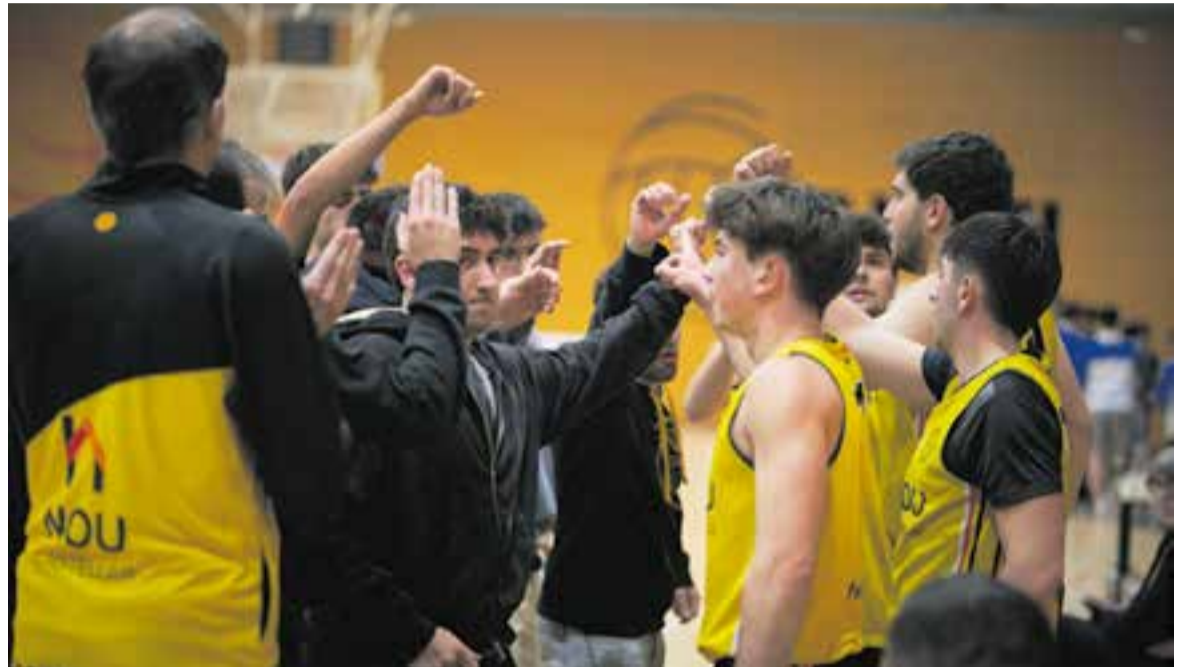
Tot i que no depenien d'ells mateixos, els de Jaume Prat van fer la feina per continuar somiant amb la permanència.

Ara les opcions impliquen guanyar un partit o que el CN Sabadell B perdi un dels dos, ja que tenen l'average perdut amb elles. La pròxima jornada rebran el CB Igualada. +