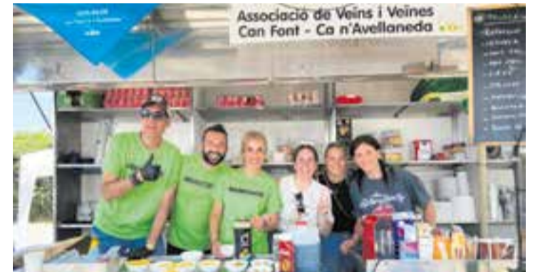
Veïns de Can Font durant la celebració de les Jornades de Primavera.

Les Jornades de Primavera es reprendran el 30 de maig a partir de les 17 h amb l'obertura del bar, i culminaran amb un "vespreig" musical a les 18 h. ✦ || M. A.