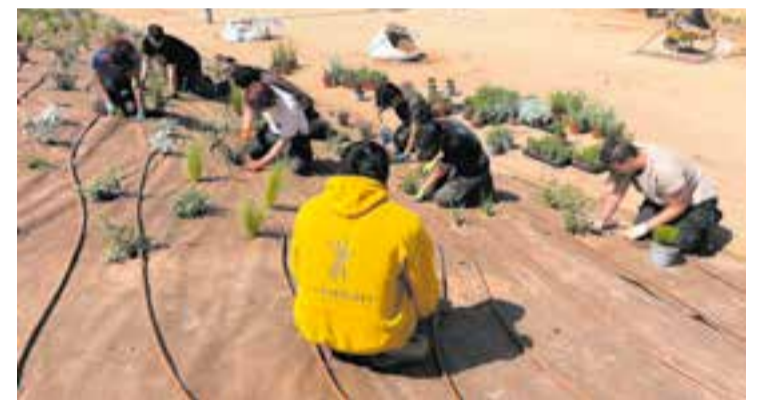
Estudiants de Les Garberes treballant en el parterre de la ronda Llevant.

La intervenció està supervisada per la Regidoria d'Espai Públic i s'emmarca en la col·laboració continuada entre el centre educatiu i l'Ajuntament, que permet que l'alumnat desenvolupi pràctiques en espais exteriors de titularitat municipal. +|| REDACCIÓ