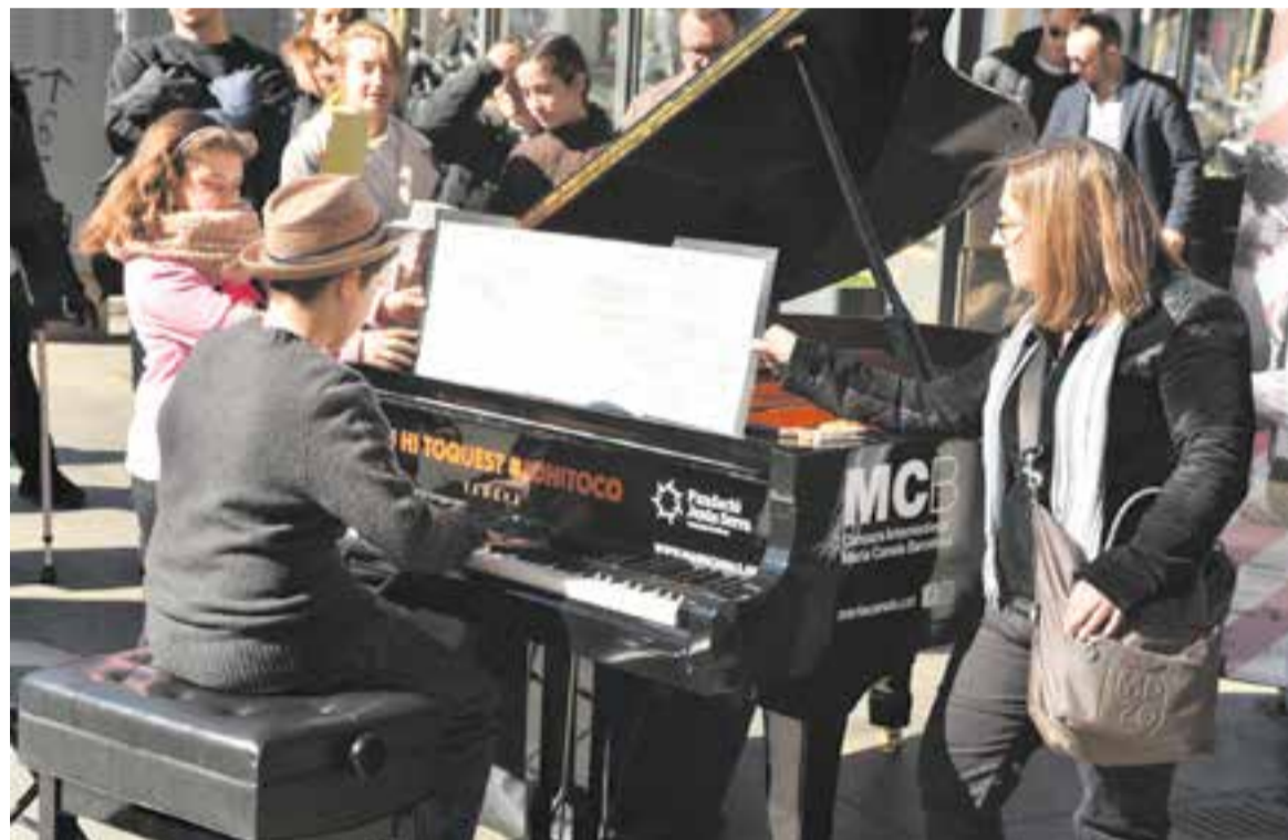
Imatge d'"El Maria Canals porta cua" al passeig de Gràcia de Barcelona, en una de les edicions passades.

La jornada combinarà aquests moments d'ús espontani de les persones que s'apropin a tocar amb actuacions de persones vinculades al món musical. El punt culminant serà a les 19.45 h amb el concert del pianista eslovè Nejc Kamplet, segon classi-