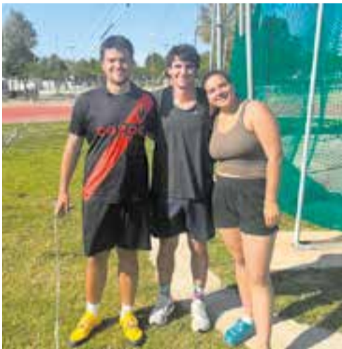
Les pistes van ser la seu del campionat.

El Club Atlètic Castellar ha viscut un cap de setmana dels més complets dels últims mesos, amb la final del Campionat de Catalunya de Relleus a les pistes i l'activitat competitiva de la base.