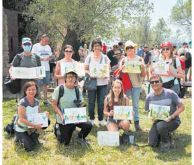
Urban sketchers de Dibuixant Castellar a Castellar Vell, fa tres anys.

Amb aquesta nova etapa, Dibuixant Castellar vol consolidar-se com un espai obert, dinàmic i participatiu, que reforci la xarxa cultural i artística local. Les persones interessades poden informar-se o sumar-se a les trobades a través de les xarxes socials del grup o escrivint a dibuixantcastellar@gmail.com . +