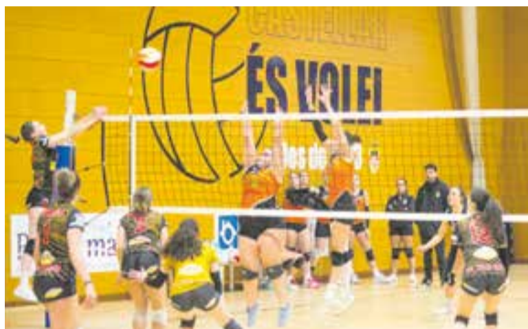
El femení encara té opcions matemàtiques de salvació. || O. F.

Victòria dels dos primers equips del Vòlei Castellar, que els permet mantenir-se amb vida