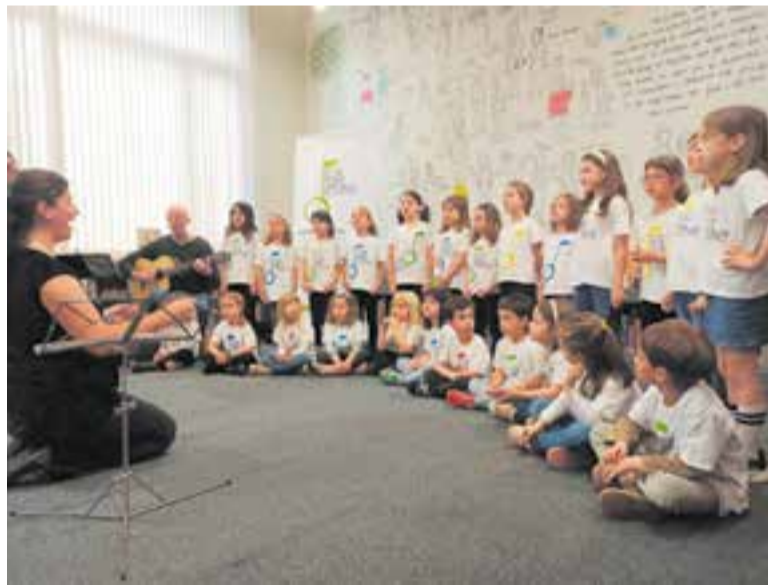
El Cor Sant Esteve a la Biblioteca Municipal, dissabte 26 d'abril.

A banda de les tres representacions que sumarà a Castellar, l'obra també es podrà veure a Terrassa el 22 de juny, a la sala petita del Teatre Principal i també s'està treballant per portar-la al Casal Pere Quart de Sabadell en una data encara per determinar. †