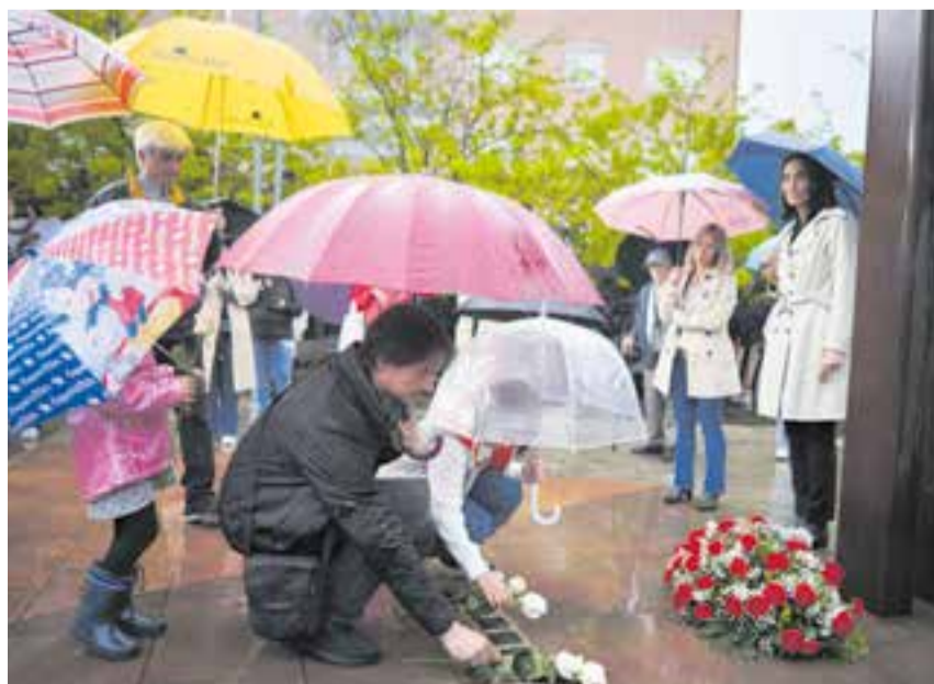
Moment de l'ofrena floral sota la pluja al Monument a la Memòria.