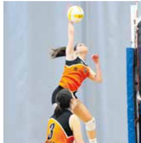
El femení es pot salvar aquesta setmana. || M. CASALS

Amb tres jornades per jugar, els dos senyors del Vòlei Castellar ja fan comptes per veure com salvar la categoria. El femení ho pot fer aquesta jornada i el masculí espera entrar a les eliminatòries.