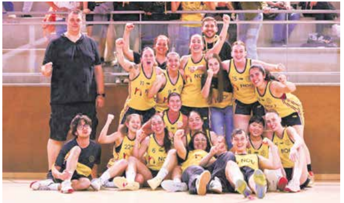
El femení ho té força bé per aconseguir el segon ascens de categoria seguit.

Aquest segon lloc no dona l'ascens, però baixen 16 equips i només en pugen quatre. En temporades anteriors les segones classificades havien ascendit. “No ho podem donar per fet fins que no ho confirmi la federació, però tothom hi compta. Esperem que sigui així per poder començar a pensar en la temporada que ve i fer un equip competitiu” , confirma Revilla.