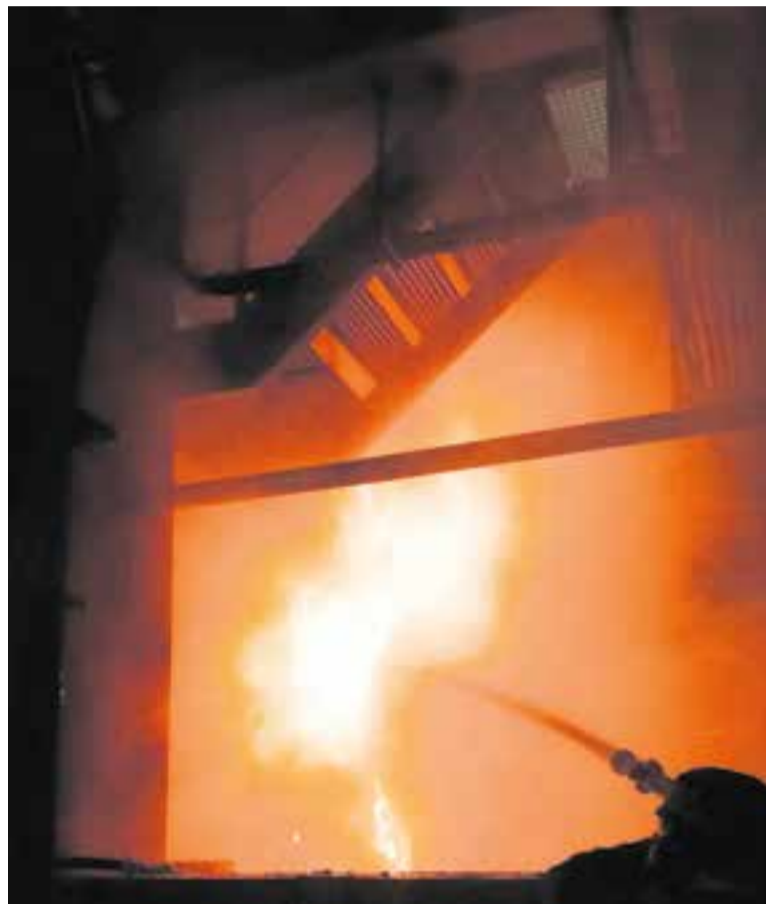
L'empresa i els Bombers van controlar l'incendi al forn 2 de Vidrala.

"Hem tingut una colada en el forn 2, és una colada gran, cosa que vol dir que el vidre ha sortit per la solera del forn. La situació està controlada, hem col·laborat amb els bombers, hem treballat per contenir el vidre i bàsicament hem esperat que es refredés dins del forn. La situació es va allargar durant la tarda-nit, però el risc estava molt controlat" , va explicar sobre el terreny a