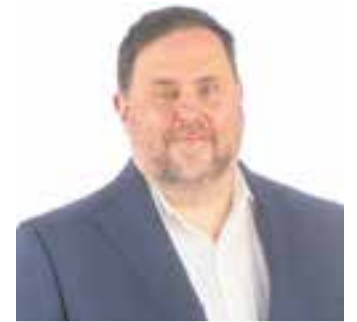
Oriol Junqueras. || L'ACTUAL