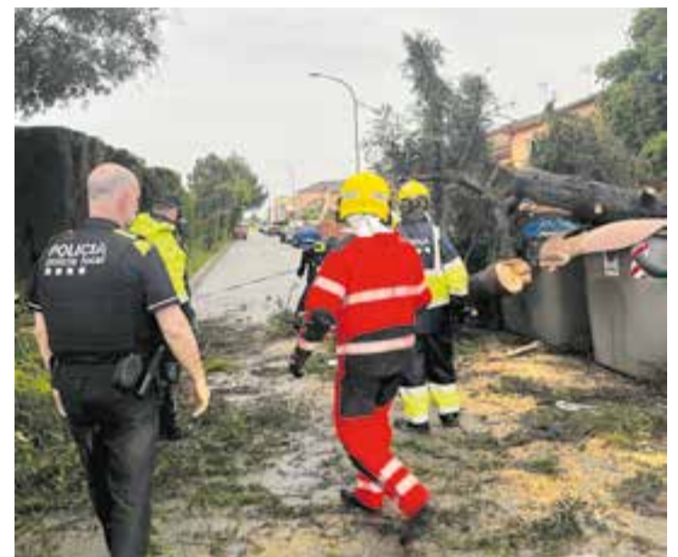
Bombers, policia local i SERNA treballant en la retirada de l'arbre.

D'altra banda, dissabte al matí un turisme i un camió de mercaderies van xocar a la B-124, passada la deixalleria del Punt Blau. El turisme, un Fiat 600 de color blanc, va topat contra el camió, que transportava material perible. La força de l'impacte va provocar que el camió bolqués al costat dret de la carretera. El turisme va acabar amb greus desperfectes a la part frontal. Diverses dotacions dels bombers, unitats del Sistema d'Emergències Mèdiques (SEM) i agents dels Mossos d'Esquadra van acudir al lloc de l'accident. ➔ || REDACCIÓ