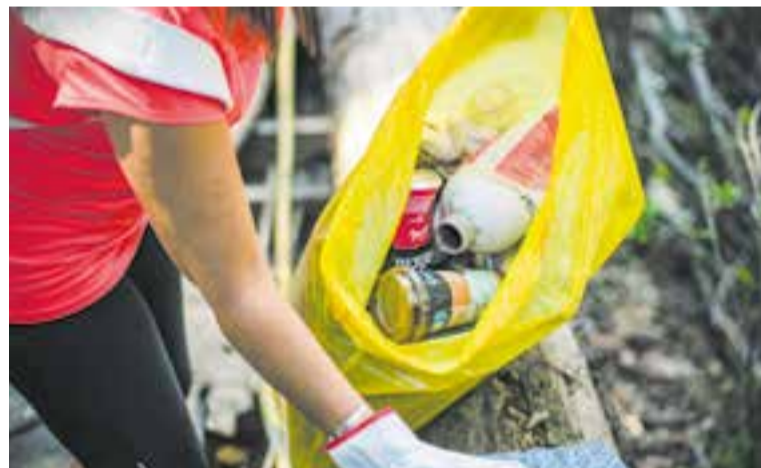
Recollida de residus al 'Clean Up Europe' de l'any passat.

L'Ajuntament s'ha adherit un any més a la campanya europea Let's Clean Up Europe , que enguany arriba a la 12a edició i que a Catalunya impulsa l'Agència de Residus de Catalunya. La iniciativa té per objectiu conscienciar sobre la quantitat de residus que llencem de forma incontrolada a la natura i promoure accions de sensibilització a través de la recollida d'aquests residus abocats il·legalment als espais naturals. En aquest sentit, la Regidoria de Residus i Malbaratament Alimentari ha organitzat una neteja de residus als entorns del Serrat del Vent i el Turó de Puigverd, una proposta que es farà aquest dissabte a partir de les 9.30. Tothom que s'hi vulgui sumar pot inscriure-s'hi emplenant el formulari que s'ha habilitat a www.castellarvalles.cat/lets-clean . Per assistir-hi, només cal ser major de 16 anys (o, si s'és menor, anar acompanyat d'un adult). L'organització lliurarà guants i bosses als assistents per facilitar l'activitat. El punt de trobada per iniciar la neteja serà l'aparcament del tanatori. + || REDACCIÓ