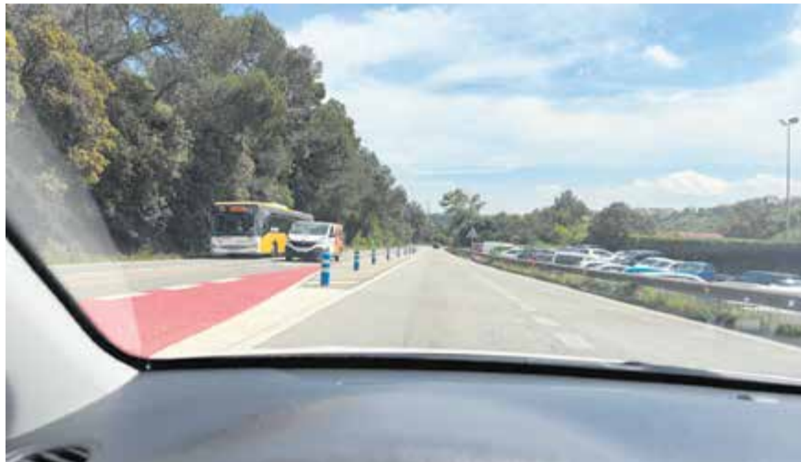
La B-124, en una imatge de dilluns passat, on es pot veure circulant un autobús de la línia C1.

El BRCat previst a la B-124 defineix les actuacions necessàries per millorar les prestacions dels serveis de transport públic per carretera entre Sabadell i Castellar del Vallès,