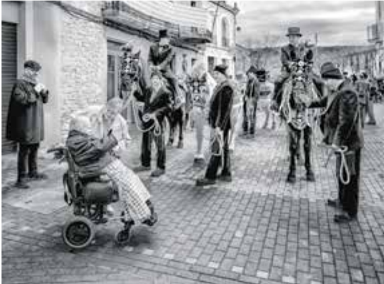
Primer premi al 54è Concurs Nacional de Fotografia Festa dels Traginers. || A. MARÍN