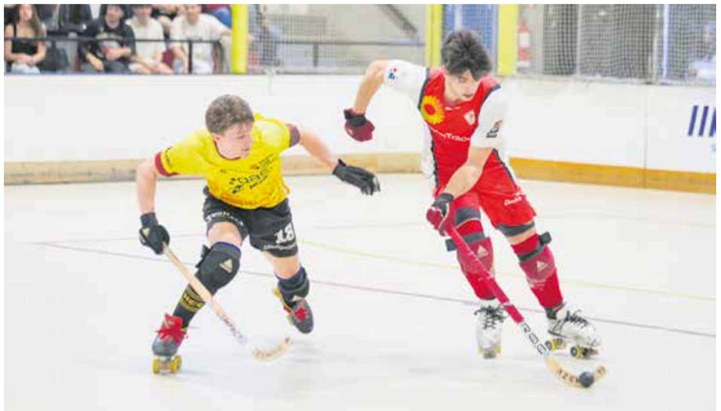
L'HC Castellar va viure un partit vibrant contra l'Arenys, que va aconseguir empatar amb el temps complet.

Els granes ara hauran de passar el tràmit de la visita del Vila-seca, un rival que es juga el descens de categoria, per a un partit que es