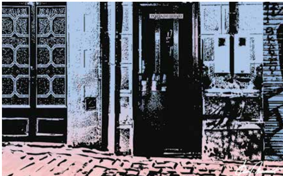
© Porta de servei. || JOAN MUNDET

ta o estrictament cristiana d'entendre la dignitat de les persones no s'ajusta als principis de competència ferotge que hom malda per imbuir-nos.