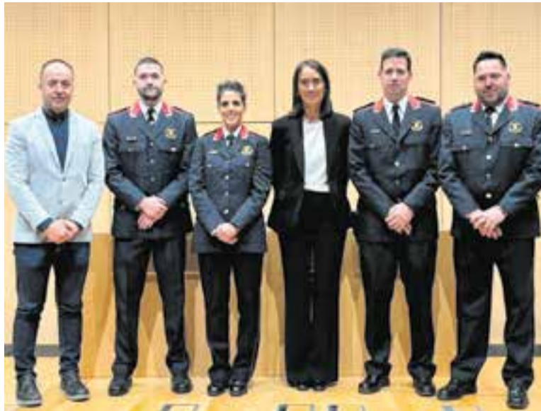
L'alcaldessa i el regidor de Seguretat Ciutadana amb els mossos castellarencs.

De fet, l'alcaldessa de Castellar va tenir l'oportunitat de felicitar en persona tres mossos i una mossos que són veïns de Castellar del Vallès i que van obtenir el reconeixement per accions de mèrit protegint i vetllant ciutadans i ciutadanes de la nostra comarca.