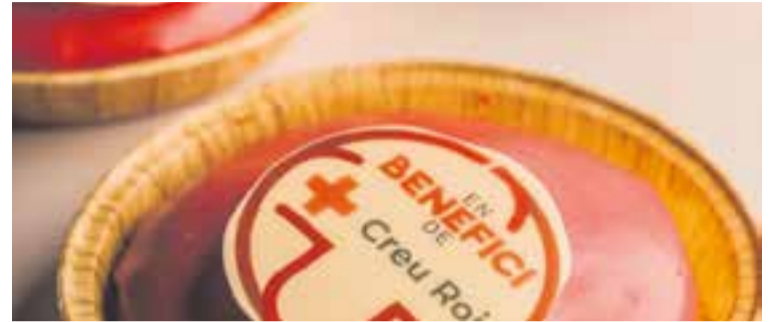
Imatge d'un dels pastissos solidaris que ven el forn de pa Valero.