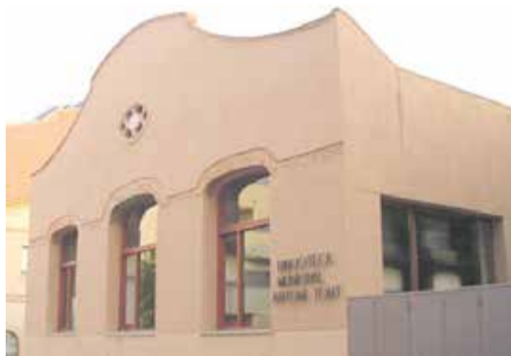
La Biblioteca Municipal obre un concurs i una exposició de comerç just.