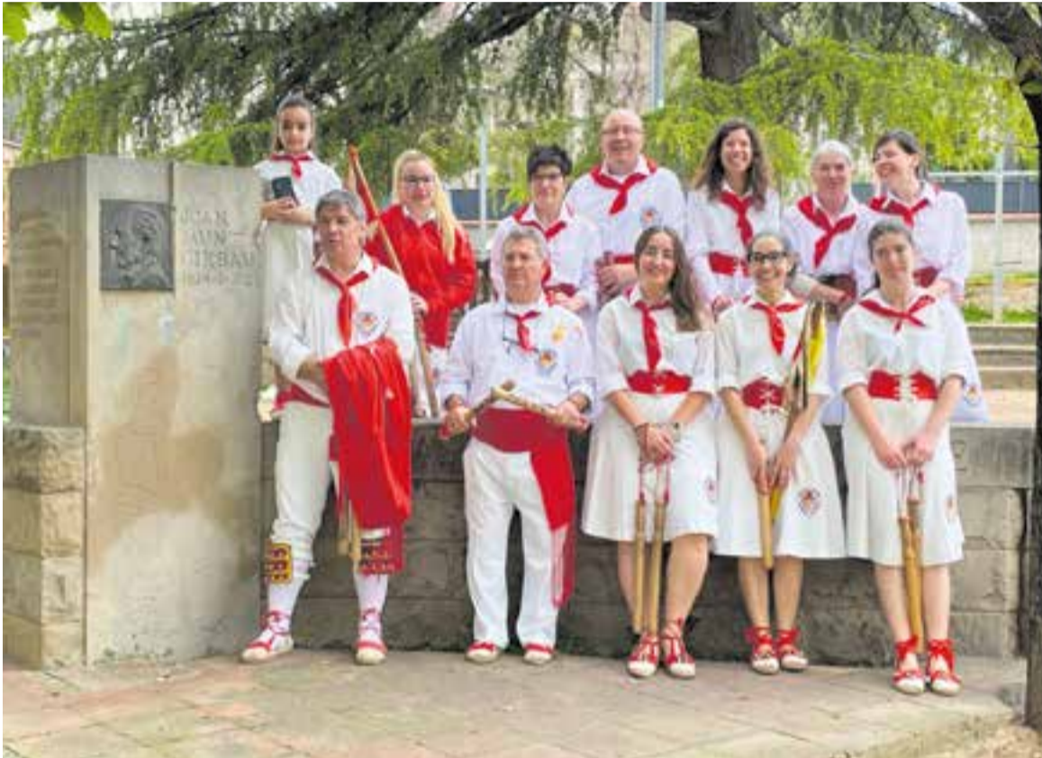
El Ball de Bastons de Castellar, a la plaça d'Albert, al costat del monument al mestre bastoner Joan Munt.

L'entitat ha col·laborat amb Suma+, els castellers i escoles de la vila