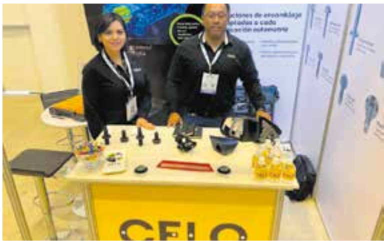
L'estand que ha muntat la companyia a la fira d'automoció de Querétaro.

L'empresa castellarenca té des de l'any passat una fàbrica a Guanajuato