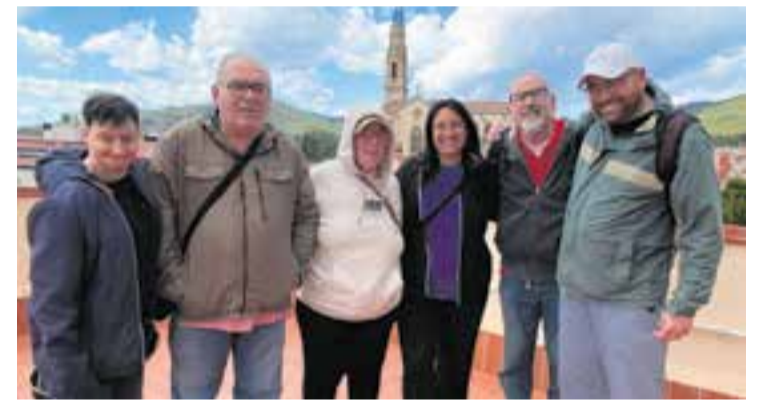
L'equip de 'Ràdio Club Social' en la gravació del cinquè episodi del programa. || R. G.

El cinquè episodi de Ràdio Club Social , una coproducció de Suport Castellar i de Ràdio Castellar, que s'emet mensualment dijous a les 12 h i que també es pot trobar a l'espai de pòdcast de lactual.cat , es va tenir de poesia. L'equip del programa, que va recordar totes les activitats que Suport Castellar va fer amb motiu de la diada de Sant Jordi, va recitar en directe alguns poemes d'autors catalans. Són els mateixos versos que els membres del Club Social van compartir amb alumnes de 1r i 2n de primària de diverses escoles de Castellar en el marc d'un projecte divulgatiu i cultural de l'entitat i de la comunitat educativa. D'altra banda, la influència de les noves tecnologies en l'aprenentatge dels infants i adolescents, la sobreexposició a les pantalles als centres educatius, també es va posar damunt la taula en l'espai de debat. Finalment, els membres del programa van aprofitar per fer recomanacions cinematogràfiques i per reivindicar l'assistència a les sales, per mirar les pel·lícules en pantalla gran. + || R. G.