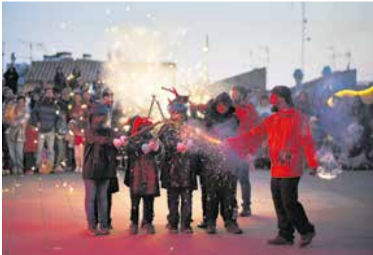
Moment de la Triforca de l'ETC l'any 2024, amb les Espurnes. || Q. P.

Enguany, l'Esbart Teatral de Castellar posa l'accent en la participació