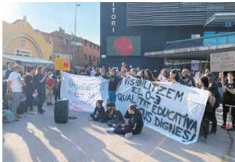
Moment de la manifestació a la plaça del Mercat que va tenir lloc el 10 d'abril. || R. G.

Respecte a les condicions laborals, Riera va afegir que s'han introduït millores al plec de la nova licitació com l'obertura d'una nova aula de 13 places a l'escola bressol Colobrers. "Si aturéssim la licitació, hauríem d'anar a un any més de pròrroga", va dir la regidora. Segons Riera, al nou plec hi ha moltes més hores dedicades a la diversitat. +