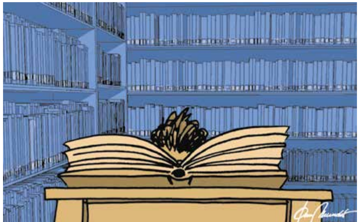
© Un llibre, dos llibres, un milió de llibres. || JOAN MUNDET

“Si no t'agrada un llibre, deixa'l estar. Tant se val que sigui un clàssic. Agafa'n un altre”