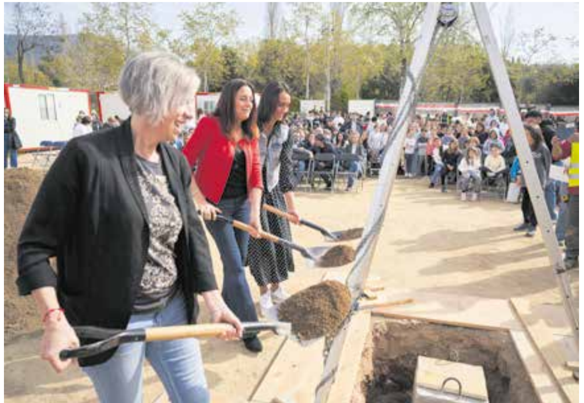
La directora del Sant Esteve, la consellera d'Educació i l'alcalde en la col·locació de la primera pedra de l'ampliació del centre.