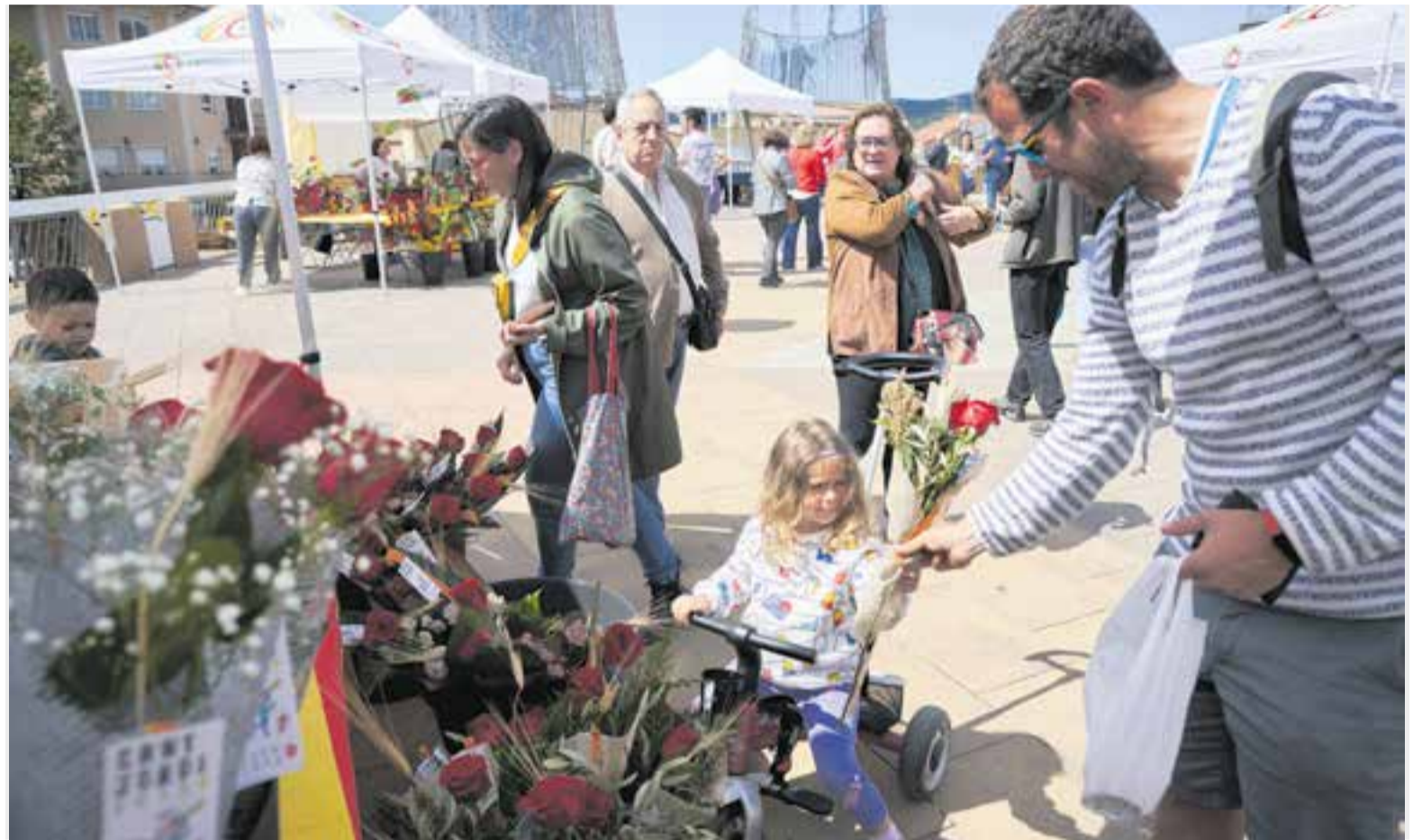
L'afluència de públic a la Fira de Sant Jordi va ser constant durant tot el dia a les parades de flors i llibres instal·lades a la plaça d'El Mirador.