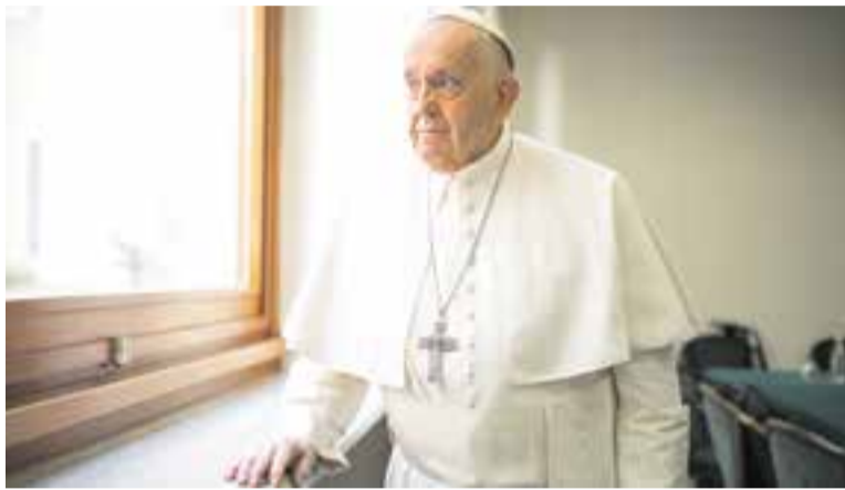
El papa Francesc, en una imatge d'arxiu, va morir dilluns als 88 anys.