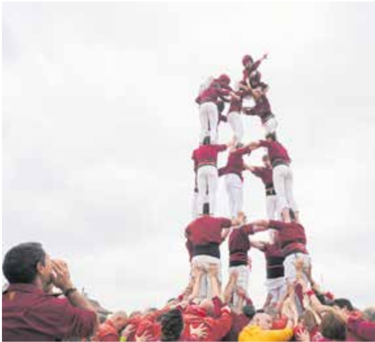
Moment en què els Capgirats carregaven el 5 de 6 a la plaça d'El Mirador.

Els Capgirats celebren l'11è aniversari amb un pilar de 5, i amb els Bous de la Bisbal i els Castellers de Montcada i de Rubí com a colles convidades