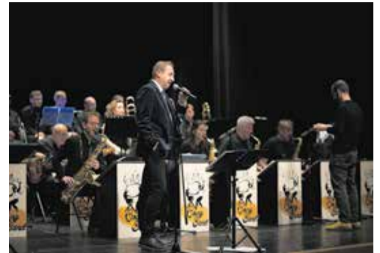
La Castellar Swing Band en el concert del 12 d'abril a l'Auditori.

La Castellar Swing Band es va posar de vint-i-un botó per estrenar nou repertori a l'Auditori. Tot plegat, el 12 d'abril passat amb el concert Castellar Swing Band toca Count Basie . "Count Basie va ser una figura determinant a l'hora de crear la sonoritat, l'orquestració i el llenguatge de la 'big band' . Va posar els canons d'aquest estil. Tot músic de 'big band' i de jazz en general ha d'haver tocat música de Count Basie" , explica Pol Leiva, coordinador de la banda. "El balanç del concert és molt positiu. A Castellar ens trobem com a casa. El públic respon molt bé i tot va anar molt rodat" , afegeix Leiva.