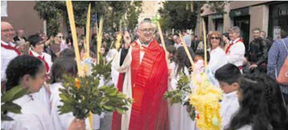
Benedicció del llorer, els palmons i les palmes per Diumenge de Rams a Castellar.