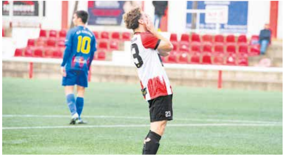
La UE Castellar ha de millorar en la faceta ofensiva si vol mantenir la categoria.