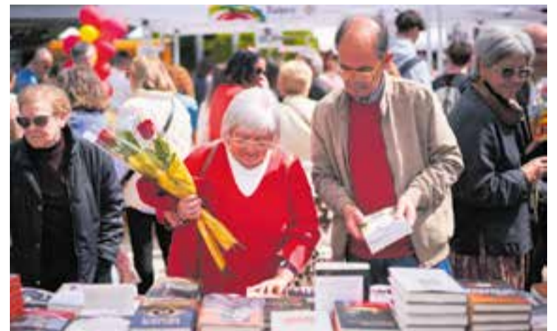
Una jove llegint una contraportada d'un llibre en una de les parades de la fira.

Segons Comerç Castellar, organitzadors de la Fira en col·laboració amb l'Ajuntament, en xifres generals, es van vendre més de 8000 roses a la plaça d'El Mirador durant la jornada de dimecres. Pel que fa als llibreters, de tot el volum de llibres que van portar a les seves parades els llibreters es va vendre un 70%. Aquestes xifres es corresponen a la major afluència que altres anys gràcies al bon temps. De fet, des de Comerç Castellar apunten que van haver d'ampliar l'horari de fira perquè, a l'hora de tancar, la plaça estava plena de gent gaudint de la fira i comprant a les parades.