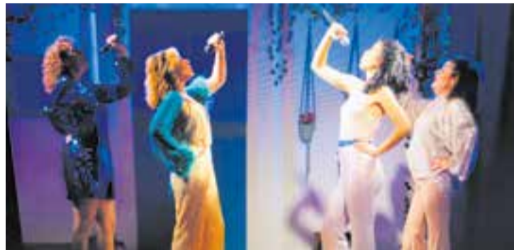
La Sala de Petit Format de l'Ateneu acull 'Mamma Mia' de Llum a Escena.