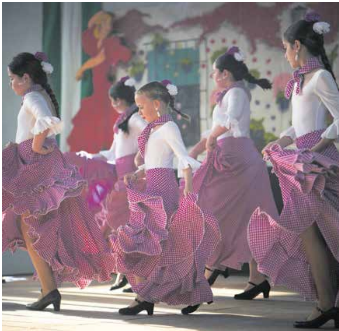
Moment de la Feria de Abril de la Casa de Andalusia de Castellar, a l'Espai Tolrà, l'any 2022.

Com a novetat, a la Feria de Abril d'aquest any hi participarà el Nelli, "un transformista que anirà fent diverses actuacions, i també es podrà gaudir d'una vocalista que es diu Conchi, de Sabadell" , afegeix Da Silva.