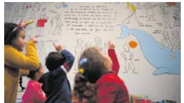
Alguns infants visitant la Biblioteca Municipal, fa tres anys. || Q. P.

I aquest dijous 24, al servei municipal, també es va fer la presentació del llibre Seculina. La bruixa que (en)canta , d'Anna Schnabel i Albert Pinya, a càrrec d'Acció Musical Castellar. + || M. A.