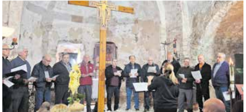
Imatge dels cants de la Passió a la 22a Trobada de Primavera al Puig de la Creu, Divendres Sant.