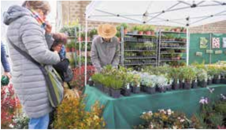
Una imatge d'una de les parades de la fira de l'any passat.

A més hi haurà una jornada tècnica sobre noves condicions climàtiques