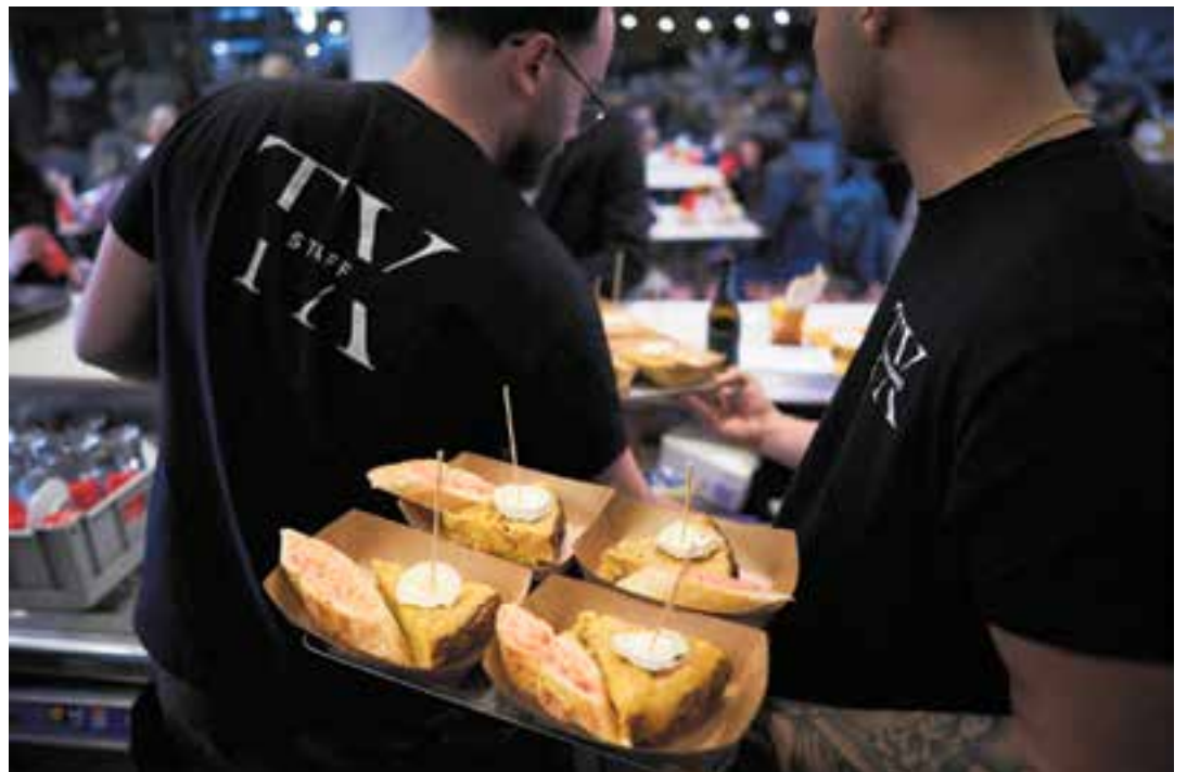
Cambrers del Txivarri servint la ració de truita G.O.A.T. que van preparar a l'establiment.

El dilluns dia 10 es farà l'entrega de premis i es donarà un xec de 50 € a la persona guanyadora, un premi que pot canviar en qualsevol dels establiments gastronòmics participants en el Truitàpa't 25. Per optar al premi, el client va haver de tastar un mínim de tres varietats en el transcurs dels tres dies de Truitàpa't 25, i dipositar les butlletes en les urnes que estaven ubicades en tots els establiments participants. Només s'han comptabilitzat aquelles butlletes amb les dades omplertes i que complien el requisit dels tres segells d'establiments gastronòmics diferents. A més de la Taverna del Gall i la Gallina, La Capritxosa i Llullu Cakes, van participar a la iniciativa Andreu Pastissers, Bar Nelson, Bistró XXI, Bruna Burger & Grill, Cal Pinxito, el Centre Feliuenc, Garbanzo Negro, La Fruiteria del Poble, La Masia del Racó, La Piparra, La Tribu Cafè & Bakery i Txivarri.+