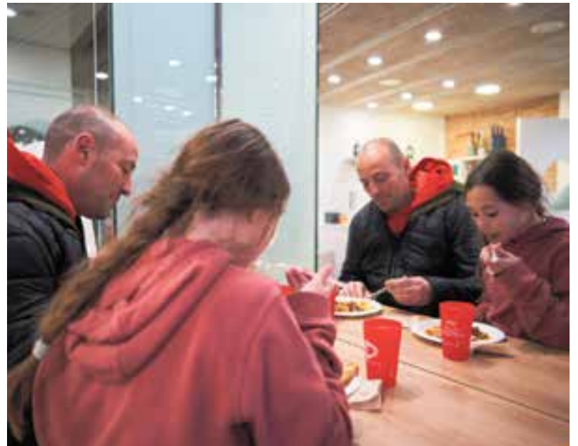
Diferents clients tastant la truita La Porca de Llullu Cakes.

Són les que es van servir entre el 27 de febrer i l'1 de març