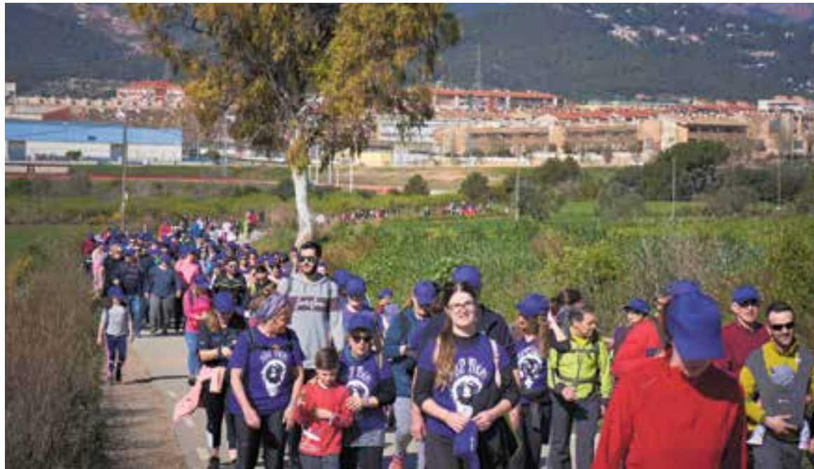
Imatge d'arxiu de la caminada 'Passes per les dones' amb motiu de la celebració del 8M. || Q. P.

Un dels actes centrals de la programació serà la Marxa Lila, que tin-