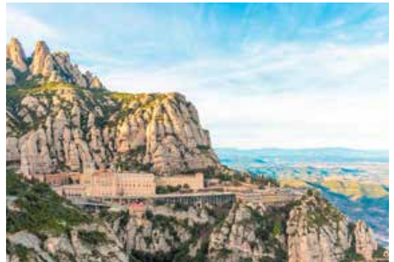
La Travessa Castellar-Montserrat, amb les inscripcions obertes fins al dia 12.

Les inscripcions encara poden fer-se fins al 12 de març a les 23:59 des de la web del Centre Excursionista de Castellar ( https://cecastellar.cat/ ) o directament des de la FEEC ( https://inscripcions.feec.cat/ ).