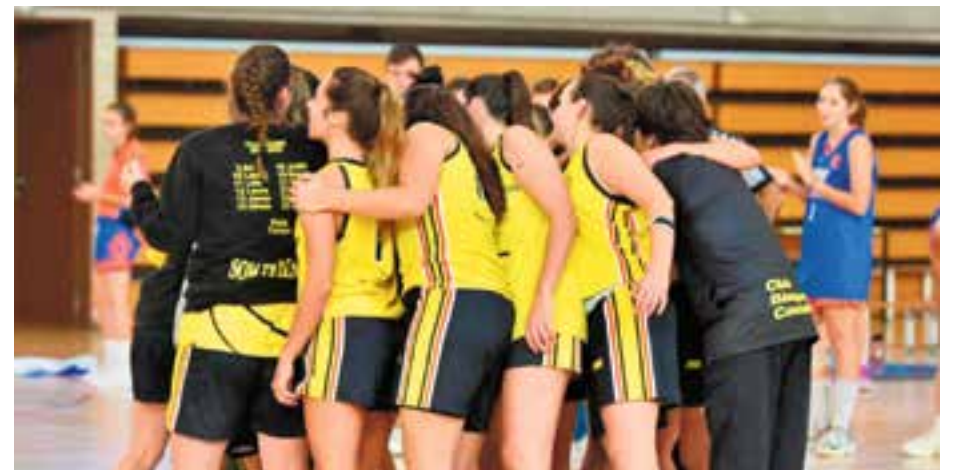
El femení vol sumar la 14a victòria consecutiva al Puigverd contra el CB Roda de Ter.

El CB Sant Josep Obrer i el CB Roda de Ter seran els pròxims rivals del CB Castellar masculí i femení en Lliga, en una jornada en què la victòria és fonamental.