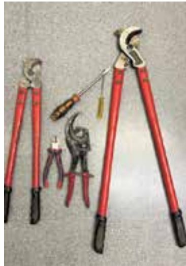
A l'esquerra, la furgoneta amb el coure tallat, i a la dreta, diverses eines utilitzades presumptament per cometre el robatori.

La policia local de Castellar del Vallès va detenir la setmana passada dos homes com a presumptes autors d'un robatori de coure. La detenció va ser possible gràcies a l'avis d'una ciutadana, que va alertar sobre la presència d'una furgoneta i d'uns individus que si-