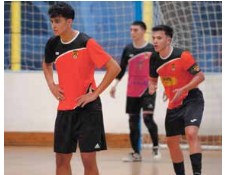
L'FS Castellar va veure com volaven els tres punts a la part final del partit. || M. MOYA

Això passa just abans de visitar la pista del líder, l'AFS Sant Quirze, un rival que només ha deixat escapar nou punts en tota la temporada, però que sap el que és perdre contra l'FS Castellar, que li va infligir un sever correctiu al Blume en la primera volta, ja que el va golejar per 6-3. Una situació que diumenge (19.00 h) esperen tornar a repetir. +|| A. SAN ANDRÉS