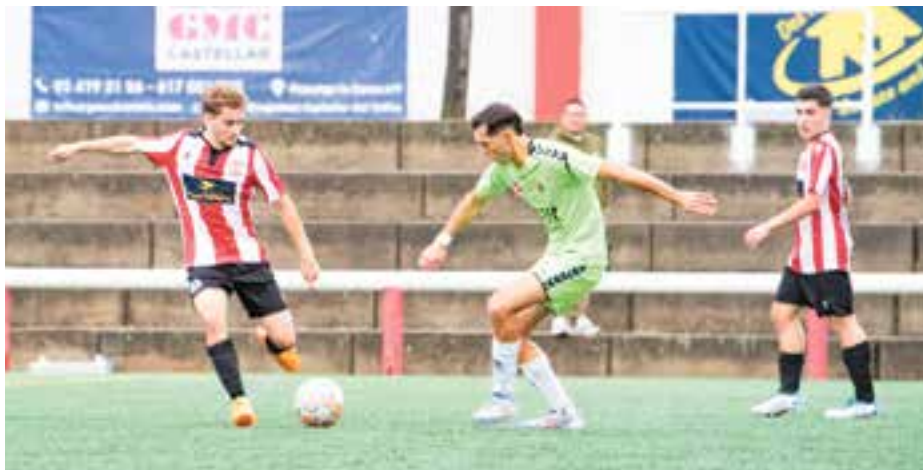
La UE Castellar, obligada a seguir sumant contra la UE Torroella. || A. SAN ANDRÉS

Una setmana de descans ha servit per recuperar efectius i centrar-se en l'important partit que la UE Castellar disputarà aquest cap de setmana contra la UE Torroella (diumenge, 17.00 h), rival directe en la zona mitjana de la taula.