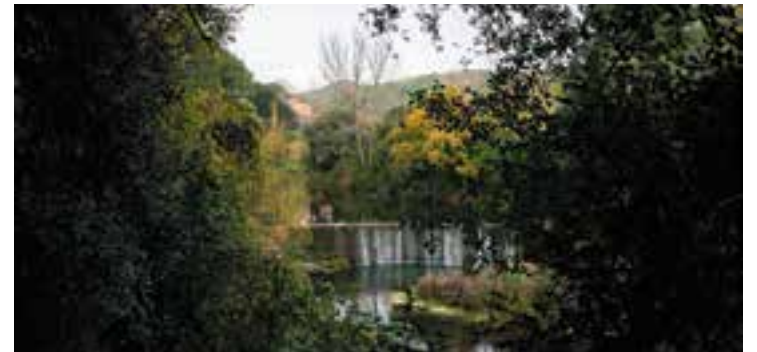
Presa prop de la font de la Riera, per on passarà l'itinerari.

El diumenge, 30 de març, se celebrarà una nova caminada, inclosa dins el cicle ItineraRius, entorn el riu Ripoll anomenada "Aigua, història i vida". Tota la passejada, que s'iniciarà a les 10 del matí des de l'aparcament del Serrat (entrada de Sant Feliu del Racó), transcorrerà dins el terme municipal de Castellar. Es tracta d'una ruta circular i guiada per experts, d'uns 5 km de longitud i de baixa dificultat, durant la qual es descobrirà el patrimoni hidràulic, històric i natural de tota aquesta zona, com ara l'antic pont que portava a Cal Pinyot, la font de la Riera, el molí d'en Barata i el mirador del gorg del Diable. Un cop finalitzat el recorregut, es durà a terme una visita a l'interior de l'església de Sant Feliu del Racó, documentada el segle X. L'activitat, apta per a tots els públics i amb places limitades, és gratuïta, tot i que per prendre-hi part cal formalitzar la inscripció prèvia fins al 26 de març a https://intranet.besos-tordera.cat/index.php/apps/forms/s/N5aLNZP9fiYM6CzcQTe4A2gG o al web fundadorivus.cat . Els participants rebran avituallament i una bossa de regal. La caminada està organitzada per la Fundació RIVUS, l'Ajuntament i el Consorci Besòs Tordera. ✦ || REDACCIÓ