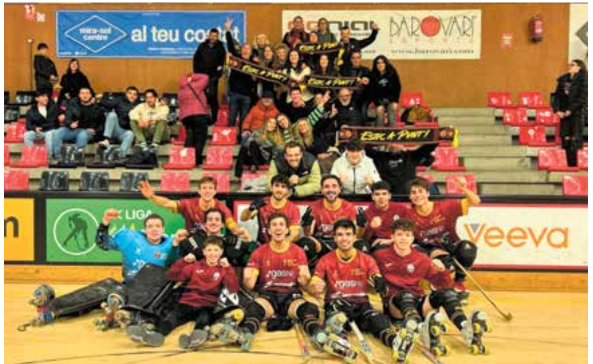
A l'HC Castellar li queden nou finals per poder lluitar per l'ascens a OK Plata.

Aquesta setmana, el Voltregà (dissabte, 18.30 h), cinquè classificat, visitarà el Dani Pedrosa. +