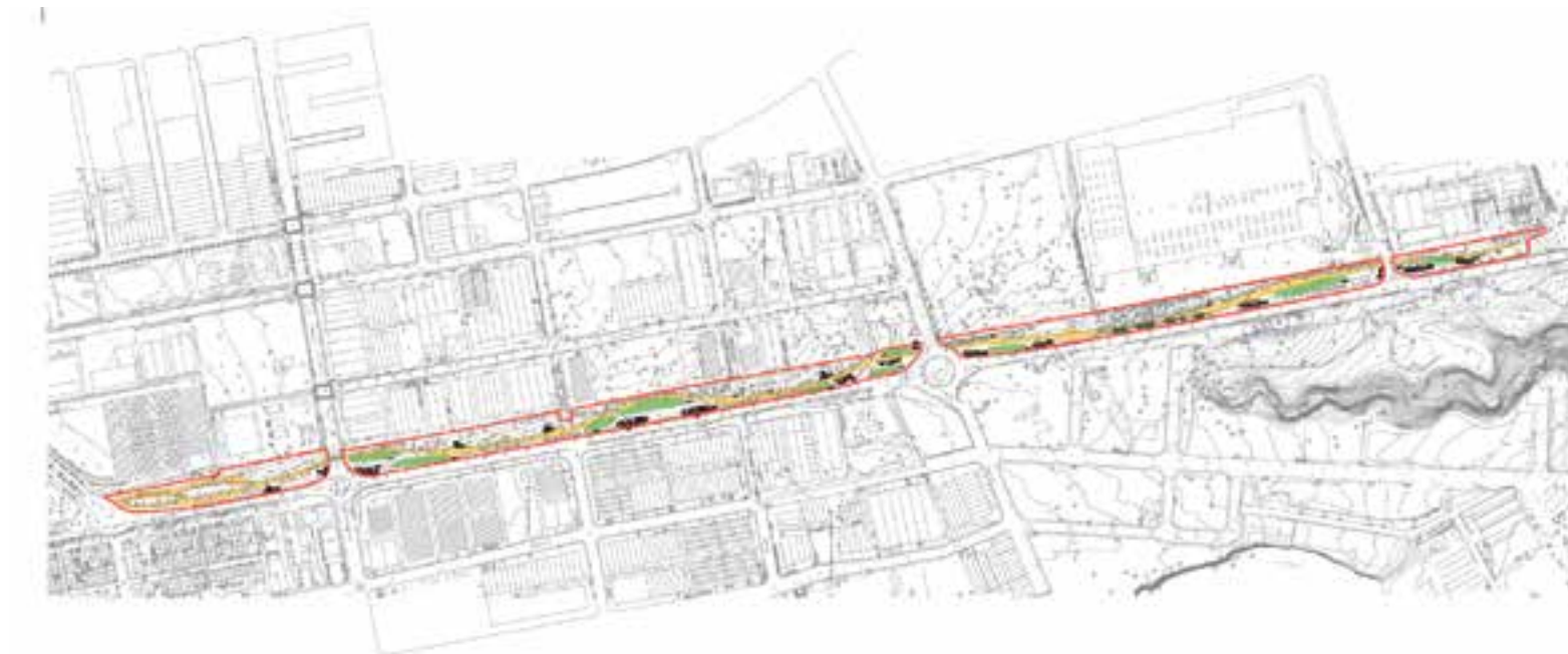
Imatge del plànol de l'àmbit de la millora de la zona verda que recorre el polígon del Pla de la Bruguera amb l'actuació prevista.

Aquesta actuació es divideix en tres àmbits: aigua (renovació de la xarxa de subministrament d'aigua potable), energia (instal·lació de vehicles elèctrics) i mobilitat (pavimentació de calçades, nova senyalització i millora de la zona verda). Sobre aquests tres àmbits, el regidor de Promoció Econòmica destaca l'actuació en matèria de mobilitat i la de la zona verda. “La nostra intenció és poder acostar els polígons a la ciutadania, tenir-los més a prop i que les empreses for-