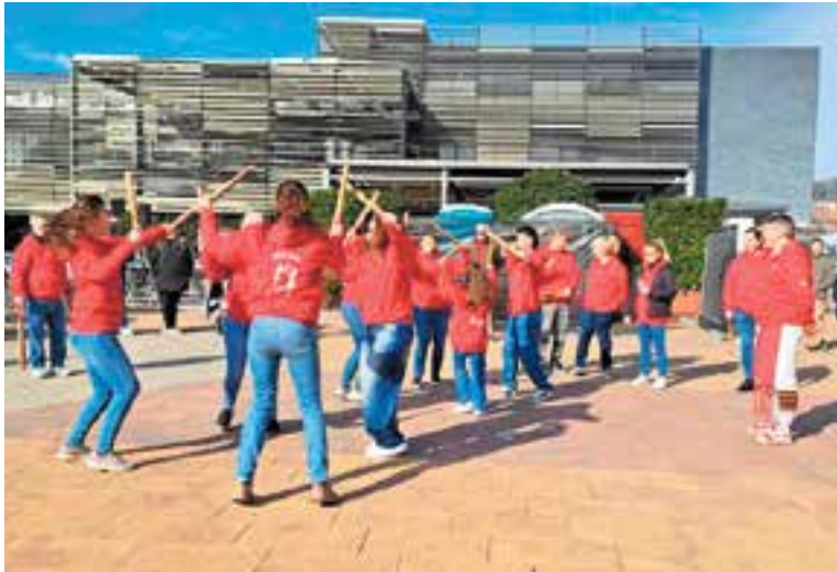
El Ball de Bastons a la ballada de la Calçotada Popular, el 2 de febrer.

Després del centenari celebrat el 2024, l'entitat reinicia les ballades