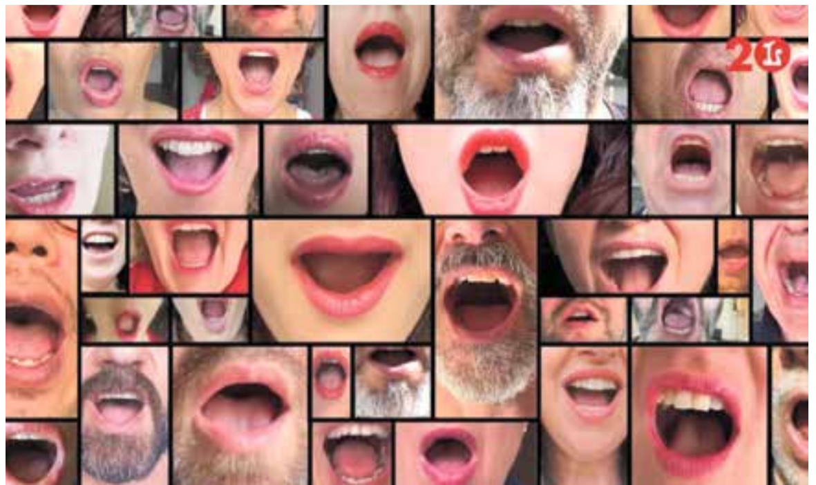
Un fotograma del vídeo que recull la interpretació de l'ària de 'Turandot'.

Es va triar 'Nessun dorma', una ària per a tenor del darrer acte de l'òpera Turandot, de Giacomo Puccini, “perquè lliga molt amb els moments de confinament” . El títol d'aquesta ària significa 'que ningú dormi' i fa referència a la proclamació que la princesa Turandot fa per prohibir que ningú a Pequín dormi fins que no es trobi el nom del misteriós príncep Calaf. La princesa mira els estels des de la seva cambra amb l'esperança de trobar el nom del príncep, que al seu torn ha llançat el desafiament i canta que si el nom no és descobert la freda princesa es casarà amb ell.