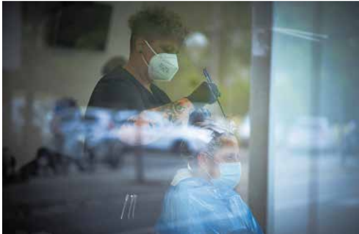
De Pablo és una de les perruqueries de la vila que ha reobert amb mesures de precaució i de distància.