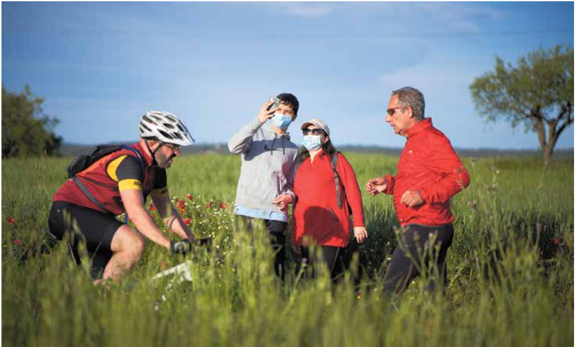
L'aire fresc de l'entorn de Castellar ha atret corredors, passejants i ciclistes. Dissabte al matí va ser el primer dia de desconfinament general per sortir a passejar i fer esport, com mostra la imatge.

Les primeres sortides per fer esport i passejar des de l'inici de l'estat d'alarma retroben els castellarencs amb la natura