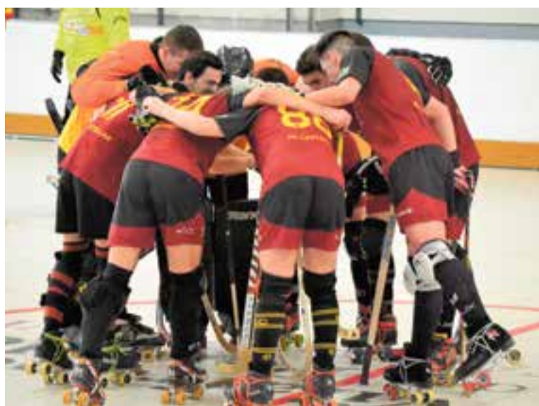
L'HC Castellar a Vilafranca, després de la victòria enfront del Sant Ramon. || CEDIDA

Ara el Castellar és desè a la classificació, tot i que la diferència entre el cinquè, el Santa Perpètua i l'onzè és de només dos punts, motiu pel qual, una victòria en el pròxim partit, precisament enfront dels de Santa Perpètua (divendres 20:45, al Dani Pedrosa), podria fer pujar diverses posicions als grans a la taula. + || A. SAN ANDRÉS