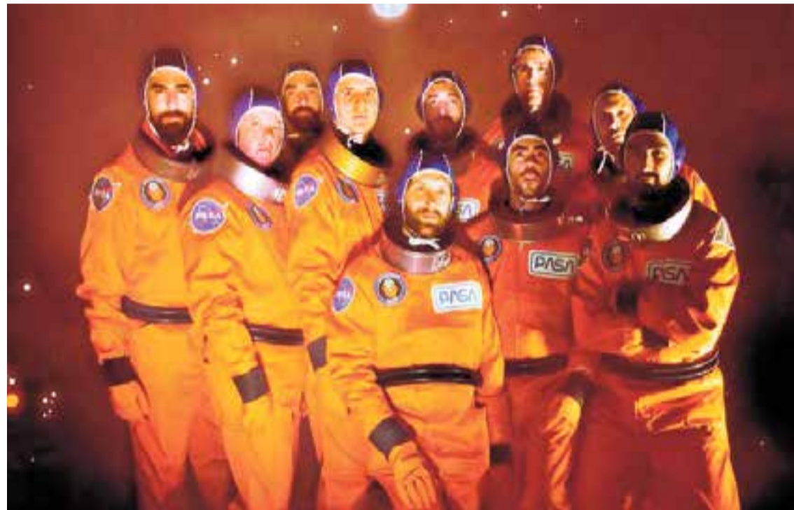
The Penguins, en una imatge promocional, actuen dissabte a l'Auditori Municipal Miquel Pont.

Doncs sí. Recuperem temes anteriors i ara també hem fet composicions pròpies. Fins ara, havíem estat molt curiosos, això de construir o compondre cançons ens feia respecte, encara no ens atrevíem. Ens havíem limitat a fer adaptacions del cançoner tradicional. Ara, tenim el tema estrella que es diu 'Tira pel dret', on la prota-