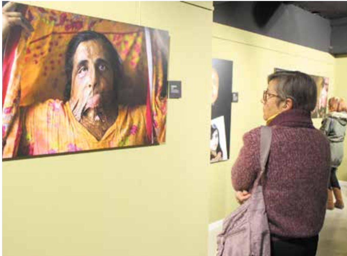
Inauguració de la mostra fotogràfica sobre Pakistan, dimecres passat, a la Sala d'Exposicions d'El Mirador