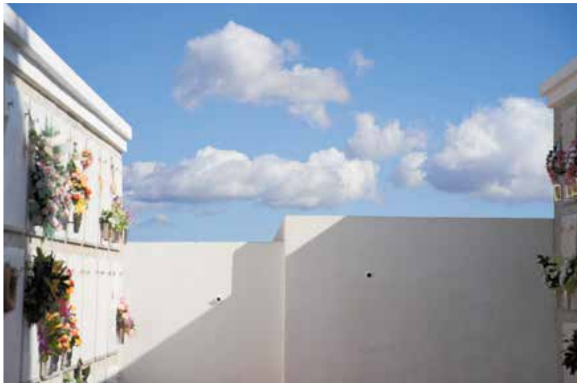
Tots Sants continua sent l'època en què el cementiri rep més visites i els nínxols tenen més flors.

Els visitants també han aprofitat per fer consultes i contractar serveis, explica l'assessora. “Per pagar rebuts, per fer trobades de difunts o si volen