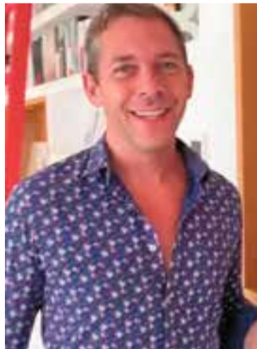
Romain Puértolas, al vídeo.

L'escriptor ja havia visitat la nostra vila l'any 2018, quan va compartir una xerrada amb els alumnes de francès de l'Institut Castellar a la Sala d'Actes d'El Mirador, en el marc d'un projecte dels alumnes de segon de batxillerat de l'institut sobre la seva novel·la. Durant la visita de Puértolas a Castellar, els joves van poder fer-li preguntes i resoldre dubtes i curiositats sobre la novel·la. Ja aleshores, Puértolas va explicar que s'estava rodant una pel·lícula sobre el llibre, que ara ja s'ha pogut veure feta realitat. + || M. A.