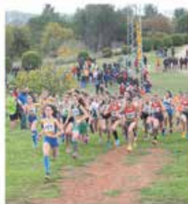
Club Atlètic Castellar

+ INFO: www.castellarvalles.cat , www.comercastellar.cat