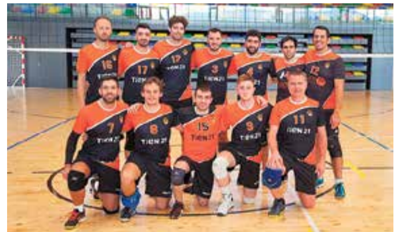
El sènior A va aconseguir la victòria davant del Martorell (1-3).

Pel que fa a les categories masculines, el sènior A va imposar-se per 1 a 3 (25-27/25-21/17-25/14-25) enfront del CV Martorell i també és líder amb 14 punts del grup A de Segona Catalana. El B, amb un 3-0 (25-19/25-17/25-17) davant l'Acadèmia Barcelona ocupa la cinquena posició del grup D.