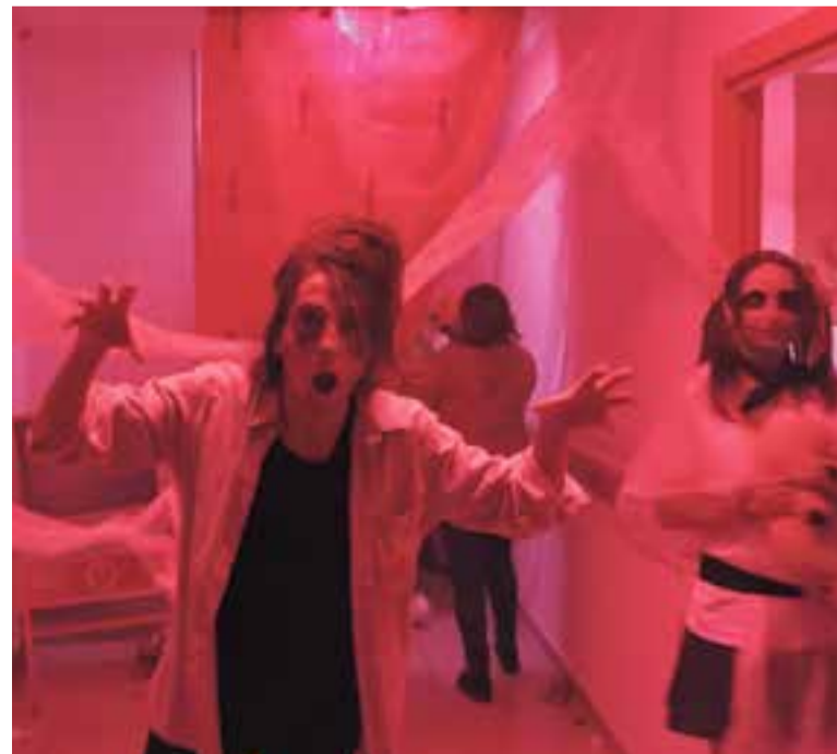
Un infermera cadavèrica del túnel solidari del terror de la Creu Roja

El túnel del terror, finalment, va aconseguir recaptar 187 euros, gràcies al preu de l'entrada, que era d'1 euro. †