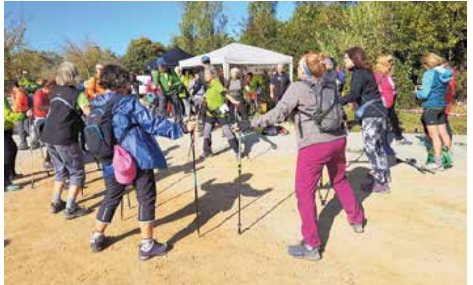
Algunes de les participants en la primera edició de la Marxa Nòrdica del Centre Excursionista.

La I edició de la Marxa Nòrdica organitzada pel Centre Excursionista de Castellar va tenir un total de 82 participants que van completar els 10 km de recorregut.