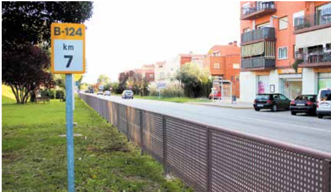
L'actuació del Departament de Territori i Sostenibilitat s'allargarà fins al quilòmetre 7 de la B-124, just a l'entrada de la vila. || I. VIZUETE

Les licitacions que ara s'impulsen refermen la voluntat del Departament de vetllar per la seguretat viària, "en aquest cas, mitjançant la conservació del conjunt d'elements que integren cada carretera", segons fa públic el departament en una nota de premsa. Les tasques que s'inclouen tenen com a objectiu garantir un nivell òptim de