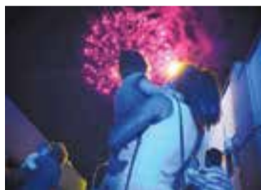
Cuando la ilusión se adueña de ti @fermins19 - Fleming Fus More