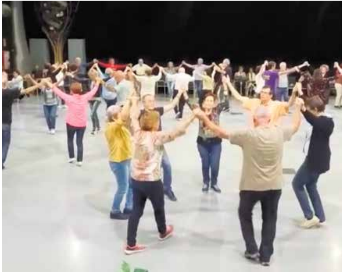
La Sala Blava de l'Espai Tolrà es va omplir de balladors i balladores, diumenge passat.