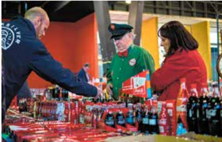
Una de les anteriors trobades de col·leccionistes de la Coca-Cola a l'Espai Tolrà.