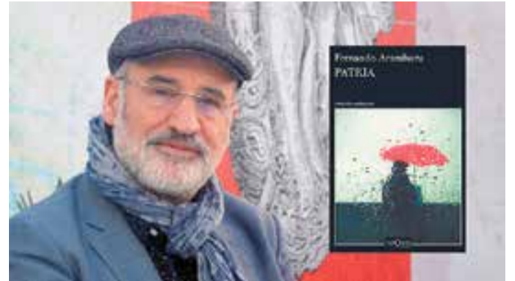
De tall de la portada de la novel·la 'Patria' amb el seu autor Fernando Aramburu.