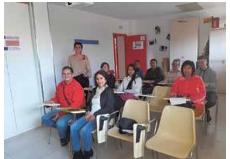
Alguns dels assistents al curs de coneixement de la societat catalana.

Les persones que realitzin aquesta oferta formativa obtindran un certificat per a cada mòdul fet i, un cop completats els tres, rebran el certificat d'acollida, una certifica-