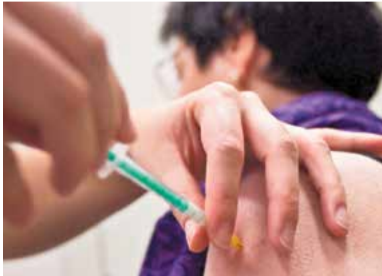
La campanya de vacunació s'allargarà fins el 15 de desembre

El Departament ha adquirit 1.220.000 dosis de vacunes que estaran disponibles a tots els Centres d'Atenció Primària (CAP) i centres vacunals amb l'objectiu de prevenir la grip i evitar les complicacions i la mortalitat associada a aquesta malaltia. El període òptim de vacunació és des del 28 d'octubre fins el 15 de desembre, uns quinze dies abans que la grip arribi al llindar epidèmic, que aquest any se situa als 98,1 casos per 100.000 habitants. Tot i això, les dosis estaran disponibles durant tota