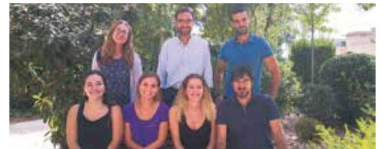
L'alcalde, amb alguns dels auxiliars de conversa d'aquest curs.

Els auxiliars treballaran a l'aula, juntament amb les mestres, facilitant que els infants puguin gaudir i practicar l'anglès, interactuant al màxim possible en els contextos quotidians i acadèmics. A més, augmentaran la incidència de la llengua oral prioritzant les activitats de conversa en grups reduïts amb la intenció d'assolir diferents objectius específics. Els set professionals que treballaran amb els infants provenen de l'empresa adjudicatària del projecte, Ponrec Assessors SL. ➔