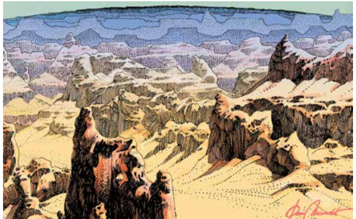
© Canvi climàtic extrem. || JOAN MUNDET

El canvi climàtic afecta a totes les regions del planeta, i com veiem, també molt a prop de casa nostra. Malgrat això, podem aturar el canvi climàtic o si més no, minimitzar el seu gran impacte. Si els humans hem sigut qui ha sobreexplotat els recursos de la Terra i ha generat gran part dels efectes del canvi climàtic, també hem de ser capaços d'arreglar allò nociu que hem generat al planeta. Tenim diversos exemple a seguir de projectes que es duen a terme i que poden ser molt útils.