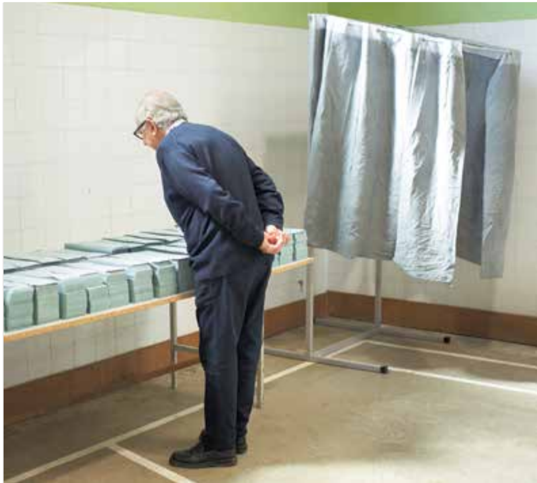
Les darreres votacions van ser el passat 26 de maig. A la imatge, un ciutadà mira les paperetes a l'Emili Carles.

La jornada es viurà a la vila en un total de set col·legis electorals on es distribuïran 14 seccions i 25 meses. Cal re-