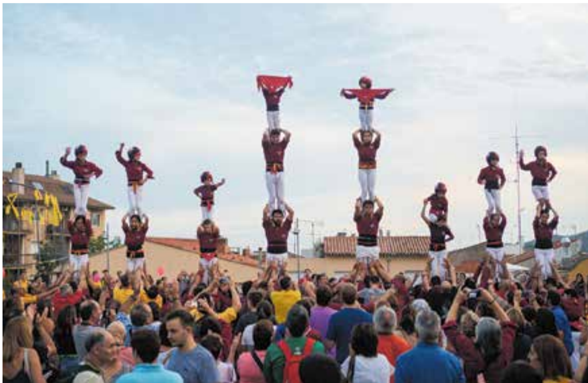
Els Castellers de Castellar, durant una actuació el setembre del 2018, a la plaça d'El Mirador. || Q. PASCUAL