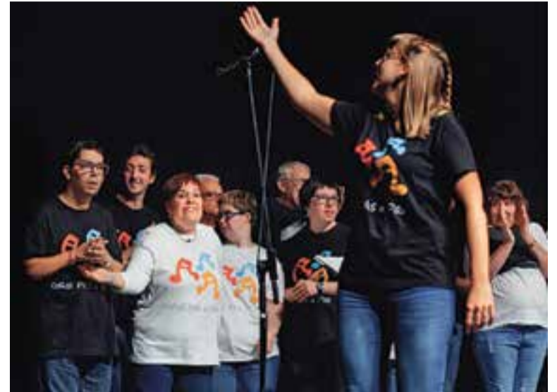
La coral Pas a Pas actuarà al Festival Som el 26 d'octubre.

Finalment, el 30 d'octubre, a les 19.30 hores, la Biblioteca acollirà l'espectacle musical traduït en llengua de signes, La Veu Silenciosa . ➔