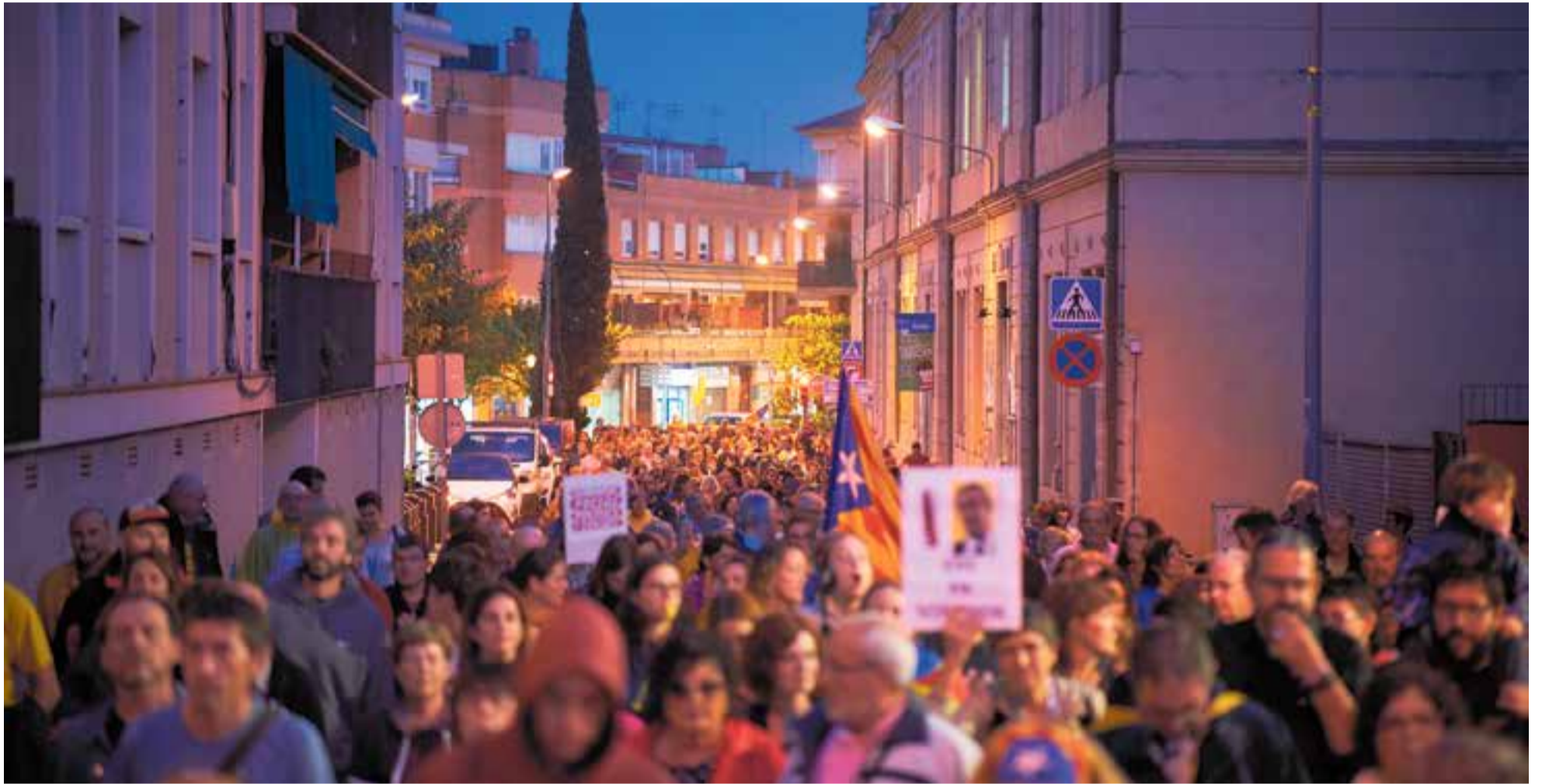
La principal acció reivindicativa es va dur a terme dilluns al vespre: uns 500 vilatans van marxar pels carrers del centre fins a arribar als Jardins del Palau Tolrà.

Mig miler de vilatans es van concentrar dilluns al vespre al Palau Tolrà. El CDR va promoure actes de protestes durant la setmana