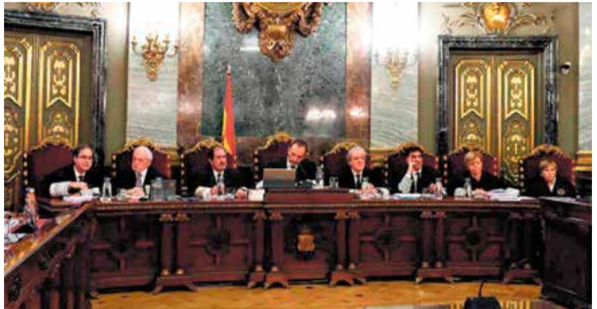
El tribunal que ha jutjat els polítics i líders socials independentistes durant el judici al Tribunal Suprem.