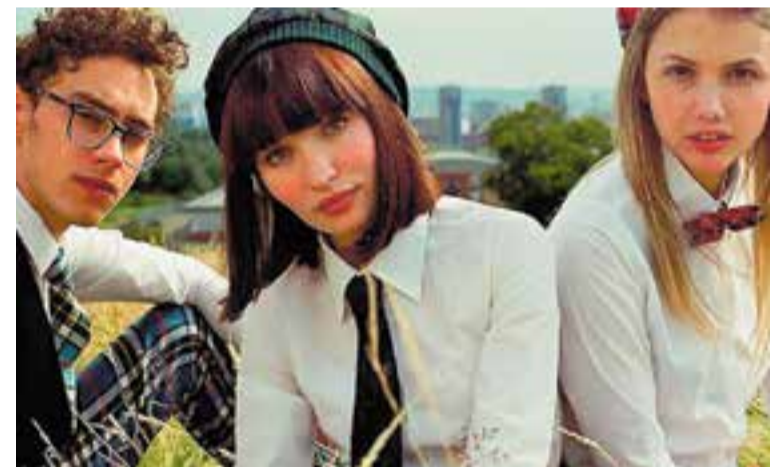
'God Help the Girl', la pel·lícula que inspira 'Com tu vols que soni', properament a l'ETC.

Si ets propietari i tens un habitatge per llogar, t'ofereim: