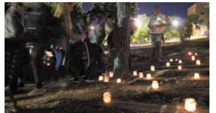
Ofrena floral a Lluís Companys, dimarts passat, impulsada per ERC Castellar. || R.G.