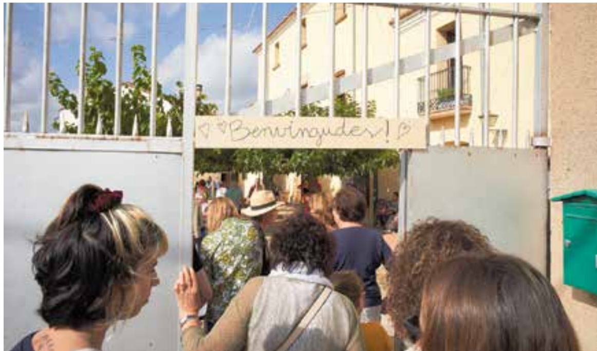
Entrada a les instal·lacions de la Masia de Can Carner diumenge passat durant les portes obertes.

L'espai de Can Carner s'ha convertit en un projecte per anar construint de mica en mica el futur d'una dotzena de famílies que hi aniran a