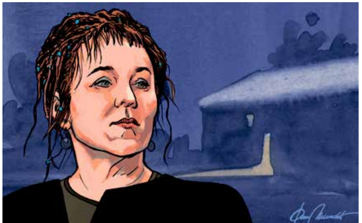
© Olga Tokarczuk. | JOAN MUNDET

w lustrach ('Ciutats en miralls'), del 1989, a Prowad swój plug przez koci umarłych ('Llaureu sobre els ossos dels morts'), una novel·la policíaca del 2017 que ja té adaptació cinematogràfica i tot.