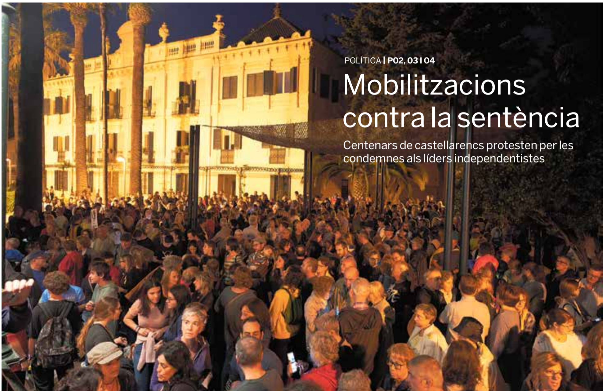
Uns 500 vilatans es van concentrar als Jardins del Palau Tolrà després de marxar pels carrers del centre en protesta per la sentència.

Centenars de castellarencs protesten per les condemes als líders independentistes