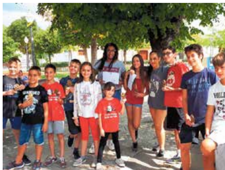
Participants en el torneig d'escacs de Festa Major.