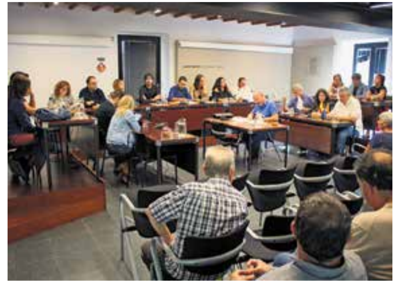
Imatge del ple extraordinari celebrat dijous a Ca l'Alberola.

Per part de l'equip de govern, s'ha "lamentat el patiment que la situació dels polítics catalans pugui generar a persones individuals, les seves famílies o als sentiments col·lectius" , ha llegit l'alcalde. De fet, les dues propostes només coincideixen a