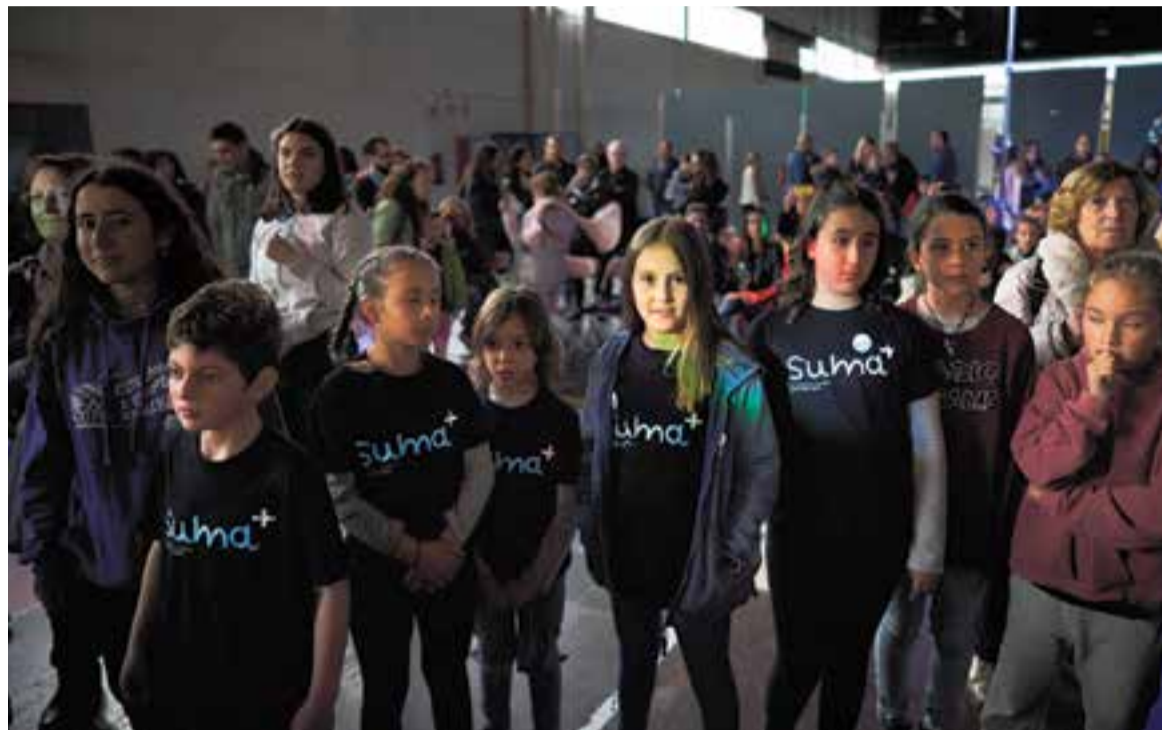
Uns joves participants a la Marató per la Diversitat que va organitzar Suma + Castellar el març per recaptar fons.

Tot i no ser l'administració competent, l'Ajuntament ja va destinar el curs passat una partida extraordinària de 30.000 euros -destinada a su-