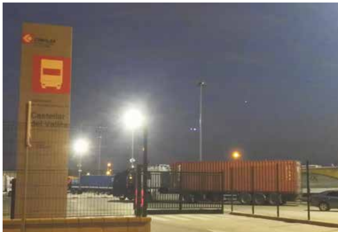
Truck Castellar, l'aparcament de camions al polígon del Pla de la Bruguera, ja compta amb la il·luminació LED.

A més de millorar la visibilitat de les instal·lacions, el canvi n'ha reduït el consum considerablement. Aquestes mesures són les primeres de tot un seguit de canvis, com la instal·lació de sis punts de recàrrega i la millora en l'actual oferta de places de la infraestructura previst