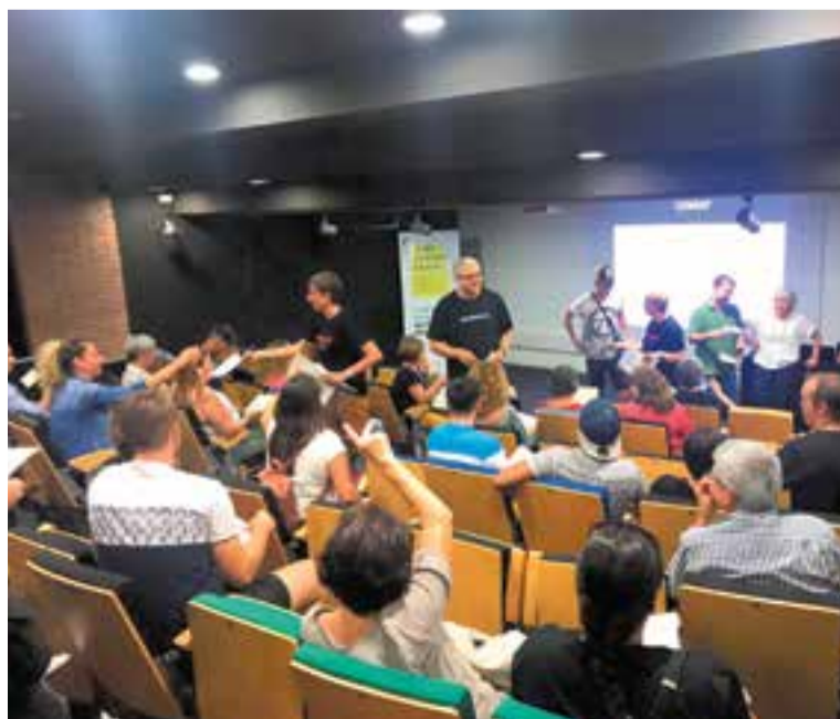
La sala d'actes d'El Mirador va acollir la presentació del curs de l'Escola d'Adults.

D'altra banda, l'Escola Municipal d'Adults ha comptabilitzat fins al moment de començar el nou curs un total de 270 inscripcions. El centre ofereix estudis de formació instrumental de primer, segon i tercer nivell, ensenyaments d'anglès, català, castellà i informàtica (novetat d'enguany), graduat d'educació secundària (GES), cursos de preparació per a les proves d'accés