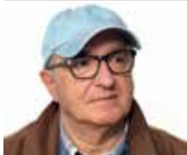
JACINT TORRENTS Escriptor

posades en molts centres i galeries d'art de tot el món.