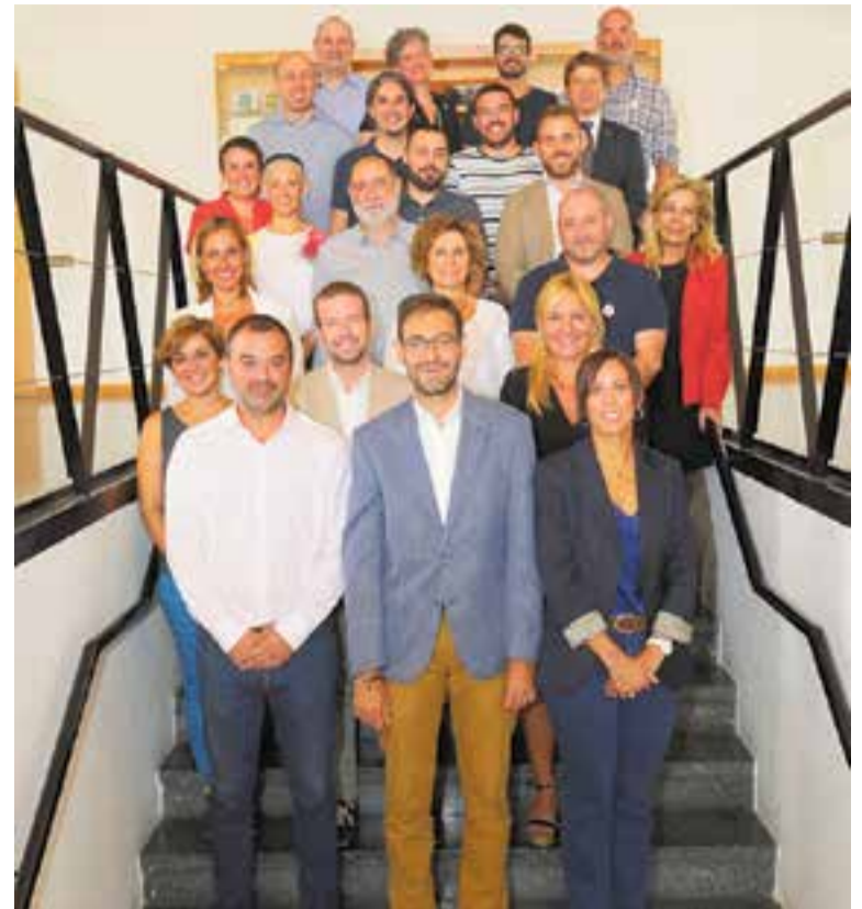
Les alcaldesses i alcaldes de la comarca es van trobar dilluns passat.

A Castellar, l'equip de govern sorgit de les eleccions municipals va marcar ja a principis de juliol com a prioritari per a aquest mandat incorporar tot un paquet de mesures a favor de la sostenibilitat i contra el canvi climàtic. D'entrada, es va crear la Regidoria de Transició Ecològica per lluitar activament contra la situació d'emergència climàtica. Aquest objectiu polític té com a full de ruta un decàleg que estableix un primer compromís amb deu mesures que es duran a terme durant aquest mandat. Les accions més importants són