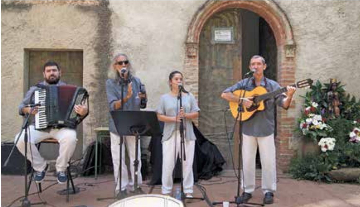
El grup Port Vell va oferir un repertori d'havaneres a la Festa de les Maredeus Trobades.