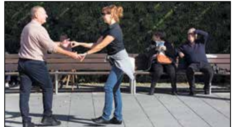
Balladors de swing durant un concert de la Castellar Swing Band.

Tornen els cursos de ball a SonaSwing, pensats per a totes les persones que vulguin aprendre a ballar el lindy hop, el charleston i el jazzsteps. Les sessions tindran lloc a la Sala Blava de l'Espai Tolrà, cada dilluns, a partir del 7 d'octubre. Els jazzsteps (swing individual) es farà de 19.30 h a 20.30 h, el lindy hop de nivell intermig, de 20.30 h a 21.30 h, i els lindy hop de nivell inicial, de 21.30 h a 22.30 h. Les inscripcions ja són obertes a sonaswingcastellar@gmail.com o al telèfon 677 37 22 82. +