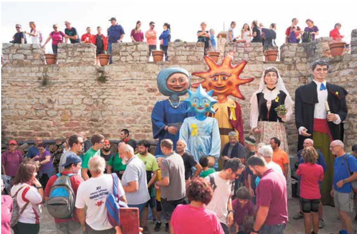
Els gegants de Castellar, El Sol, La Lluna i l'Estel, juntament amb els de Sentmenat, la Caterina i el Menna, al pati de l'ermita del Puig de la Creu. || Q. PASCUAL