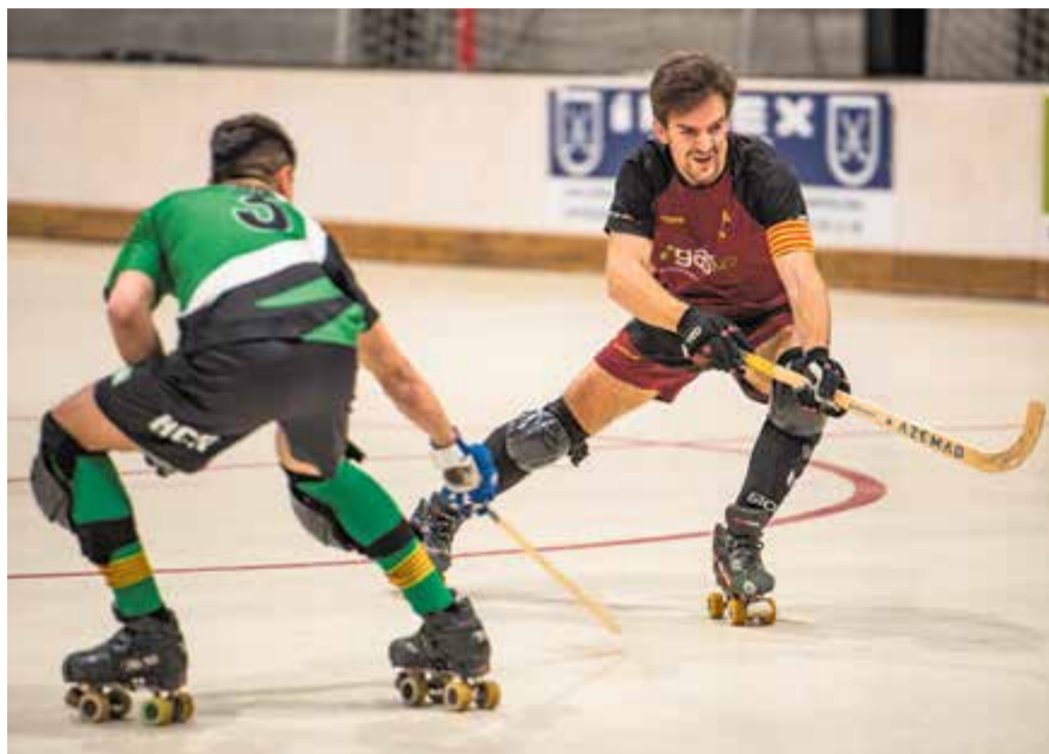
L'HC Castellar s'enfronta a una temporada difícil en què el repte màxim serà el retorn a la Primera Catalana. || A. SAN ANDRÉS

va debutar a la Lliga contra el PHC Sant Cugat, filial de l'equip de l'OK Lliga, un rival sempre complicat que mai és el més adequat per estrenar una categoria. El resultat va ser de derrota per 5 a 7, però encara queda el regust d'haver vist un equip que aconseguix fer gols. Una assignatura que la temporada passada va quedar pendent per al setembre i que sembla que ha recuperat a la revàlida del novè mes, com es feia abans.