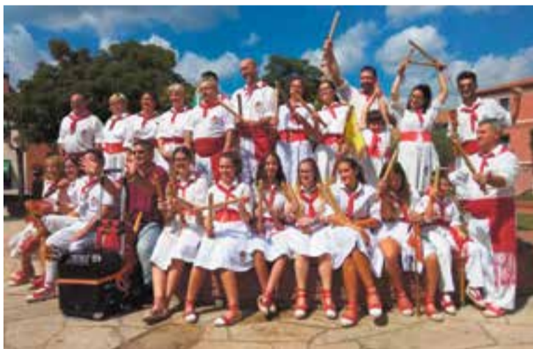
Els Bastoners de Castellar a la plaça Major.