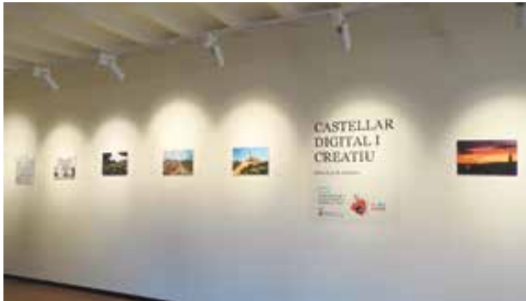
Algunes de les fotografies premiades al concurs 'Castellar digital'.

Per Festa Major, es va inaugurar l'exposició 'Castellar digital i creatiu' amb les deu fotografies premiades al I Concurs de Fotografia del Centre d'Estudis de Castellar - Arxiu d'Història. Amb la mostra d'imatges s'obria, també, la sala d'exposicions del Centre d'Estudis reformada, que ara compta amb sala itinerant, a la planta baixa, i permanent,