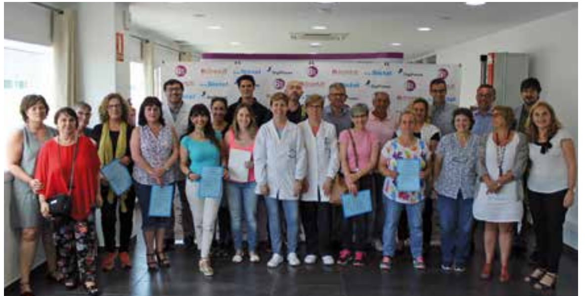
Foto de família en el lliurament dels diplomes als participants de la tercera edició de MetallVallès

Els alumnes (5 de Sabadell, 7 de Castellar i 3 de Barberà) han realitzat