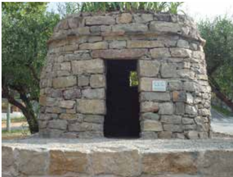
La barraca amb la inscripció CEC i l'any de construcció amb números romans.

La construcció de la barraca de vinya de pedra seca de la ronda de Llevant és un encàrrec de l'Ajuntament de Castellar del Vallès i s'inaugurarà per la Festa Major, concretament l'11 de setembre. †