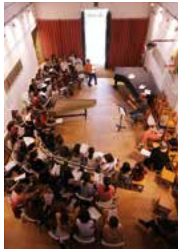
Un dels darrers assaigs del cor.

Quixot partint de peces i danses barroques, obra del prestigiós director Ton Koopman. En aquest concert que té la intenció d'apropar la música antiga al públic infantil, hi participarà també el Cor Benjamin Britten de l'IEA Oriol Martorell de Barcelona, una acríu i un ballari. El treball que les dues corals han portat a terme durant el curs amb els directors propis, ha estat intens i de gran dificultat tècnica, ja que les peces barroques tenen molts matisos que cal treballar. Aquesta darrera setmana, Ton Koopman que és considerat un dels millors directors de música barroca d'Europa, ha agafat els cors per fer els darrers assaigs abans del concert. + || REDACCIÓ