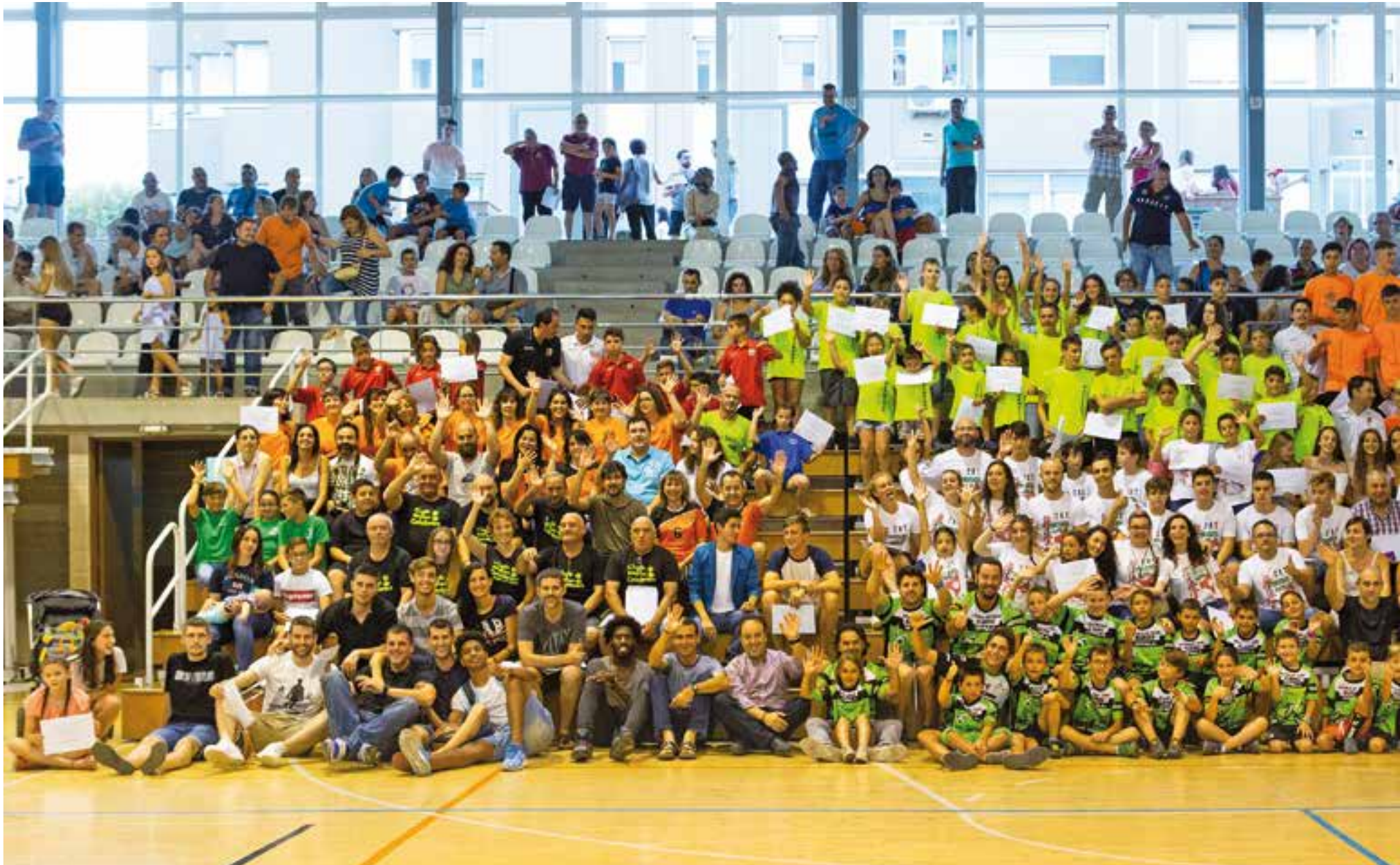
Foto de grup de tots els assistents a la Festa de l'Esport Castellarenc, després de l'acte d'entrega de premis, dijous de la setmana passada.

El consistori celebra la 6a edició anual, on va premiar els esportistes pels èxits aconseguits durant la temporada