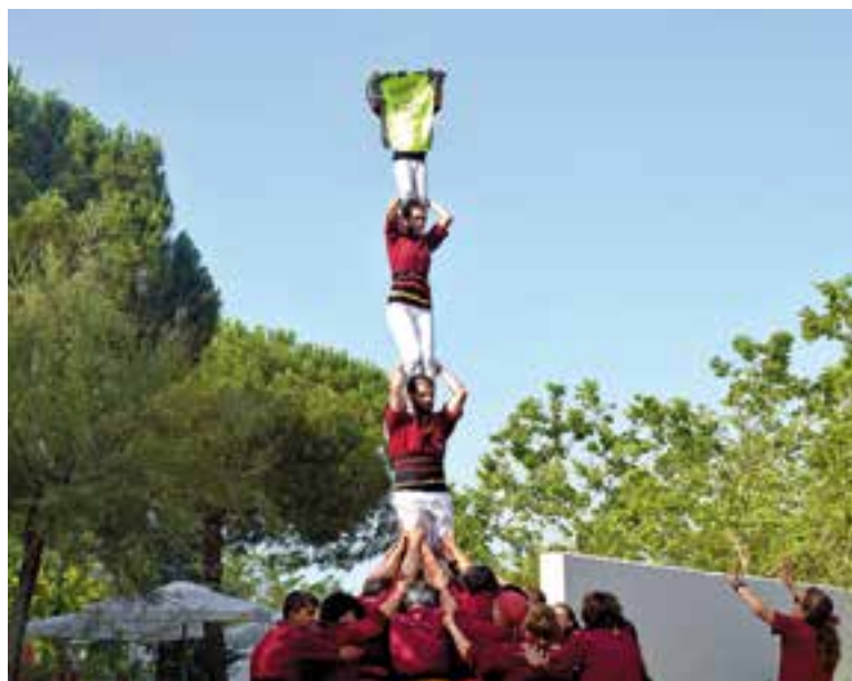
L'enxaneta dels Capgirats desplegant la llampant samarreta de la jornada solidària.

Jornada solidària dedicada a l'associació ‘Unidos por ellos’