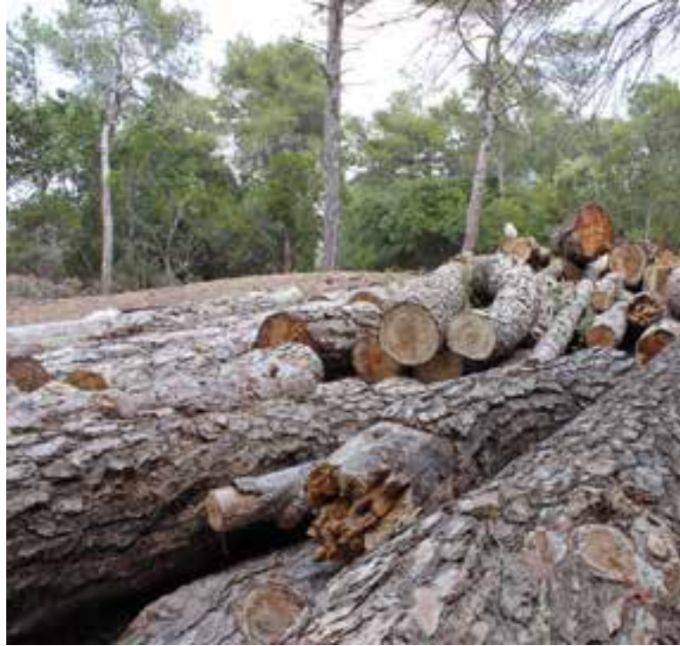
Fusta als boscos de Castellar, a la zona de Canyelles.

El nou centre operatiu de biomassa és una peça clau del projecte Boscos del Vallès. Aquest programa té per objectiu promoure l'aprofitament de la biomassa forestal i la gestió forestal sostenible, per disminuir