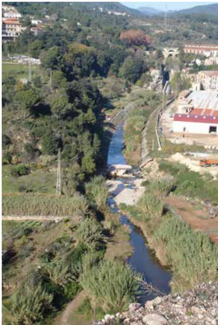
Imatge panoràmica del gorg de Can Barba

En aquest sentit, cal remarcar que s'han identificat una dotzena de miradors: a Sant Feliu, al camí de Canyelles, a l'Església, a l'Aire-Sol, al carrer de les Bassetes, al carrer de Josep Maria Valls, al Pont Vell, a la Miranda, al Boà, a Can Carner, al rieral i a Can Bages. El regidor de Planificació, Pepe González, ha apuntat que "el proper pas ha de ser senyalitzar-los i condicionar-los, de manera que siguin uns punts estra-