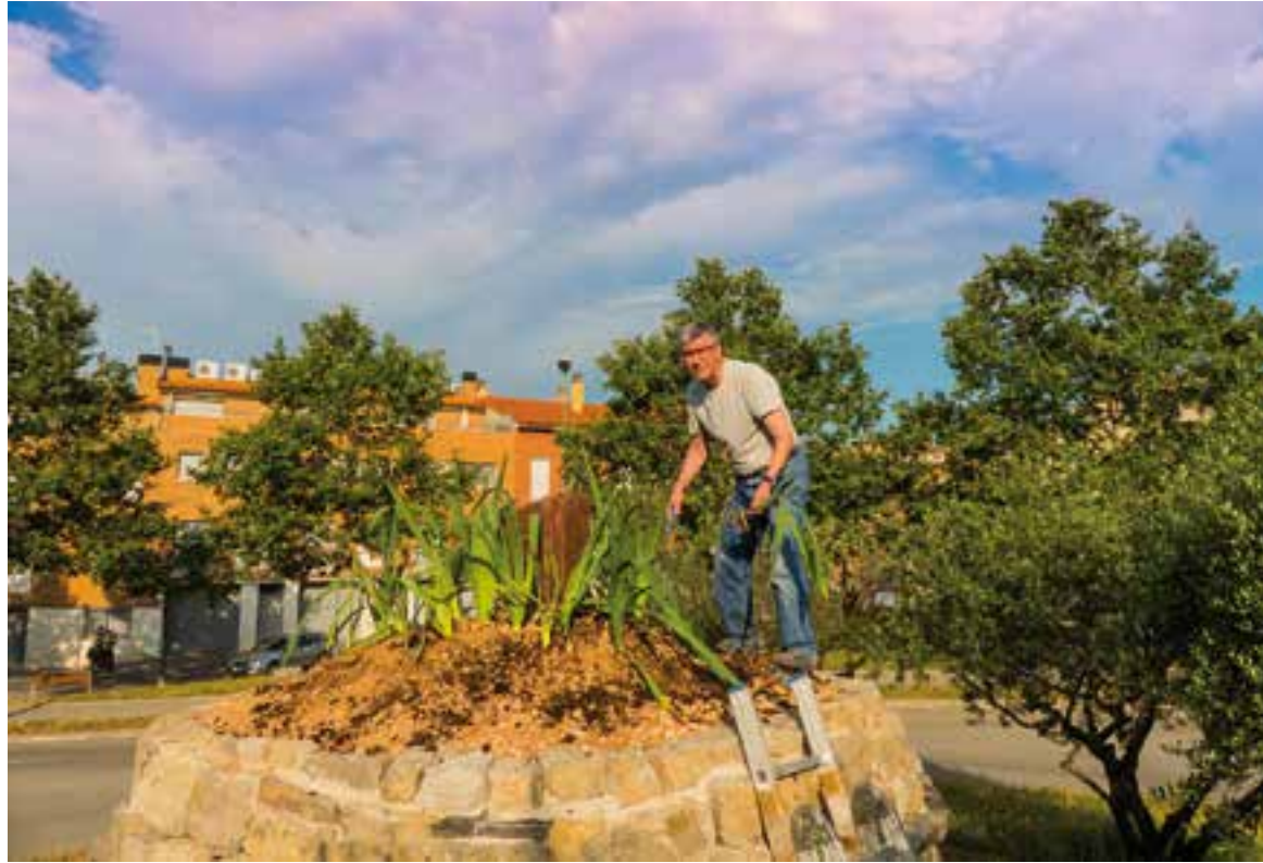
La plantada de lliris al sostre de la barraca, que dona punt i final a la construcció, es va fer dijous passat.

La barraca està envoltada de quatre oliveres i d'un espai que simbolitzarà l'inici o "quilòmetre 0" del torrent de Colobrers. A diferència de les construccions originals que es poden trobar en diferents indrets de l'entorn natural, les pedres d'aquesta barraca estan subjectades, per motius de seguretat, amb ciment. El nou conjunt ornamental es completava a prop de la rotonda, en un lateral de la ronda de Llevant, amb un relleu fet amb pedra amb forma de lletra C ideat pel castellanenc Josep Llinares simbolitzant les paraules Catalunya, Colobrers, Castellar i Clasquerí. Aquest segon espai també compta amb dos