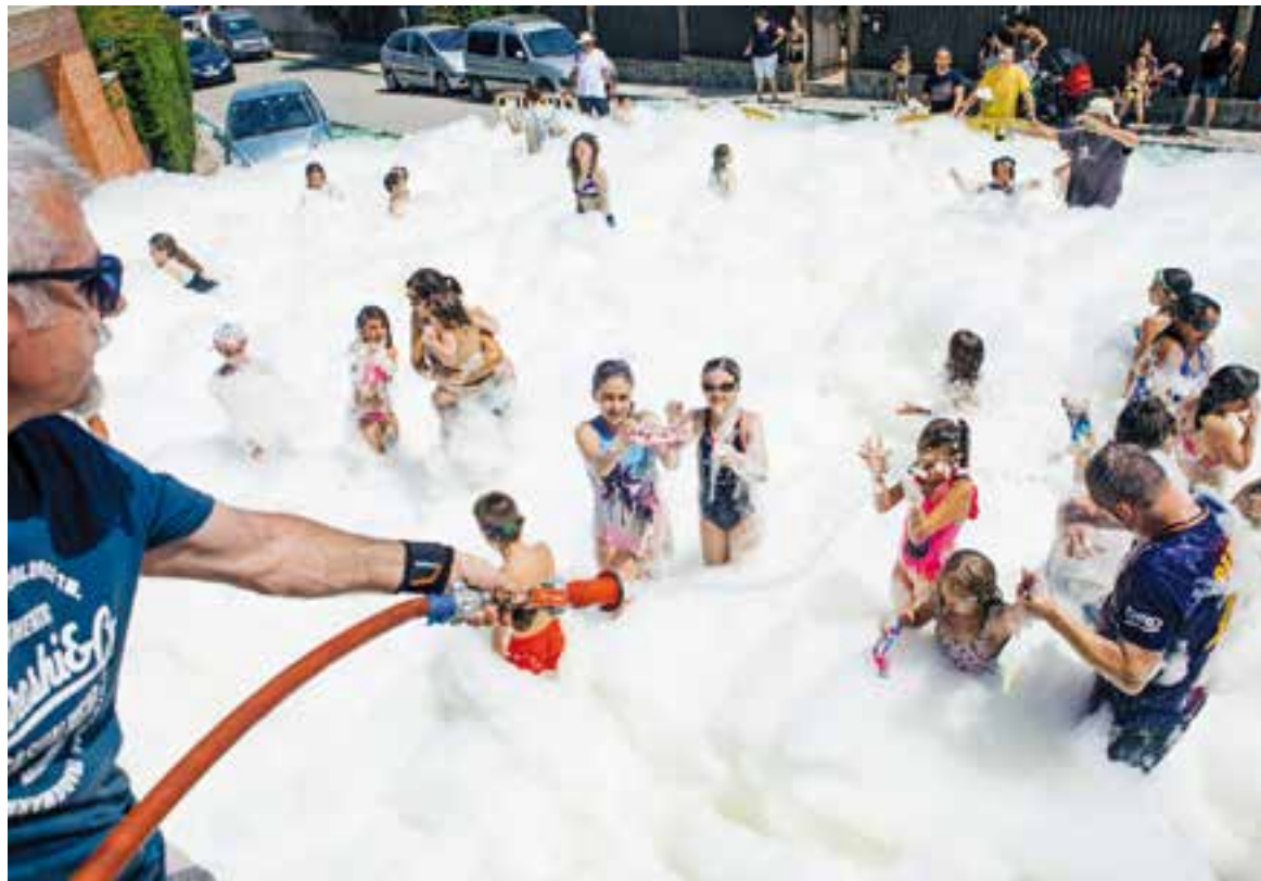
La festa de l'escuma va ser un dels reclams de la festa de Can Font per als més petits.

A la cruïlla entre el carrer Nostre Senyora Salut i el de Ca n'Avellaneda, l'escuma arriba, si fa o no fa, fins a la cintura dels pares i fins al coll d'alguns fills. Mentre sona música animada –“follow the leader, follow the leader. I wanna see ya!”– un canó reparteix flocs de sabó per als més petits de la festa, alguns equipats amb banyador i, fins i tot, ulleres d'aigua. Amb les mans alçades demanen més escuma, molts sense deixar de ballar.