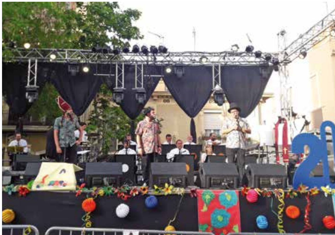
'Festa Major. un viatge a les festes "majors" d'abans' es va estrenar al maig pels 200 anys de la festa dels veïns de Gràcia.

La proposta combina teatre i música. Si bé en quantitat hi ha més música que teatre, "el teatre mai deixa d'estar sobre l'escenari, fins i tot amb les cançons". El repertori musical es basa en el disc de La Trinca "Festa Major", on s'inclouen diverses cançons que expliquen una Festa Major dels anys 70 amb el seu pregó, la processó o el