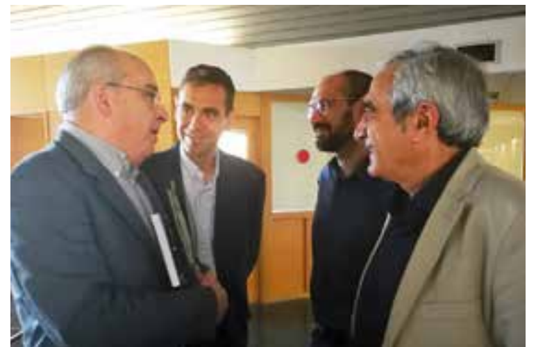
El conseller Bargalló i els alcaldes de Castellar, Sabadell i Terrassa.

Bargalló va destacar també "la voluntat dels alcaldes en la lluita contra la segregació escolar; amb el funcionament dels menjadors escolars i beques menjadors, i l'adequació de l'FP a la realitat socioeconòmica de la comarca" . + || REDACCIÓ