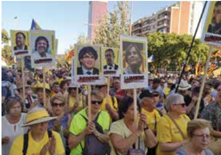
Alguns castellarencs durant la manifestació de dissabte