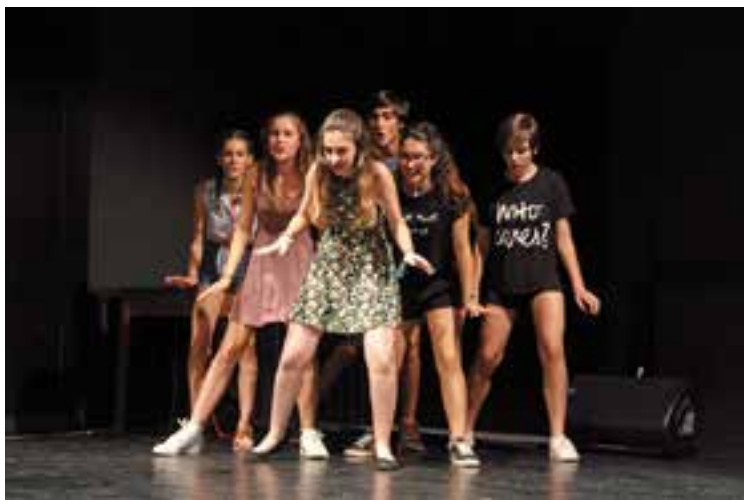
Una imatge d'arxiu de la setena edició de l'stage de teatre musical.