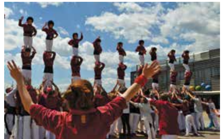
Moment del III Bateig casteller a la plaça d'El Mirador, l'any 2017.

D'altra banda, dissabte 21 els petits i joves Capgirats han programat una activitat per als nens i nenes del poble. "Serà la que hem anomenat la primera 'Festa de la canalla'", diu Cidoncha. L'activitat s'iniciarà a les 16.30 hores a l'Espai Tolrà i s'allargarà fins a les 19 hores. Hi haurà xocolatada, jocs infantils, un taller casteller, un concurs de dibuix i servei de bar per als adults. L'acte és obert a tothom. † || M. A.