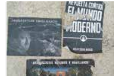
Adhesius apareguts a Cal Gorina.

Cal Gorina ha denunciat l'aparició a la porta, a la façana i a la vitrina del seu local d'adhesius neonazis que signen Hogar Social i el Último Bastión. Cal Gorina ha emès un comunicat on volen "denunciar aquest atac feixista, que malauradament no és el primer". Des del col·lectiu s'informa que s'ha iniciat "un registre amb aquest tipus d'agressions i convidem a altres col·lectius o particulars a denunciar comportaments similars". La nota finalitzada amb la constatació que "seguim treballant contra el feixisme sense por". En declaracions a Ràdio Castellar i L'ACTUAL, un portaveu de Cal Gorina ha informat que presentaran una denúncia davant de la policia. + || REDACCIÓ