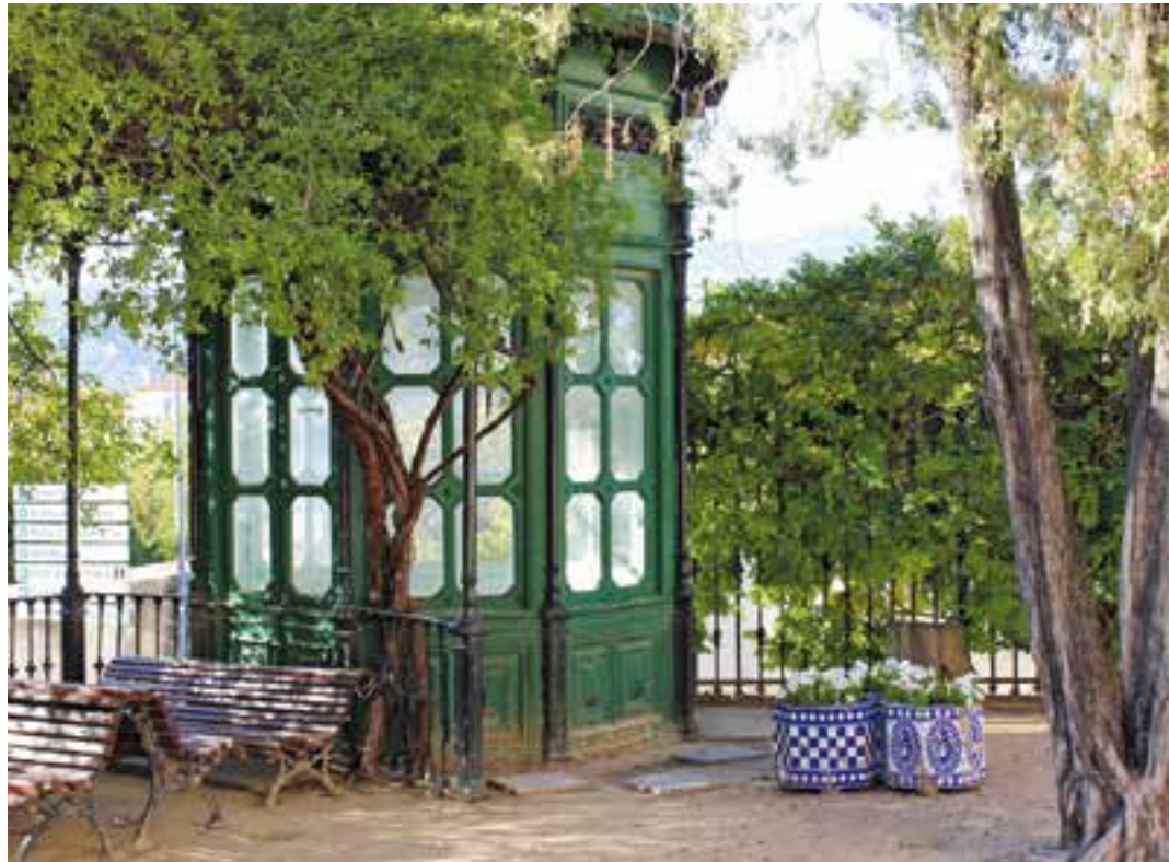
Situació actual de la glorieta octogonal que hi ha a l'extrem dels Jardins del Palau Tolrà.

Una altra actuació destacada serà la millora de l'espai enjardinat, on pràcticament no s'havia actuat des de la inauguració del Palau Tolrà com a seu de l'Ajuntament, l'any 1994. En aquest sentit, es pavimentarà el caminet interior dels jardins amb la intenció de millorar-ne l'accessibilitat, que és molt dolenta especialment en dies de pluja. També es netejarà el jardí de vegetació salvatge no originària. Així mateix, es plantaran una desena d'exemplars d'espècies que aportaran una major varietat cromàtica a l'espai. "Seran arbres