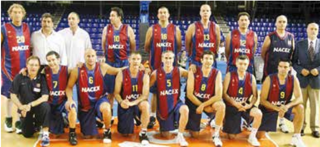
L'equip de veterans del Barça que serà present dissabte al torneig organitzat pel CB Castellar.