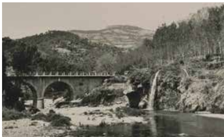
El pont del Turell de Sant Feliu del Racó a mitjans segle XX.