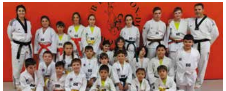
Alguns dels lluitadors que participaran al torneig de l'Amistat.