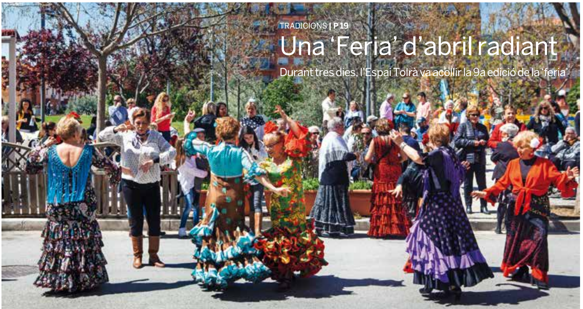
Les sevillanes van ser el ball que més protagonisme va tenir durant la Feria de Abril. El bon temps va beneficiar l'organització dels actes del diumenge.

Durant tres dies, l'Espai Tolrà va acollir la 9a edició de la 'feria'