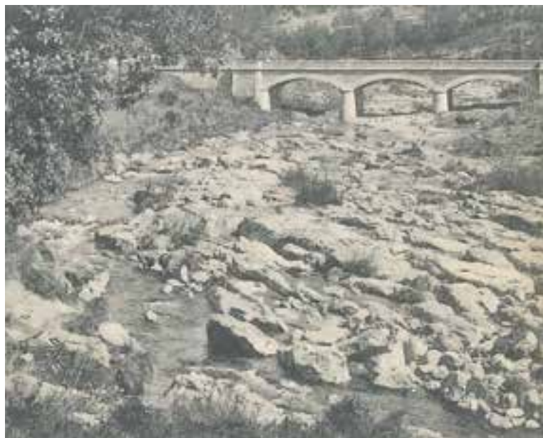
Una imatge de principis del segle XX del pont del Pinetó.