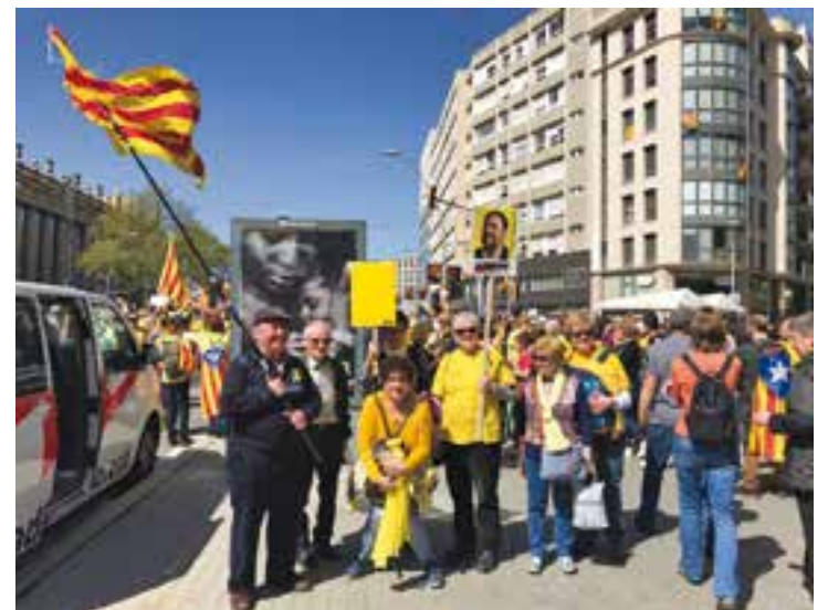
Un grup de castellarencs moments abans de la manifestació.