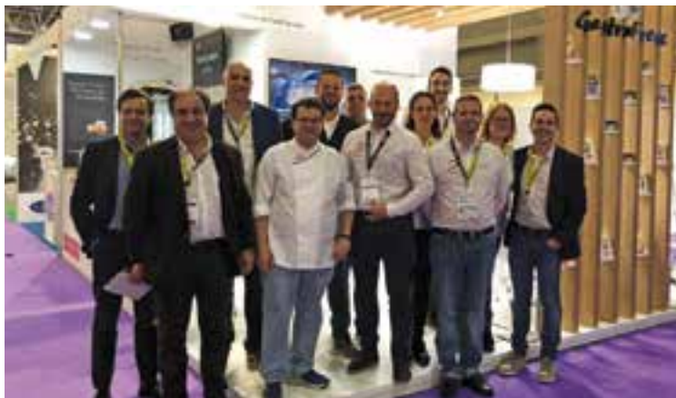
L'equip de GastroFresc davant de l'estand d'Alimentària.

Després de la ruixada final, infants de totes les edats, amb les cares maquillades de colors, van escapar-se per la vila. Un mosaic que proclamava la primavera. +