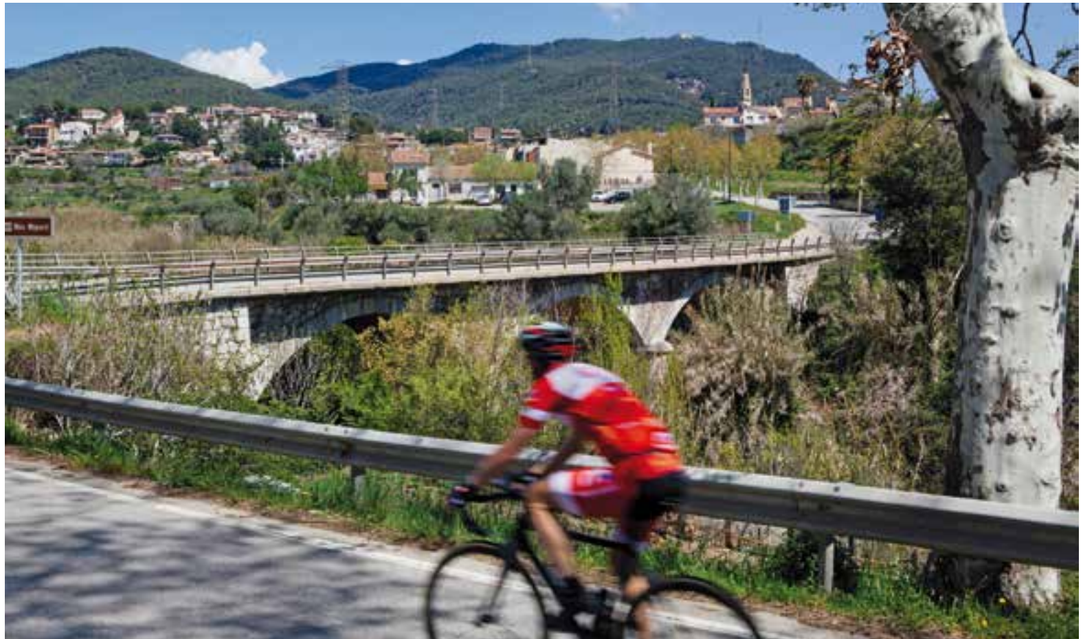
Un ciclista s'acosta al pont Nou que uneix Castellar amb Terrassa a través de la carretera C-1415a.

Justament, les riuades del 25 de setembre de 1962 van acabar amb el pont de les Arenes, el segon més antic de la vila, ja que se'l van emportar definitivament. La construcció del pont de les Arenes, es deu a la construcció de la carretera que unia Castellar amb Sant Llorenç Savall, donant continuïtat a la carretera que s'havia acabat de construir entre Castellar i Sabadell el 1865. L'accés més comú a les Arenes es feia a peu des de la caseta que havia estat construïda com a pa-