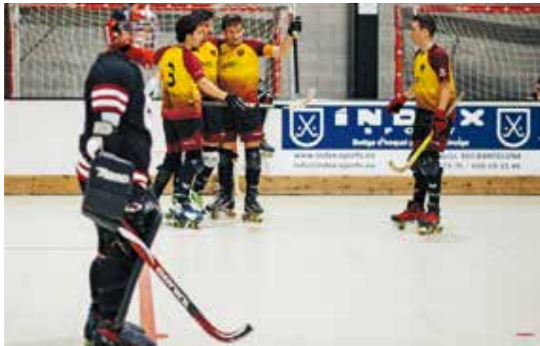
Celebració d'un gol de l'HC Castellar al Dani Pedrosa.

un camí planer pels locals i els grocs capgiraven amb solvència el lluminós del Dani Pedrosa. De nou, Vegas tornava a empatar el partit (3-3), abans que el Sant Just tornés a manar al marcador.