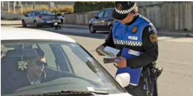
Un control policial a Castellar del Vallès.

El cos municipal també aconsella reforçar les mesures de seguretat en els accessos a les llars, especialment en habitatges unifamiliars, des de les zones enjardinades o patis exteriors. + || REDACCIÓ