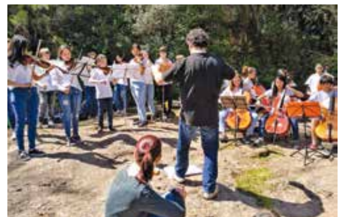
Actuació al parc natural dels alumnes de l'escola Artcàdia, any 2016. || C.

L'activitat s'iniciarà a les 11 hores i caldrà fer una inscripció prèvia al correu acciomusicalcastellar@gmail.com o a través del telèfon 937142716. El preu per persona és de 3 euros. Es farà un recorregut musical i poètic al voltant de l'ermita de Les Arenes, el veïnatge modernista de Les Arenes i el riu Ripoll de Castellar. El recorregut tindrà 7 punts de trobada. "A cada punt hi haurà una intervenció narrativa i poètica per explicar la característica paisatgística i històrica del lloc" , que se sumará a una interpretació musical. L'objectiu és donar a conèixer un espai del nostre territori d'una manera lúdica i participativa. + || M. A.