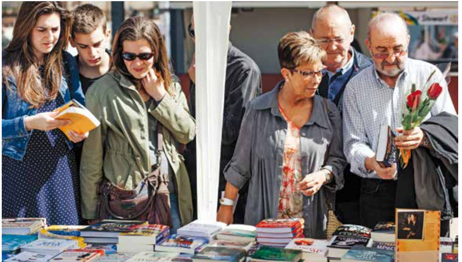
Imatge de la fira de Sant Jordi de l'any passat. El gran espai de la plaça d'El Mirador tornarà a acollir parades amb llibres. || Q. PASCUAL

Altres activitats lúdiques i culturals es concentraran principalment en horari de tarda. Així, a les 17.30 hores es podrà gaudir de la cantata El petit príncep , una proposta musical a càrrec d'alumnes d'Espaiart, amb la col·laboració dels alumnes d'extraescolar de l'escola Joan Blanquer i Jaume Viladoms, i la participació de les formacions vocals El Cor de la Nit i SOM-night. A més, l'activitat comptarà amb la narració d'Enric López i els playbacks a piano d'Abel Garriga. Una hora més tard, a les 18.30 hores, s'ha programat una ballada de sardanes organitzada per l'Ajuntament i l'Agrupació Sardanista Amics de Castellar (ASAC), que tindrà lloc a la plaça del Mercat i anirà a càrrec de la Cobla Vila d'Olesa. A les 19 hores, l'Assemblea Llibertària de Castellar sortejarà els premis de la gimcana "Dones invisibilitzades" a la paredeta d'intercanvi de llibres que muntarà a la plaça d'El Mirador. A més, durant tot el dia es podrà veure l'exposició de treballs de tapissos de l'AVAN al PIPAD de la plaça Major.