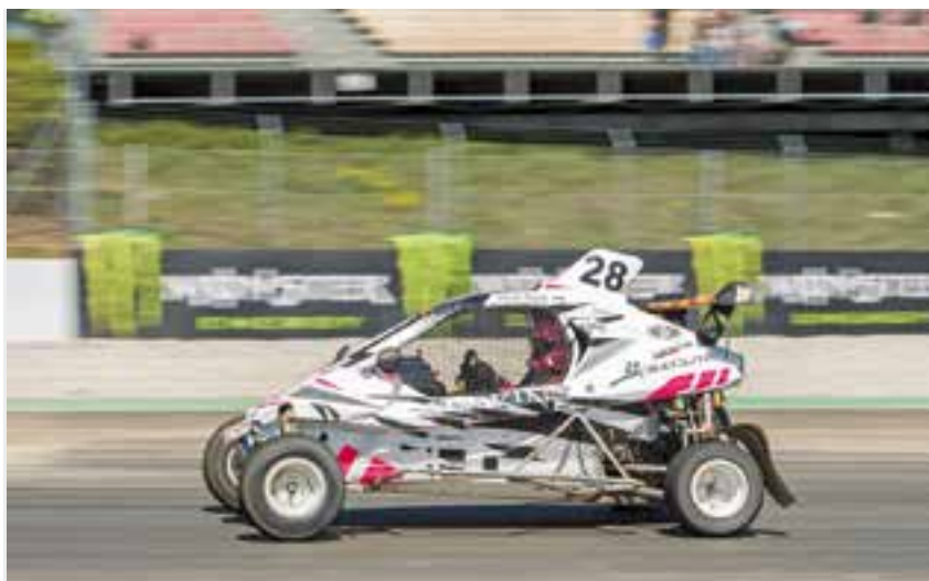
A dalt, en la zona del salt, lluitant a la final. A baix, en la zona d'asfalt.