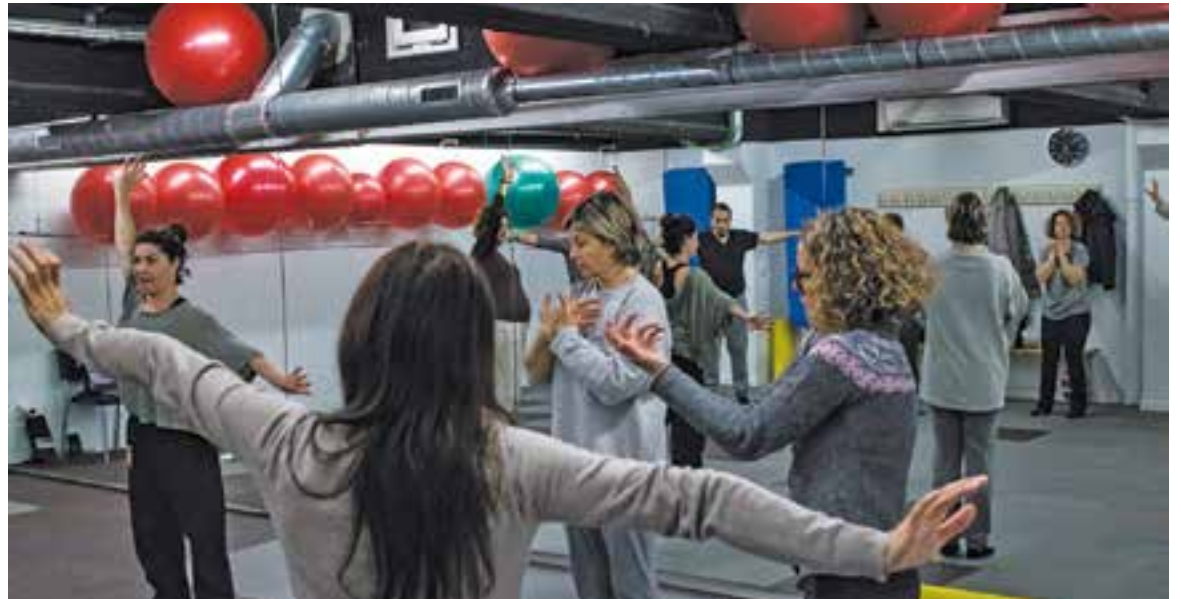
L'última sessió, celebrada divendres passat a El Mirador, es va dedicar al treball corporal.