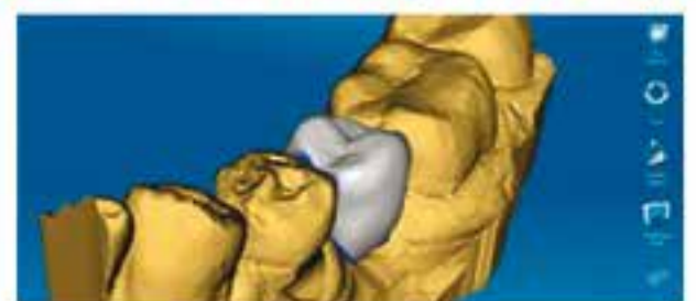
Protesis digital excel·lència en el teu somriure