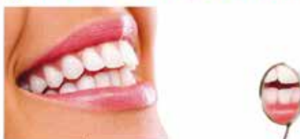
Últims avantatges en regeneració de teixits