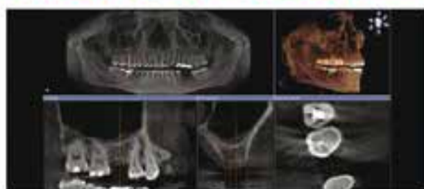
Tecnologia de diagnòstic digital per precisió en el teu tractament