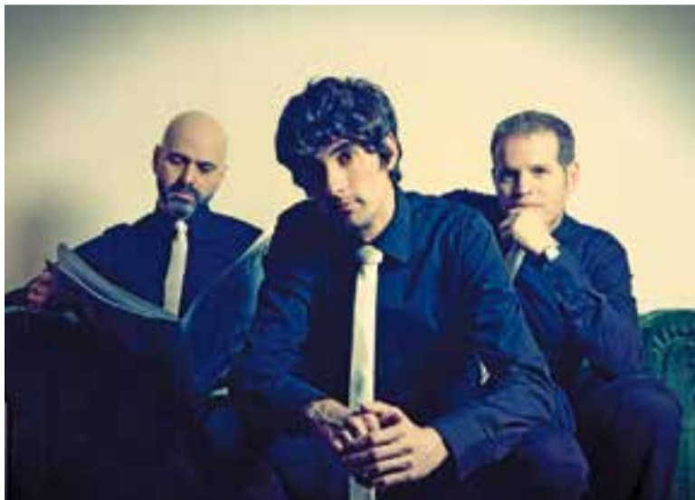
El grup Minova actua dissabte a Cal Calissó.

La formació barcelonina actua en el marc de les Nits d'Estiu