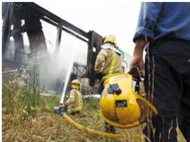
Dies després de l'incendi els Bombers encara remullaven la nau.

Encara no se saben els motius que van provocar l'incendi, divendres 7 de juliol, de l'empresa, dedicada íntegrament a la comercialització de productes d'enva-