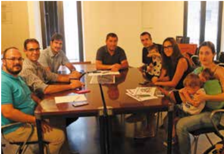
L'alcalde i regidors amb els diferents promotors dels projectes guanyadors.

Es va informar els promotors sobre l'estat d'execució dels projectes