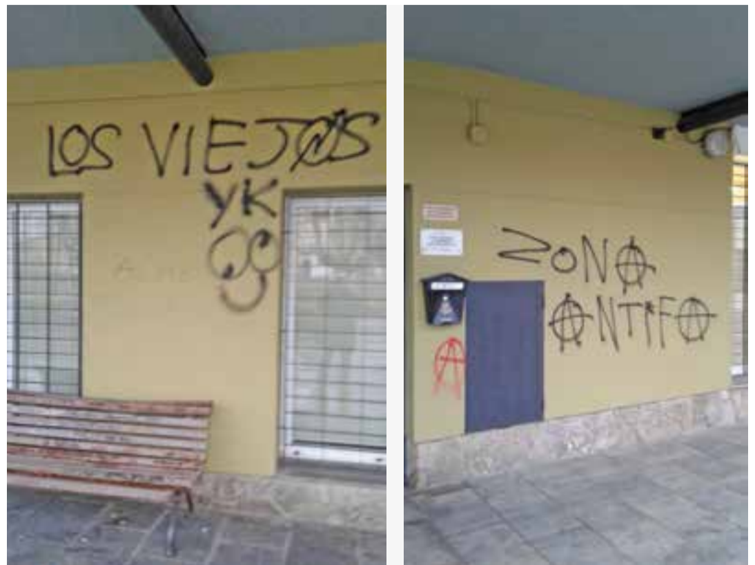
Les parets entre el Casal d'Avis i el PIPAD de la plaça Major han aparegut moltes vegades amb pintades.

D'altra banda, l'Ajuntament de Castellar del Vallès iniciarà en breu el trà-