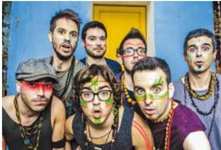
El grup Doctor Prats actuarà dilluns dins la programació de Vilabarrakes.

El programa d'enguany inclou un total de 112 activitats, organitzades en un 75,9% per entitats, que són qui s'enduen el pes de la programació de la festa. Per la seva banda, l'Ajuntament assumeix l'organització del 21,4% de les propostes, mentre que el 2,7% restant van a càrrec d'establiments privats. "El teixit associatiu de Castellar, ja sigui cultural o esportiu, aprofita els dies de Festa Major per dur a terme activitats pròpies, que donen més color a la festa, i tenen més presència ciutadana", apunta Canalís. La dotació pressupostària