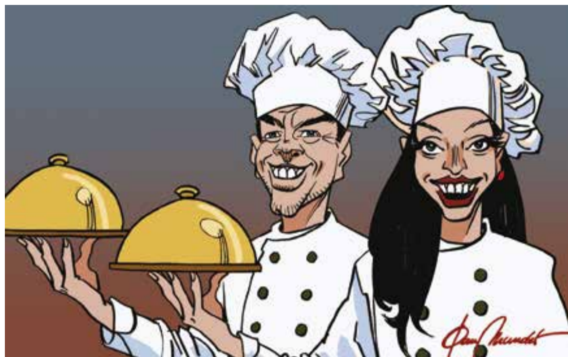
© 'Xefs i xefas'. || JOAN MUNDET

Ser xef és haver estudiat cuina o haver entrat d'ajudant en un restaurant fent feines bàsiques, i aprendre l'ofici a base