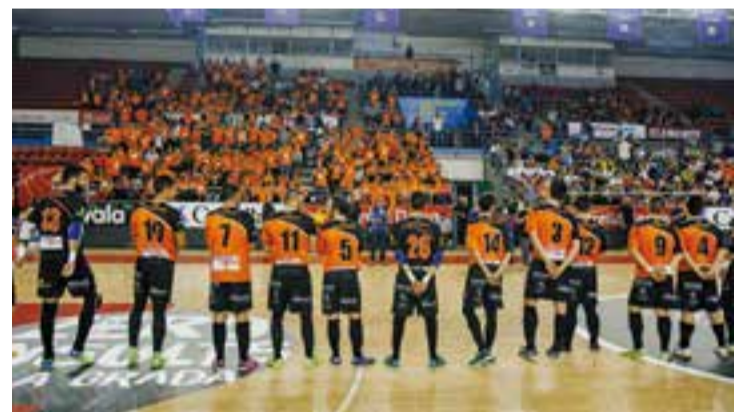
El FS Castellar a la final a 4 de la Copa Catalunya.

La qualitat de la pedrera castellarenca garanteix continuïtat en l'estil, però obre nous reptes de futur pel club presidit per Francesc Gallardo. +