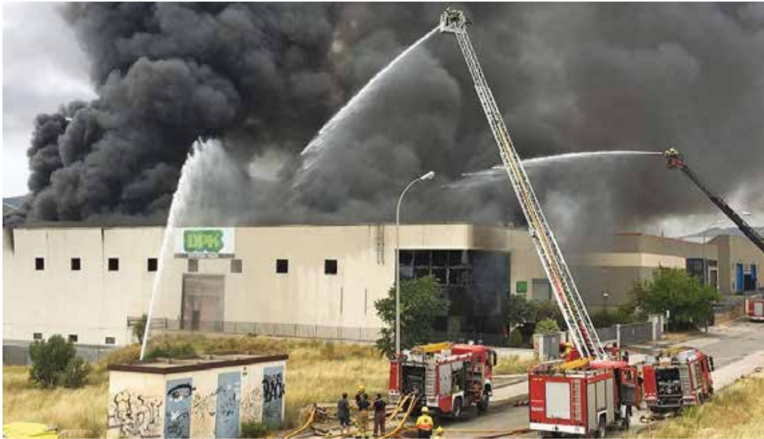
Fins a 42 efectius dels Bombers van treballar sobre el terreny. De fet, la tasca dels Bombers ha estat continua durant tota la setmana

La nau, les restes de la qual hauran de ser enderrocades, va cremar divendres passat