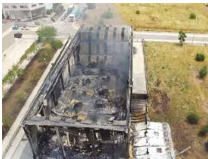
Vista aèria de la nau enregistrada per un dron dimarts al matí.

sat alimentari. Els Bombers rebien l'avís cap a les 14.19 hores i es desplaçaven al carrer Conca de Barberà, 18. A causa del material que hi havia dins, el foc es va propagar molt ràpidament i en pocs minuts grans flames consumien la nau. Això i l'àmplia columna de fum van fer que es tallés la carretera B-124 durant tres hores, es van desallotjar les naus més properes i es va recomanar confinament preventiu als veïns.