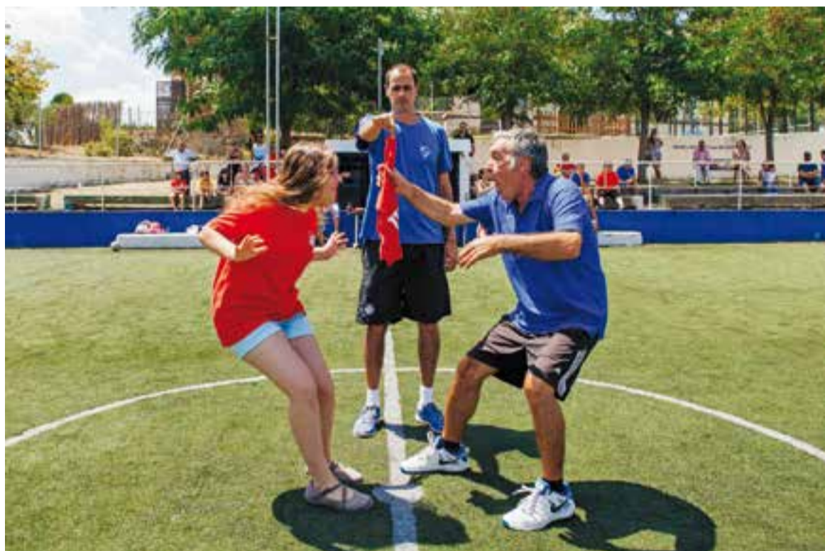
Les Olimpíades Vermells contra Blaus que es van dur a terme a la Festa Major de Can Font i Ca n'Avellaneda, l'any passat.

Dissabte 15, a les 10 hores, s'ha previst la segona triangular de futbol -categoria benjamí- amb equips del Cercle Sabadellès, el Club Natació Sabadell i Futbol Matadepera. A les