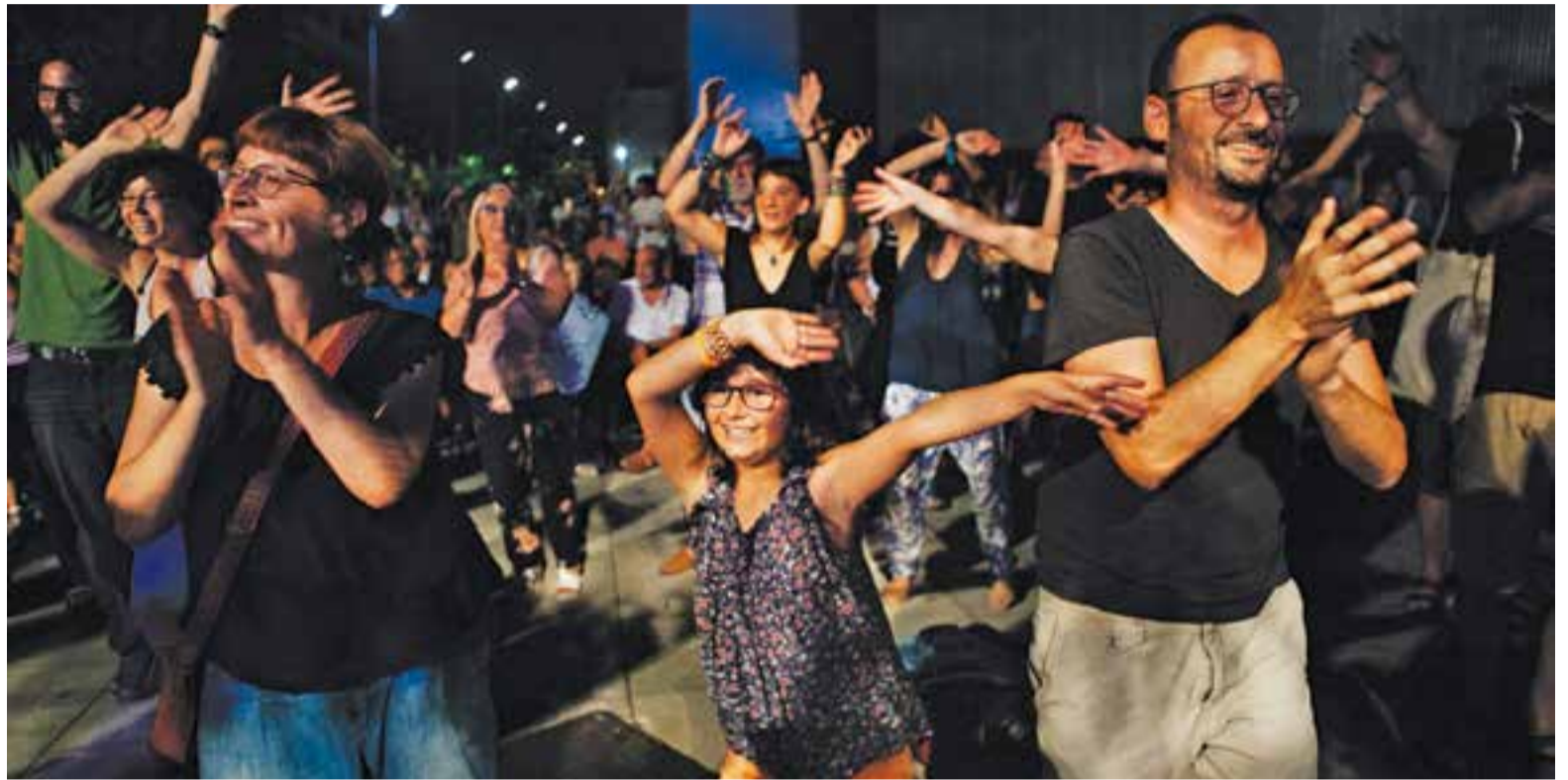
Aquest era l'ambient de festa del concert de Sabor de Gràcia a la plaça d'El Mirador.

Els gitanos catalans van fer gala del nervi encomanadís de les seves cançons i van temptar vora tres-cents cinquanta persones a connectar amb ells: “costa estar assegut escoltant rumba catalana!”. El missatge va prendre forma de ballarugues. Canalla saltironjant, parelles sincronitzades i contorsions de malucs. D'altres dansaven amb més emoció que perícia.