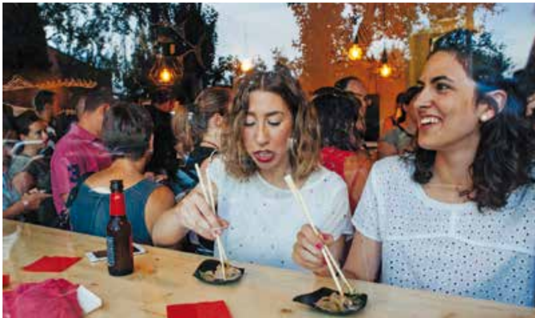
Unes participants menjant la 'Gyoza Mito' del Mito Sushi Restaurant, la més votada aquest any.

Des de l'organització del CorreTapa Castellar es vol agrair "el gran esforç de cadascun dels establiments de restauració participants, i per descomptat, l'enorme bona acollida entre els castellers i tastadors". Tot i que aquest any hi ha hagut menys establiments participants, des d'Ielou Comunicació es su-