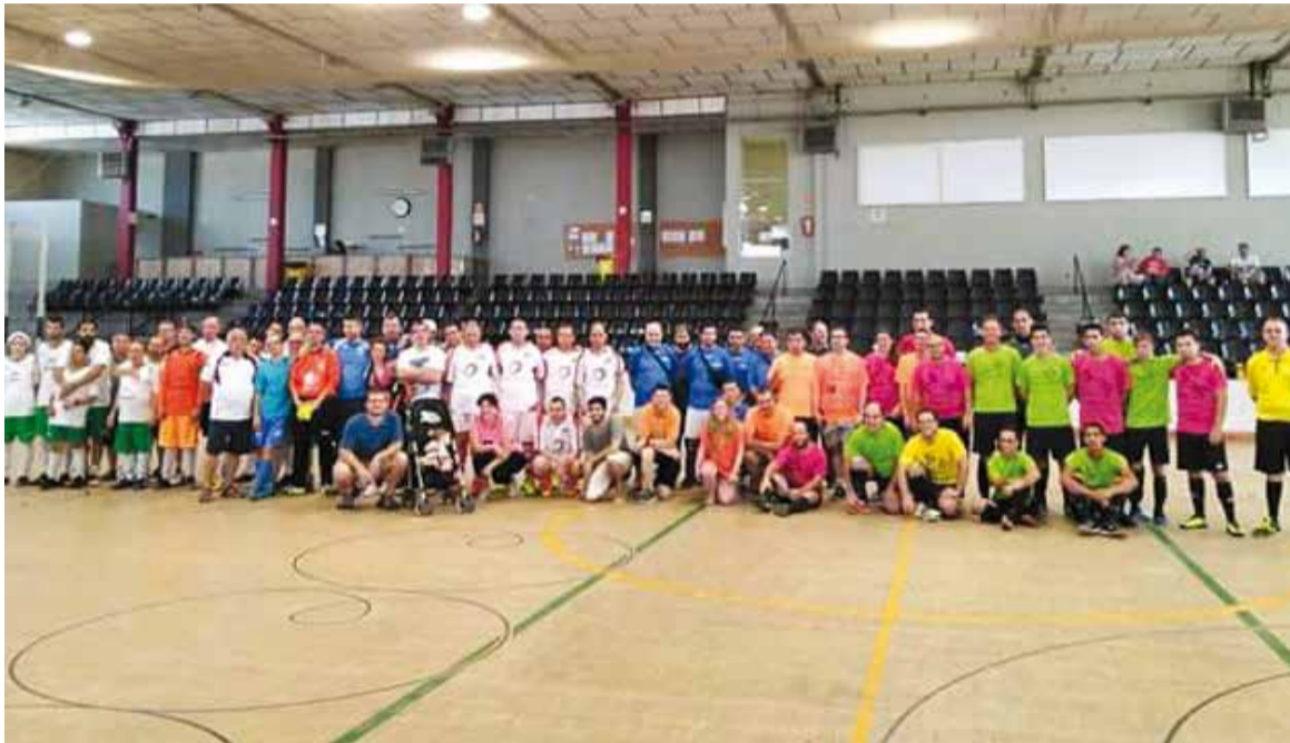
Els participants del torneig, després de finalitzar la jornada esportiva al Pavelló Joaquim Blume de Castellar.