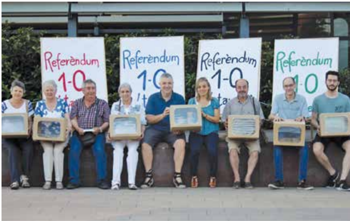
Presentació de l'acte de suport al Referèndum del 1-0 dimarts passat, a la plaça d'El Mirador.