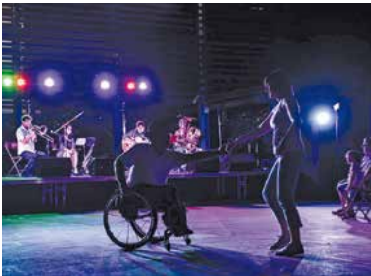
Una parella balla durant el concert d'Airmail Special Quartet.

Airmail Special Quartet i Kansas City Swing Quintet van oferir dues actuacions a la plaça del Mirador, divendres passat