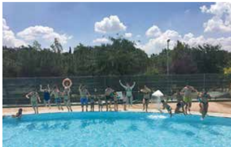
El salt solidari durant la jornada de 'Mulla't per l'esclerosi múltiple'.

Aquest requeriment s'ha fet arran d'una petició en aquest mateix sentit de la formació política Castellar en Comú, que va criticar que els no socis de Sige no poguessin accedir als vestidors de l'equipament. Els comuns han volgut valorar el requeriment amb una nota de