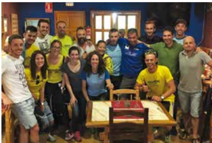
Membres dels dos clubs de triatló de Castellar a Les Angles.

És difícil fer-ho amb un descens a la segona temporada. El primer any ens vam divertir molt, però el segon no es pot valorar. Deixo molts amics a Castellar i sumo una experiència més. +