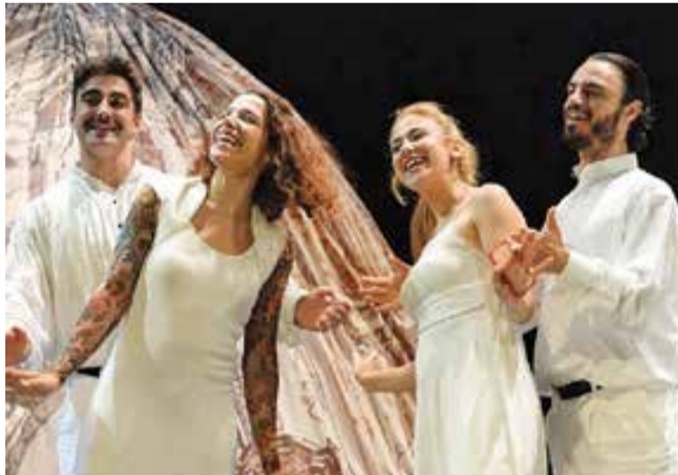
Moment de 'La trilogia MozArt' de la companyia Dei Furbi.

El muntatge utilitza un llenguatge escènic poètic, líric i visual, pinzellat amb bones dosis d'humor i amb uns personatges que s'agiten entre els extrems de la tragèdia i la comèdia. "La nostra proposta és