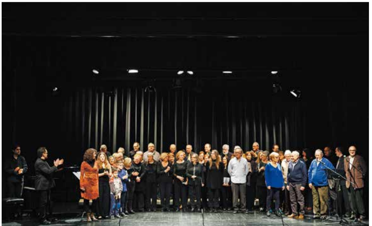
Foto de família, al final de l'acte, de tots els participants en aquest homenatge.

L'acte "ha anat bé, ha tingut el seu interès per la gent del poble" , assegurava Sellent. "S'ha descobert que aquest home té una obra molt variada i molt abundant" i així s'ha pogut donar "el perfil general del personatge" , confirmava Sellent. Un esdeveniment que tanca d'una manera més completa la celebració del centenari de la primera representació dels pastorets castellarencs de Mossèn Joan Abarcat. ➔