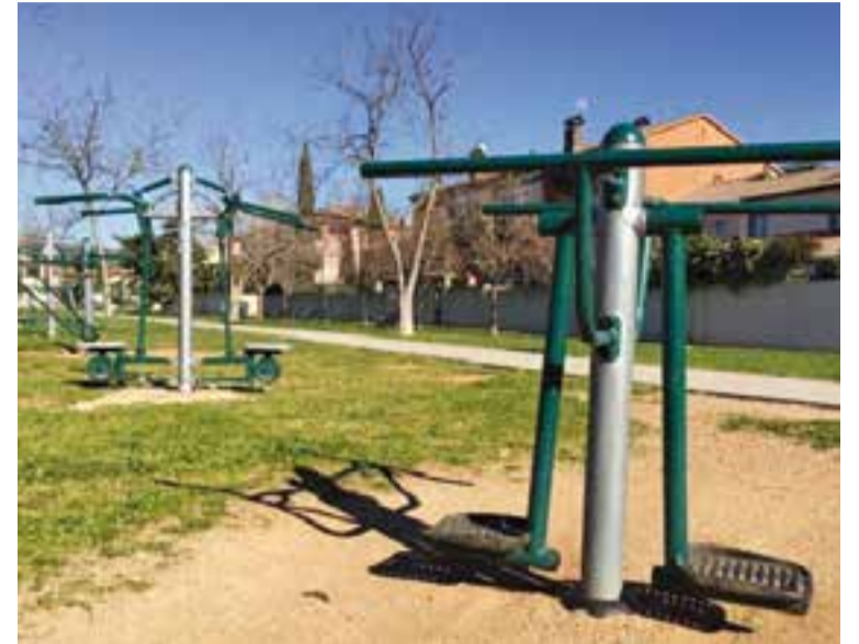
Circuit biosaludable a Castellar.