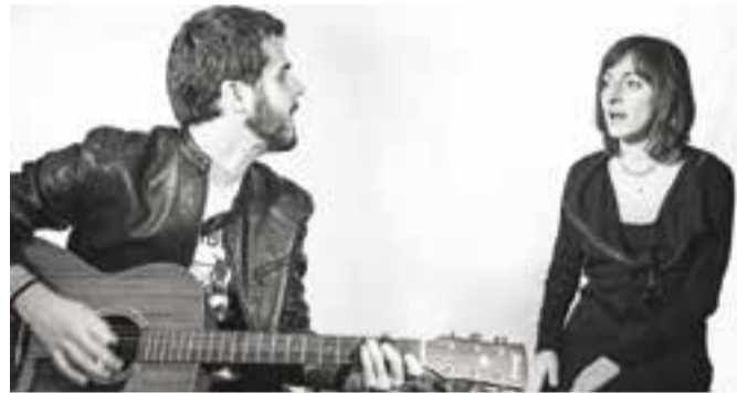
Els White Ellipse actuen dissabte a Cal Calissó.

Això l'ha portat a treballar el rostre per ajudar a expressar millor aquests diferents estats anímics. L'exposició inclou, a més dels quadres amb el negre de la tinta, dues obres amb color; fetes amb llapis aquarellable. ✦ || M.A.