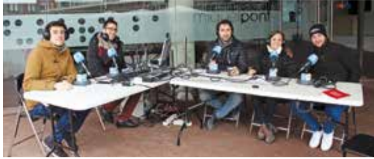
L'equip del magazín Dotze amb col·laboradors, dilluns passat al Mercat.

RÀDIO CASTELLAR | DIA MUNDIAL DE LA RÀDIO