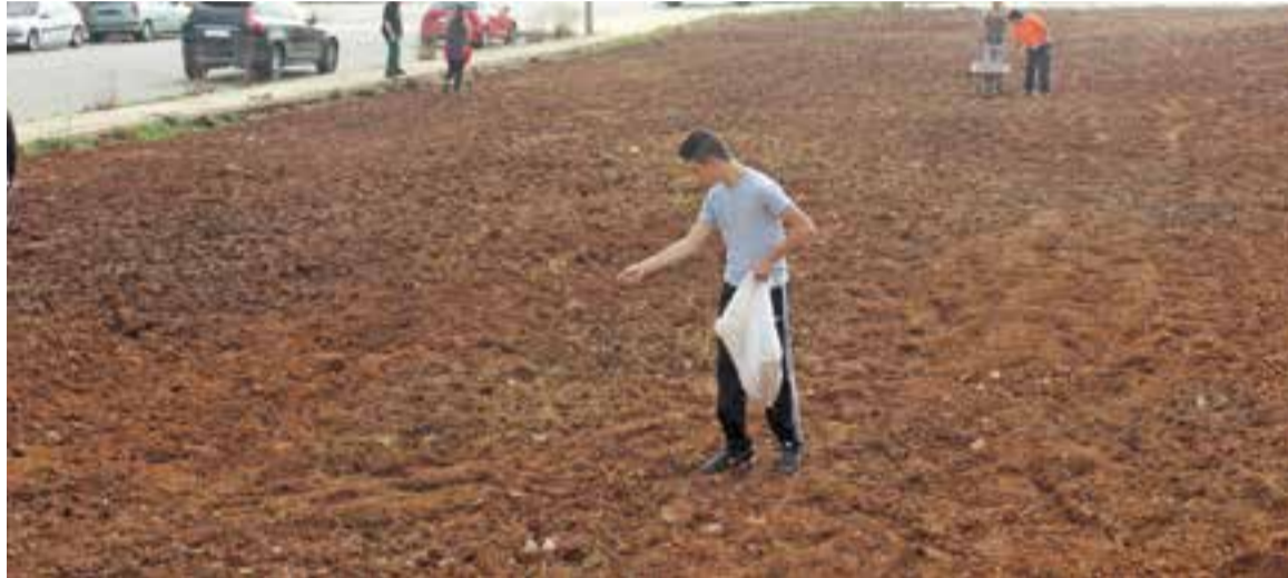
Un alumne del cicle formatiu de grau mitjà de la família professional agrària sembrant un camp.

Aquests estudis capaciten per desenvolupar projectes de jardins i zones verdes i gestionar la producció de plantes i la producció agrícola, mitjançant la supervisió de les tasques, la programació i l'organització dels recursos materials i humans disponibles aplicant criteris de rendibilitat econòmica i complint amb la normativa ambiental, de producció ecològica, producció en viver, control de qualitat, seguretat alimentària i prevenció de riscos laborals.