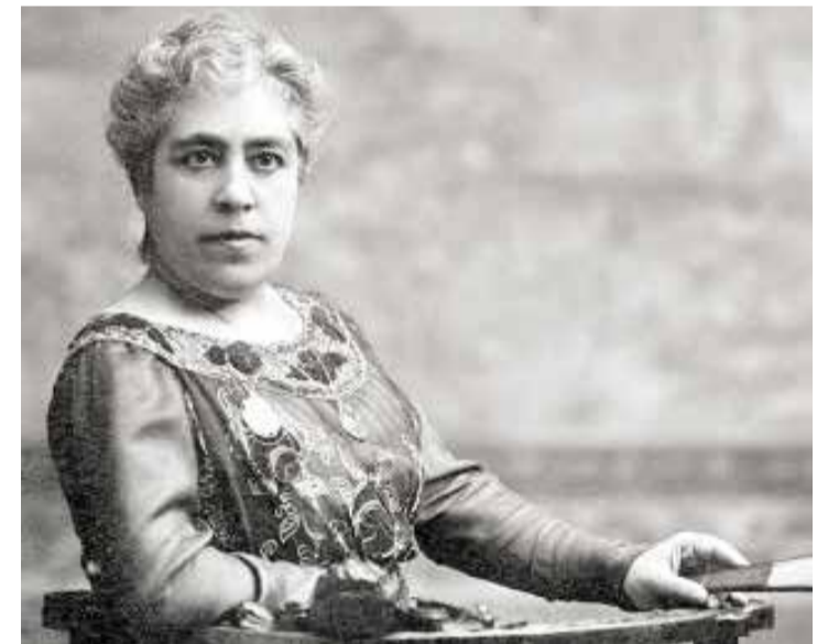
Caterina Albert (Víctor Català).

Els textos que es podran escoltar són dos monòlegs: "La infanticida" i "La tieta", dos exemples del món literari i filosòfic d'una escriptora que sempre es va avançar al seu temps i que encara avui segueix sent un referent per seguir avançant. + || M.A.