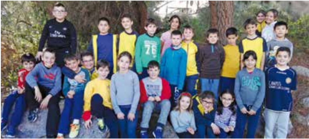
Alumnes de 4t de primària que van participar en el concurs de dibuix.

S'ha fet un concurs de dibuix a l'Escola Bonavista per triar imatge