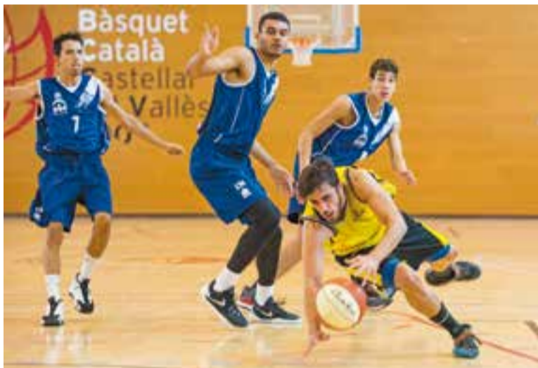
El CB Castellar torna a caure en lliga. || A.SAN ANDRÉS

Amb un balanç de 2-14, el CB Castellar rebrà aquest diumenge al seu màxim rival per evitar el descens directe, el CB Viladecans (1-15), equip que ja va guanyar als de Company a la primera volta, sumant l'única victòria des de principi de temporada, pel que l'equip necessitarà tot el suport de l'afició aquest diumenge a les 19:00 h al Pavelló Puigverd. + || A.SAN ANDRÉS