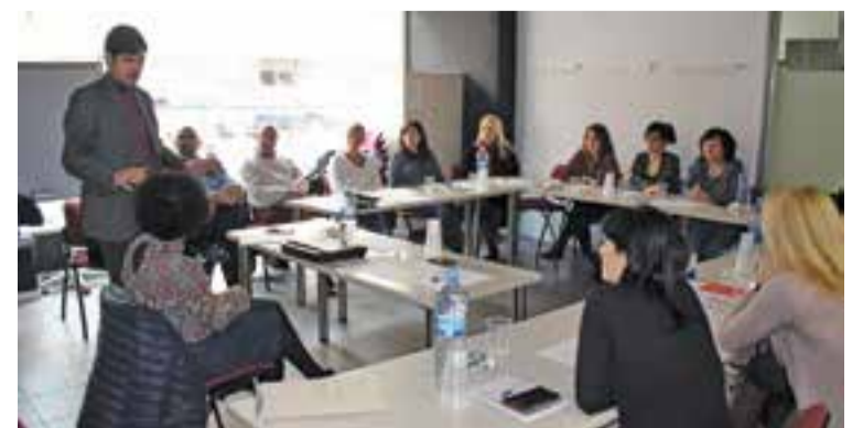
El primer tinent d'alcalde va assistir a la cloenda del curs divendres passat. || CEDIDA

Una vintena de professionals dels àmbits de la sanitat, els serveis socials i els cossos de seguretat han participat aquest mes de febrer d'una formació de prevenció i seguiment de situacions de violència envers les dones. Els participants integren en la seva majoria la comissió que es va encarregar de la redacció del nou protocol, aprovat pel Ple municipal el febrer de l'any passat, per a l'abordatge integral d'aquest tipus de violència. + || REDACCIÓ