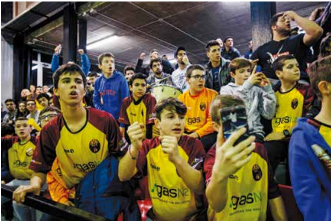
L'emoció va presidir el derbi entre el Castellar i el Sentmenat a unes grades que es van omplir de gom a gom.

L'inici no decebia a ningú i el primer atac era pels de Truyols, que tot