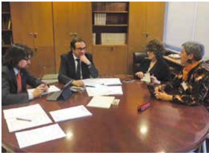
Les dues regidores del PDeCAT de Castellar reunides amb el conseller Rull.

A la trobada entre les regidores castellarenques i els responsables del Departament de Territori i Sostenibilitat, també es va tractar la seguretat de la B-124 en di-