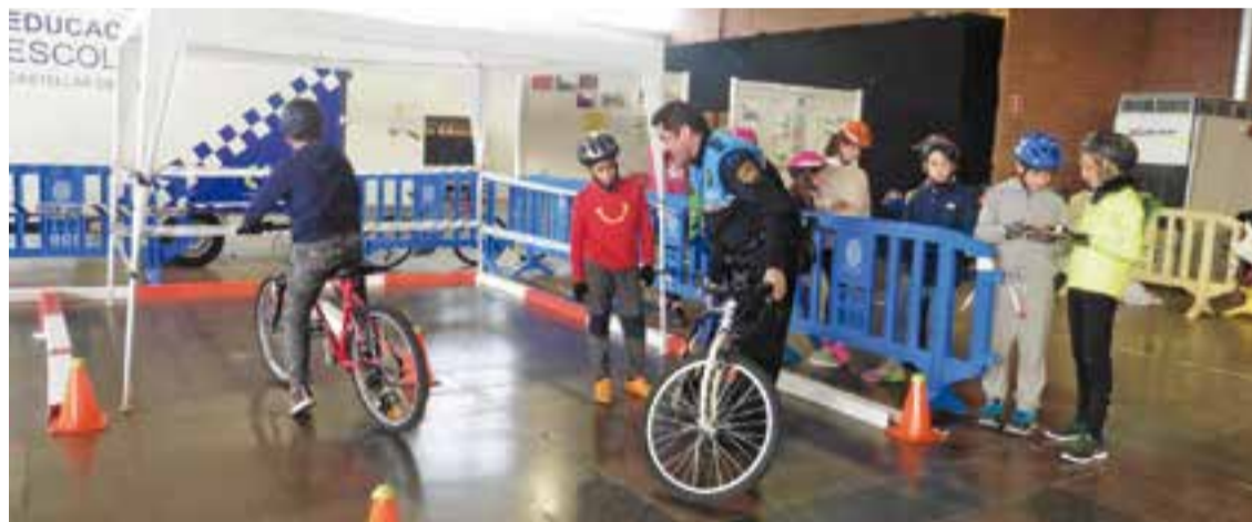
Alumnes de l'escola Sant Esteve atenent les explicacions d'un policia.