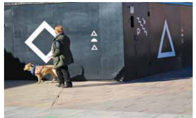
Nova senyalització.

Des de la seva creació, la marca "Fem Castellar" també s'utilitza per comunicar la programació cultural de l'Auditori en els diferents suports gràfics, com ara el programa de mà, els cartells, les estructures verticals o el gadget de regal. En aquest cas, a més, cadascun dels símbols fa referència a una temàtica, per exemple, la rodona correspon al cinema, el triangle al teatre i la ies a la música. + || REDACCIÓ