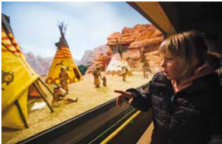
Visitants als 'Pessebres del Món' del Grup Pessebrista de Castellar.

Sobre les opinions que els pessebristes han rebut per part dels visitants, "la millor opinió és, sense dubte, la gran quantitat de gent que ha vingut" , afirma Batiste-Alentorn. També han comentat que "són uns pessebres molt diferents als que havien vist a altres llocs" . Precisament, aquest fet diferencial en el tema que cada any tria el Grup