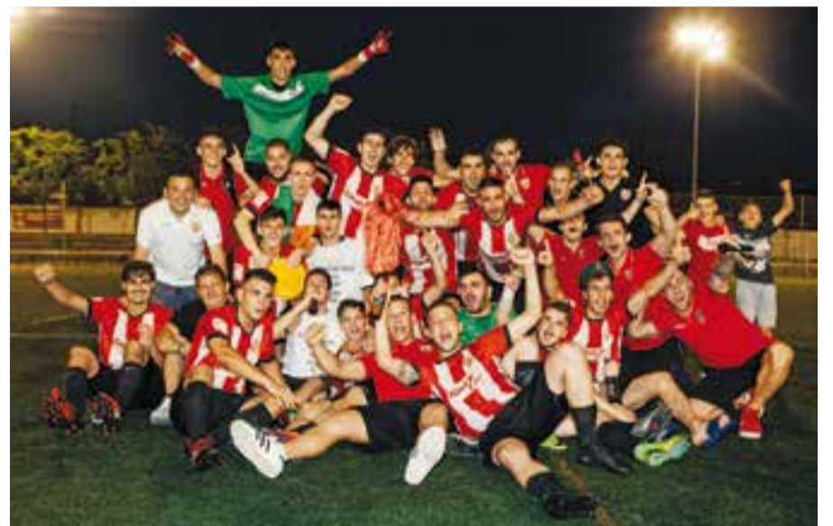
La UE Castellar celebrant la victòria al Pepín Valls després d'aconseguir l'ascens.