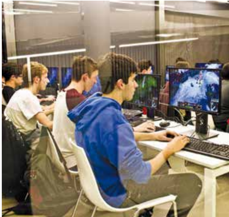
Campionat de League of Legends a les aules d'informàtica d'El Mirador.