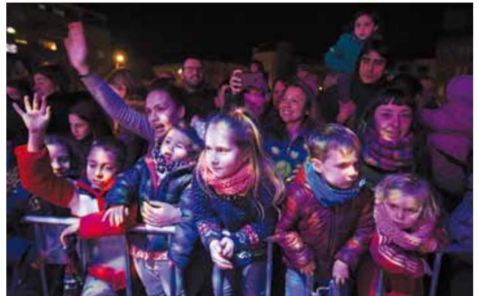
Els nens i nenes de Castellà esperaven, impacients, l'arribada dels Reis Mags de l'Orient per saludar-los i donar-los la mà, al costat de l'escenari de la plaça d'El Mirador, després que els Reis fessin ofrena al pessebre Vivent, situat al costat mateix. || Q. PASCUAL