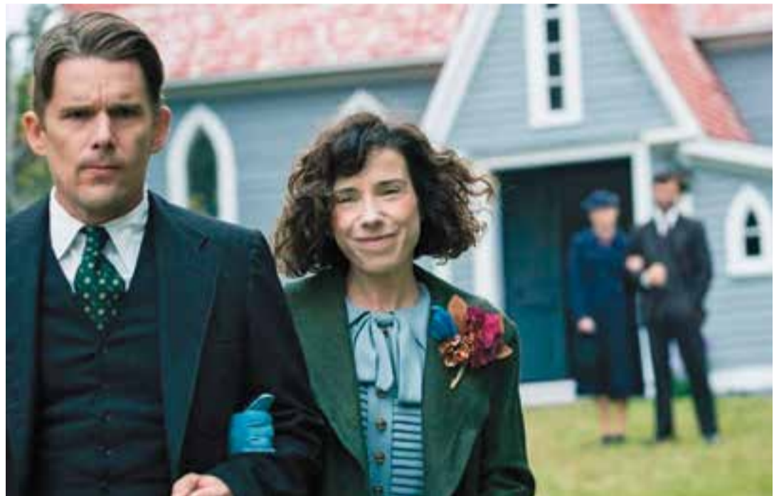
Un fotograma de la pel·lícula 'Maudie, el color de la vida', que es podrà veure el 16 de març, a l'Auditori Municipal.

El cineclub també participa, un cop al mes, en la programació de cinema de l'Ajuntament. El autor , és la cinta espanyola protagonitzada per Javier Gutiérrez i que opta a 9 premis Goya que es podrà veure el del 21 de gener. +