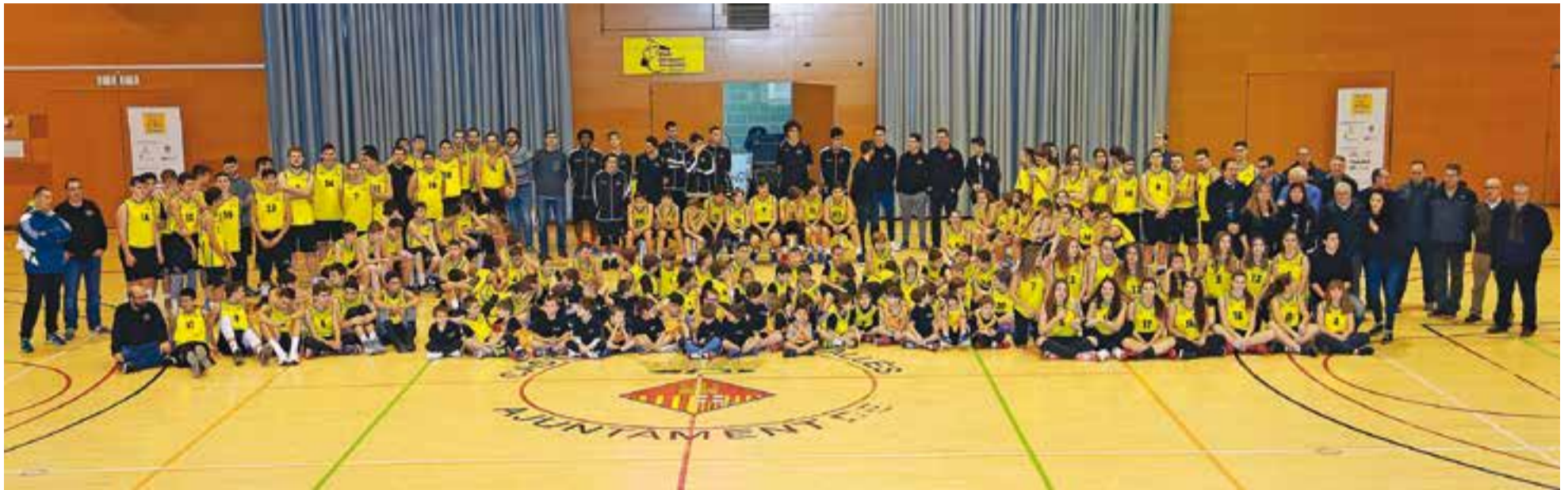
Foto de família de totes les categories i esportistes del CB Castellar.

El Club Bàsquet Castellar clou els actes del 60 aniversari amb bona salut esportiva i ensenya múscul amb la presentació dels 18 equips del club, disputant el 40è Memorial Parcerisa i el 44è Vila de Castellar