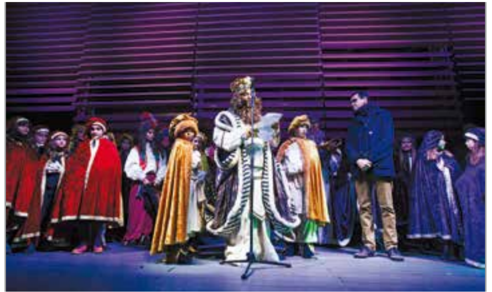
El Rei Gaspar va adreçar-se als infants de Castellà en nom dels Tres Reis Mags de l'Orient des de l'escenari de la plaça d'El Mirador. Acompanyat en tot moment dels patges reials i de les autoritats locals, tothom va parar atenció a les seves indicacions.