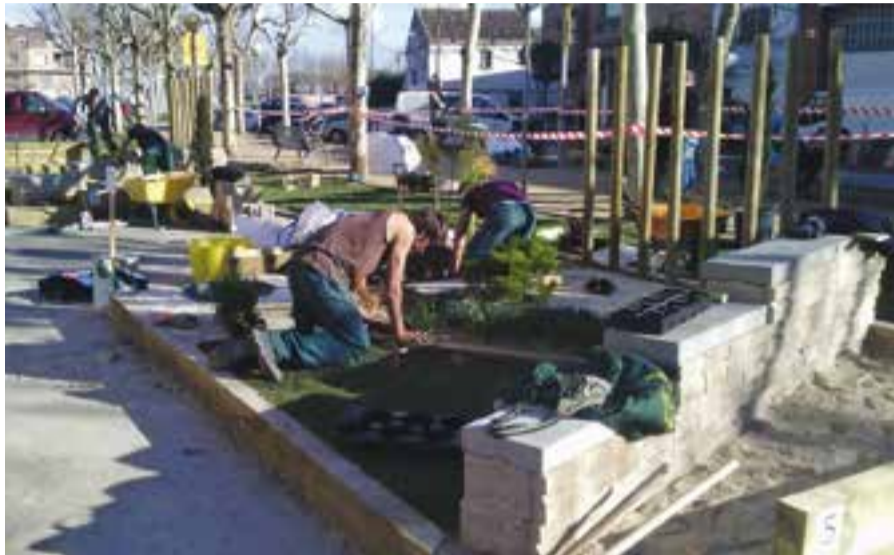
Els alumnes de l'INS Castellar en el Catskills de Mollerussa el 2016 on van quedar tercers.

Les proves d'habilitat consisteixen a omplir o enjardinar un espai amb un mínim de 15 m 2 i un màxim de 25 m 2 en base a un disseny sobre plànol. L'organització a més del plànol dota als alumnes dels materials i eines necessàries i aquests, han de construir el jardí en dos dies. Finalment es valora la rapidesa i rigorositat en el treball comprovant mesures, nivells i cotes respecte el plànol original. Els participants es poden inscriure al web catskills.gencat.cat fins al 15 de gener.