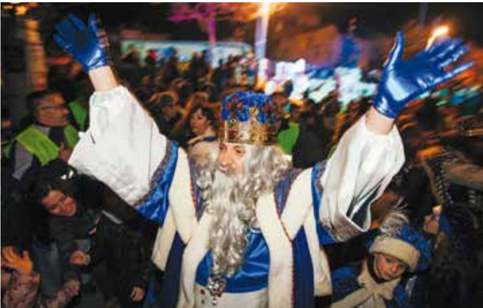
El Rei Melchior va baixar de la carrossa finalitzada la rua, al costat dels altres dos Reis de l'Orient, per saludar i abraçar els infants castellarencs, moments abans que la seva màgia s'escampés per totes les cases.