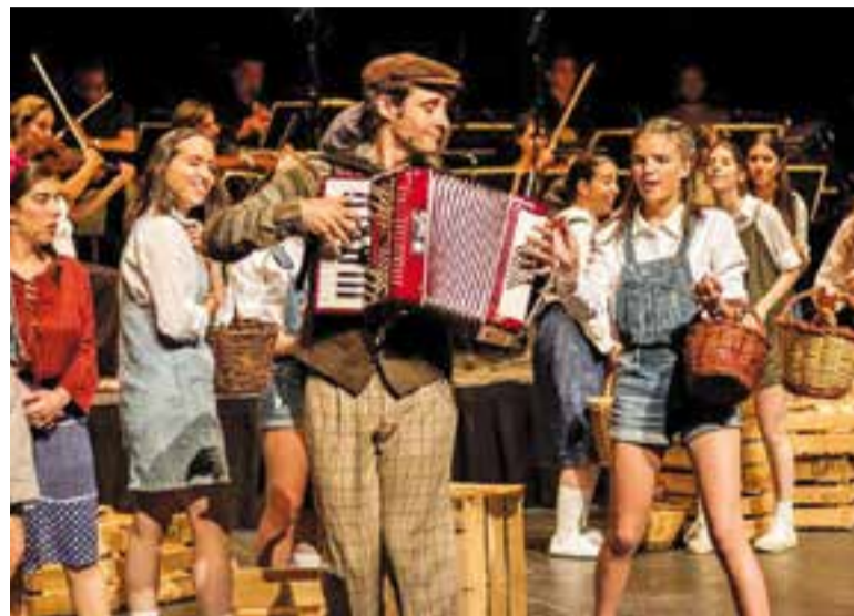
Moment de l'òpera infantil 'Brundibár' al Teatre Lliure, dimarts passat.