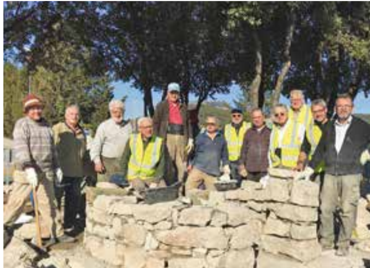
El Grup de Recerca de la Pedra Seca, treballant a Matadepera. || M. ANTÚNEZ

En aquest sentit, el Grup de Recerca de la Pedra Seca no només s'ocuparà de la construcció de la