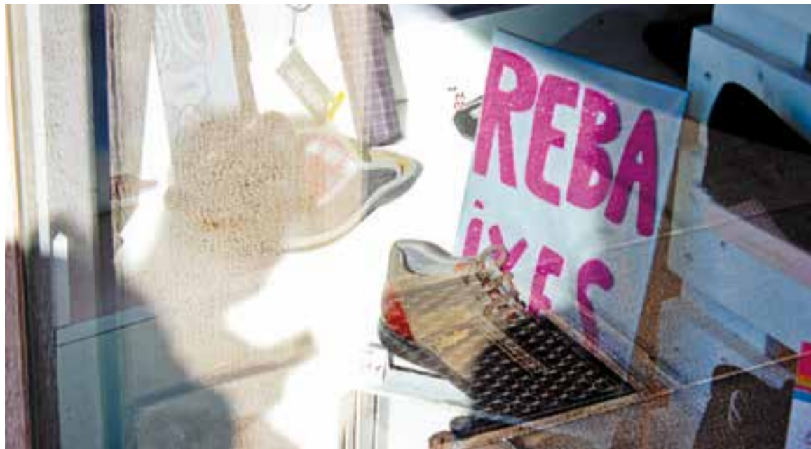
Una imatge d'un aparador de la sabateria Elena Calçats del carrer Passeig amb productes rebaixats.

La Cambra de Comerç de Sabadell ha apuntat que les vendes podrien augmentar un 3% durant aquesta campanya, un percentatge similar al que es va produir a la campanya nadalenca. Una sensació semblant té el president de Comerç Castellar, Toni Santos, que considera que els comerciants poden fer una bona campanya de rebaixes animats pel fet que "fins ara ha fet calor, amb l'arribada dels primers freds la gent s'animarà a comprar i això es veurà potenciat pel gran estoc de roba que tenen els establiments". I això, sobretot després de l'excel·lent campanya nadalenca que ha tingut el comerç local. "Ja