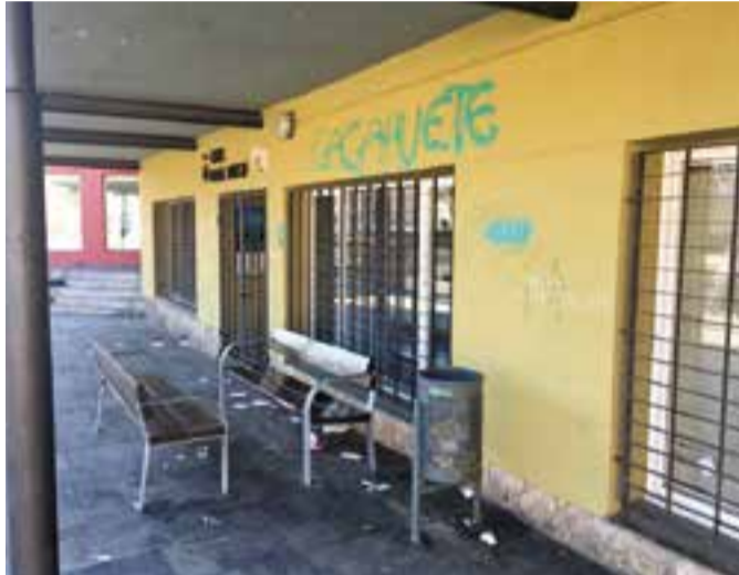
Una de les bretolades, el cap de setmana passat, a la plaça Major.

La suma total de la despesa dedicada a la neteja de pintades arriba pràcticament als 27.000 euros. Els 3.500 euros restants corresponen a altres tipus de desperfec-