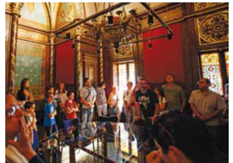
Imatge d'una de les rutes del passat any.

Per participar de les rutes, s'ha de fer una inscripció a caminantambhistoria@gmail.com o al telèfon 651 846 563. Les visites es fan en grups reduïts i tancats, d'unes quinze persones. El preu és de 10 euros, 8 per als socis Arxiu d'Història de Castellar. La propera ruta amb plaques disponibles és la del 15 d'abril i serà de nou, sobre la Guerra Civil a Castellar del Vallès. ✦ || CRISTINA DOMENE