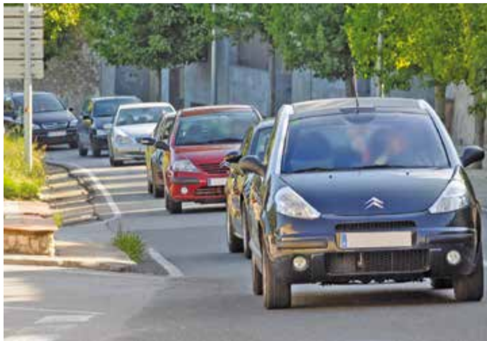
Retenció de vehicles a la intersecció de la B-124 amb la C-1415a.

Una de les solucions que es proposa analitzar en aquest estudi és la creació d'una rotonda a la intersecció de la carretera de Sabadell amb el Passeig, el carrer dels Pedrissos i la ronda del Turuguet. "Estracta