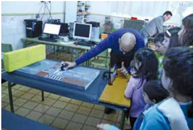
Els alumnes aprenent a fer un curt amb la tècnica de l'Stop Motion.

L'Emili Carles-Tolrà dedica les Jornades de descobriment al setè art