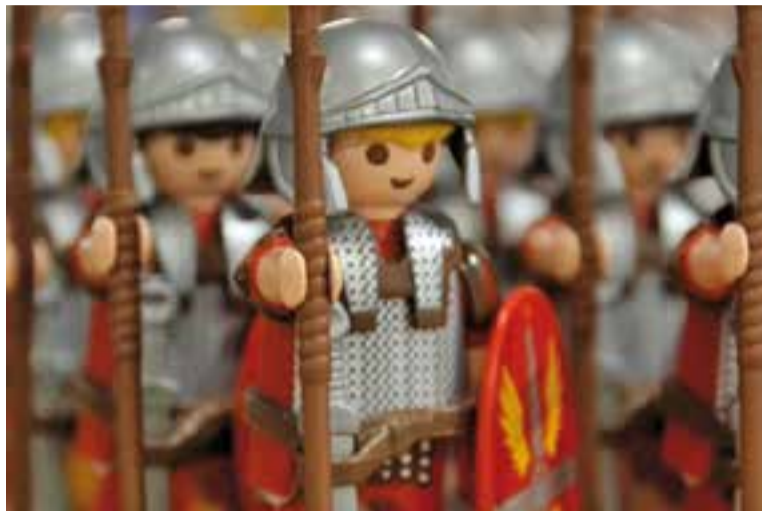
Les figures de Playmobil ompliran l'Espai Tolrà el dies 18 i 19 de març. || ESPLAY

Aquest darrer esdeveniment comença justament el pròxim 1 de març i fins al dia 17 a 24 comerços associats a Comerç Castellar. En alguns establiments, hi haurà 12 figures de Playmobil gegants i en altres diorames. Comerç Castellar proposa un concurs d'Instagram on resultarà guanyador aquell que pengi en