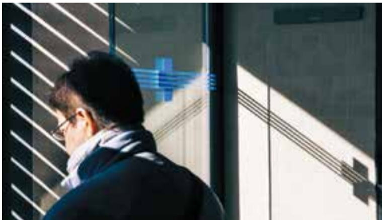
Les urgències nocturnes al CAP de Castellar han estat debatudes al Parlament.

Es dona la circumstància que fa dues setmanes, Som de Castellar-PSC també va informar que s’havia inclòs una esmena al pressupost de la Generalitat que demana justament la recuperació dels serveis de ginecologia i pediatria al CAP de Castellar els caps de setmana. + || REDACCIÓ