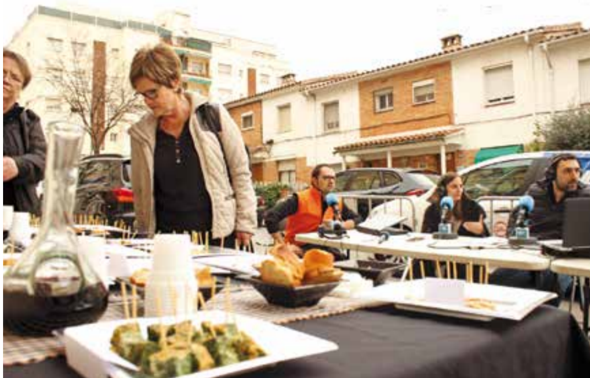
Ràdio Castellar va voler celebrar el Dijous Gras fent el magazín Dotze en directe davant de la botiga Queviures El Castell.

El gruix de la programació de Carnaval tindrà lloc dissabte, amb una jornada farcida d'activitats. Durant tot el dia, el carrer Major es convertirà en zona de vianants i, per tant, estarà tallat al trànsit, per tal d'encabir una proposta organitzada, per sisè