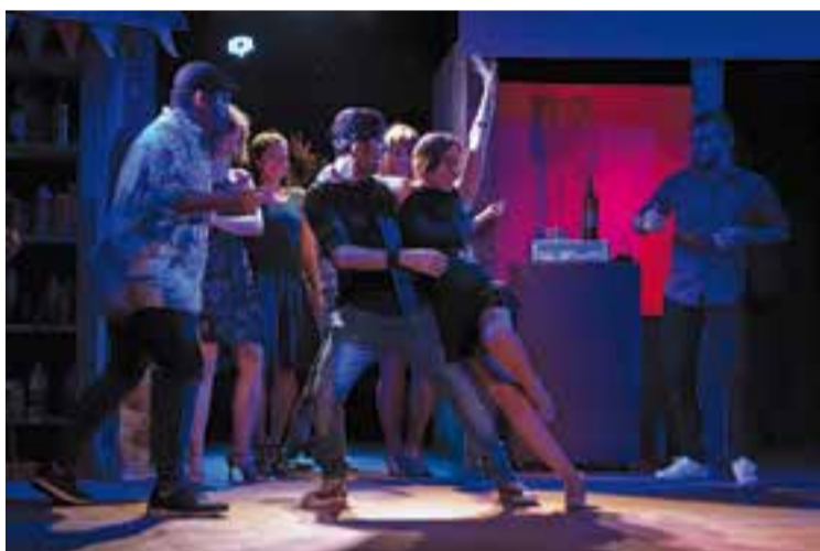
Moment de l'obra 'In the Heights', als Salesians Sabadell. || HELDER