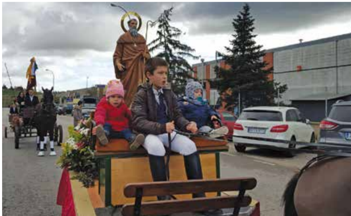
Imatge del Sant Antoni Abat que l'església de Sant Esteve ha cedit a l'entitat en motiu de la Passada de Sant Antoni.

Hi haurà participants de diverses poblacions catalanes: Bigues i Riells, La Roca del Vallès, Polinyà, Sabadell, Sentmenat, Sant Llorenç Savall, Sant Quirze del Vallès, Caldes de Montbui, Les Franqueses, entre d'altres. "Com ja és tradicional, la comitiva de Sant Antoni anirà encapçalada per la Banda i Majorettes de Castellar", afegix Rafart. El recorregut serà el següent: Carrer de Berguedà, Ronda de Tolosa, car-