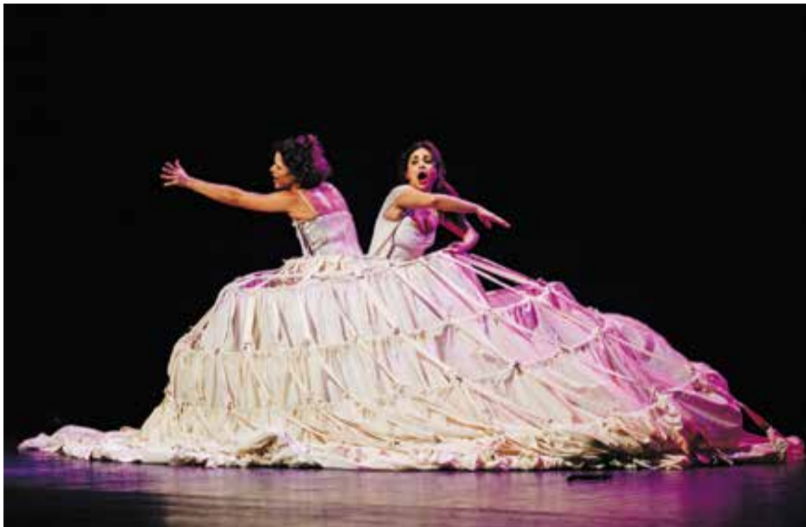
La companyia Dei Furbi en plena representació de la Trilogia MozArt dissabte passat.