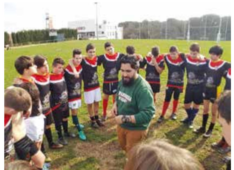
L'equip sub-14 del RC Castellar va aconseguir la victòria a la lliga.