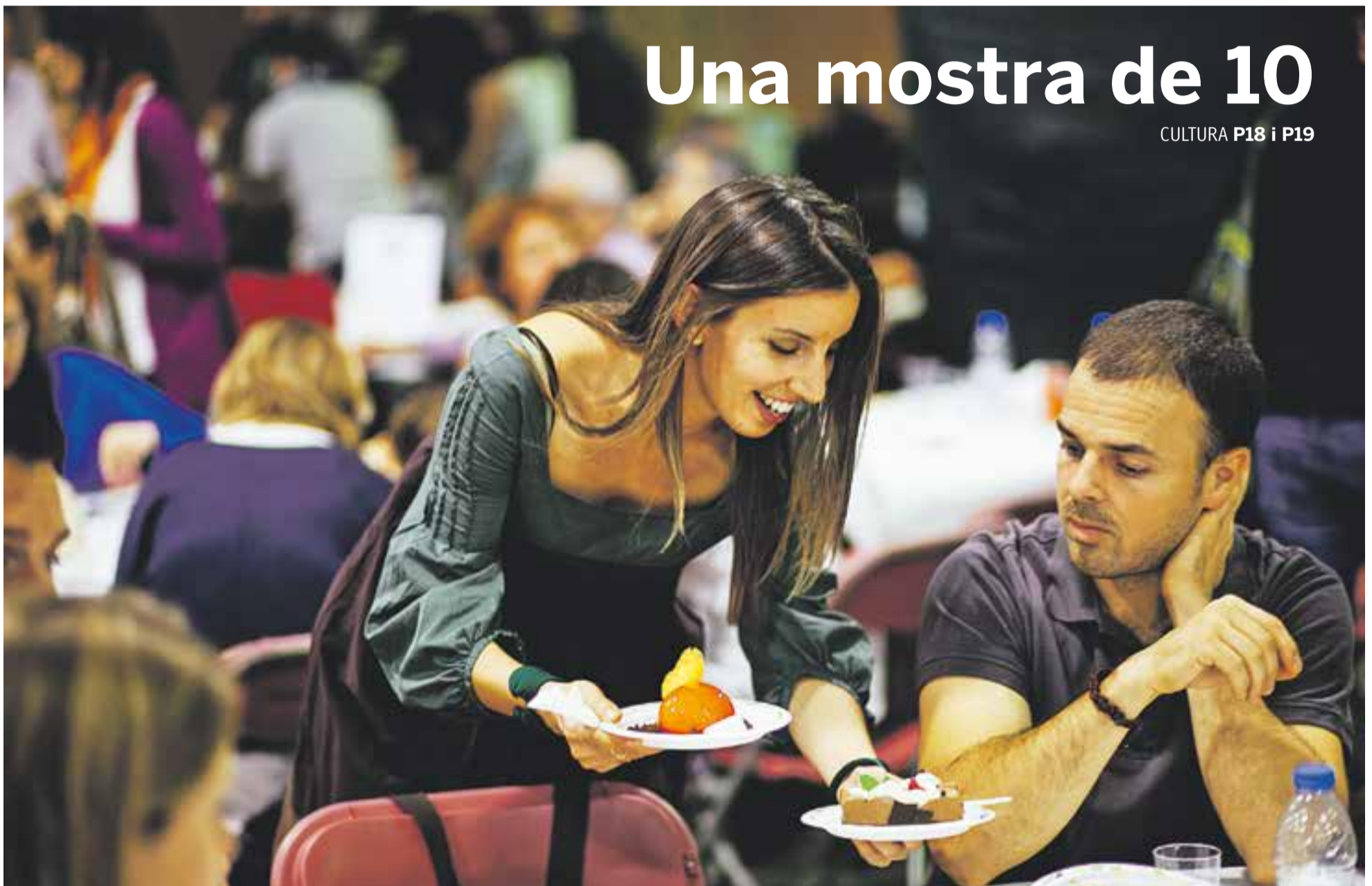
La X Mostra Gastronòmica organitzada el cap de setmana passat per 16 establiments de Castellar ha crescut un 25% respecte a l'edició anterior. || Q. PASCUAL