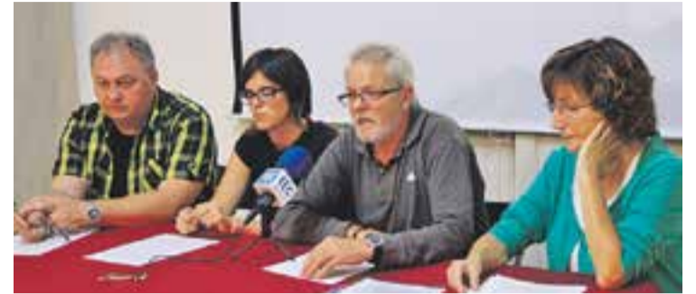
© Alguns dels convocants de l'assemblea, en roda de premsa. || A. PÉREZ