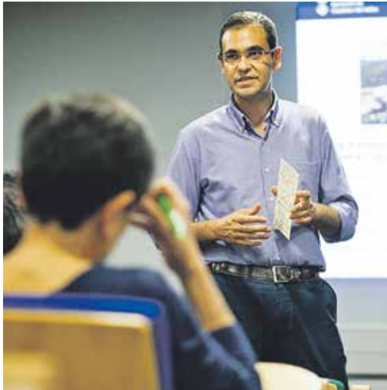
⊙ L'alcalde, en l'acte d'explicació dels pressupostos el passat 16 d'octubre.

per la congelació de la pressió fiscal i el manteniment de les polítiques socials en un context d'austeritat, fent un esforç perquè les principals partides de les regidories socials tinguin un increment total d'un 2,34%. També marcaran el rumb econòmic de Castellar per al 2015 el creixement de les partides destinades a fomentar l'ocupació amb un 9,79%, amb una menció especial a la creació de subvencions a les empreses que contractin durant quatre mesos o més a castellarencs i castellarenques.