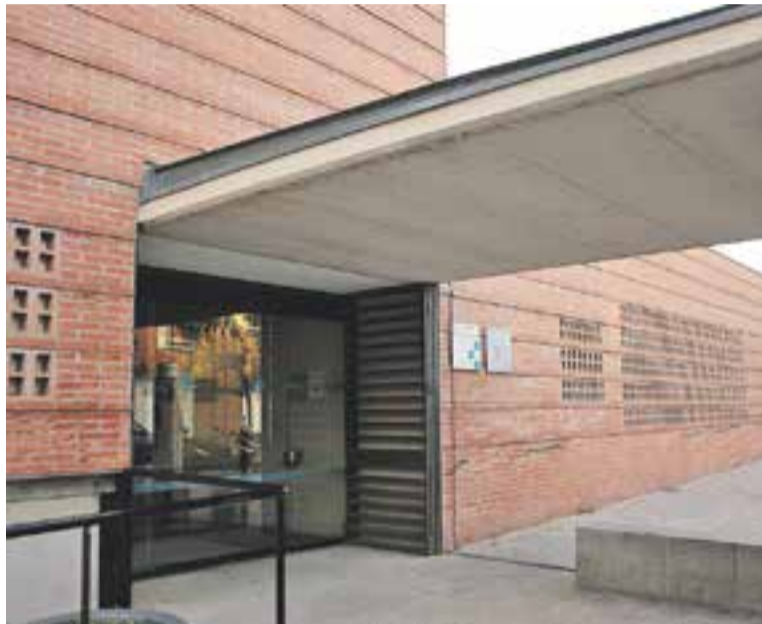
Imatge de l'entrada principal del CAP, dimarts passat.

El circuit d'actuació per a tots els sanitaris en cas de produir-se un possible diagnòstic per infecció d'Ebola és aïllar el pacient a la sala ja habilitada, a l'espera que el Servei d'Urgències Epidemiològiques de Catalunya, al qual han d'avisar immediatament, actuï per facilitar el trasllat del malalt a l'Hospital Clínic, l'únic centre de Catalunya que està autoritzat i preparat per oferir assistència a infectats d'Ebola. +