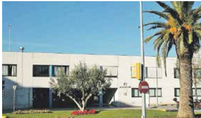
L'institut Castellar és un dels dos espais on es podrà votar el 9N.

vern que el municipi només disposa de dos centres d'educació secundària que són titularitat de la Generalitat i que aquests "es troben allunyats del centre de la població". "D'altra banda, pensem