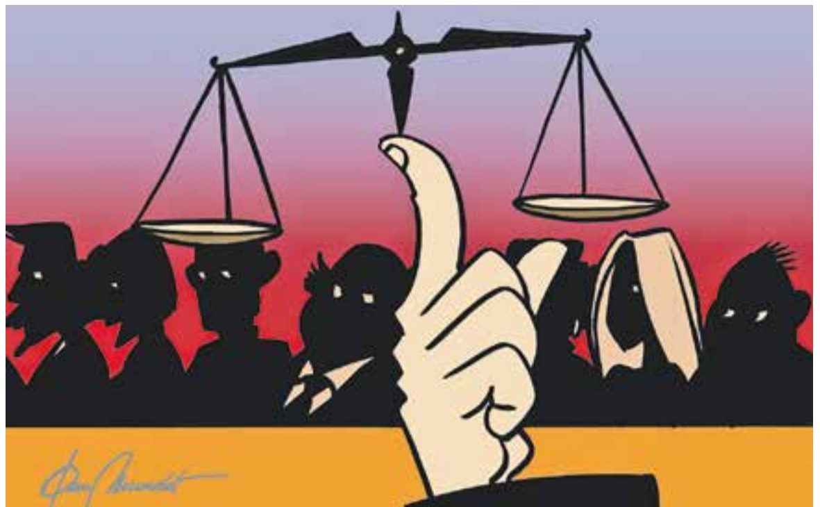
© Just i cia. || JOAN MUNDET

El tribunal del jurat popular es constitueix prèvia nova selecció per a cada causa en concret, de 36 perso-