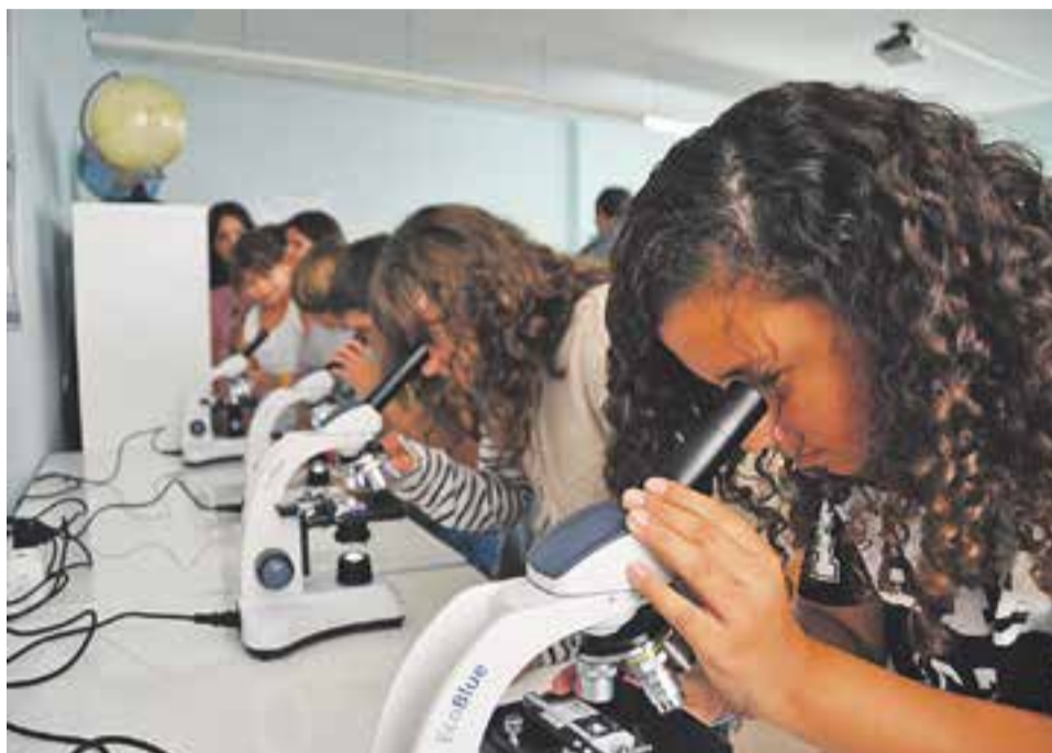
⊙ Un grup d'alumnes del Mestre Pla prova els microscopis del nou laboratori.

Aquesta nova proposta servirà perquè els nens i nenes del col·legi puguin experimentar, fer noves experiències i aprendre de manera més fàcil el món de la ciència. "Ens ha costat gairebé un any per poder fer la idea una realitat. Després d'agrupar diners per aquest nou projecte, vam decidir eliminar una aula de pàrvuls per construir el laboratori" , explica el director. El laboratori el faran servir tots els alumnes del centre, des de P3 fins a sisè de primària tenint el seu horari respectivament. "Els més petits faran les pràctiques més simples, com per exemple observar objectes que suren a l'aigua i d'altres que no" ,