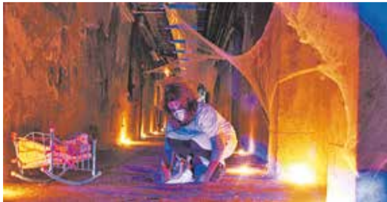
El Túnel del Terror de l'any passat.

La programació, oberta a tota la població, s'enceta el dimecres 29 amb una projecció de cinema de terror a la Sala d'Actes d'El Mirador. Els joves podran escollir entre tres títols a través del Facebook de l'Espai Jove i se seleccionará la pel·lícula més votada. L'endemà, es procedirà a conèixer els guanyadors del I Premi de microrelats de terror,