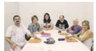
Els membres de la nova proposta.

i s'hi podrà incorporar qualsevol persona en qualsevol moment. Per fer-ho, només cal adreçar-se al Servei Local de Català presencialment de dilluns a dijous d'11 a 13 hores, enviant un correu electrònic a castellarvalles@cpnl.cat o trucant al telèfon 93 714 30 43. L'únic requisit per poder formar part del grup és que ja es parli català i es vulgui millorar la fluïdesa i ampliar el vocabulari. + || REDACCIÓ