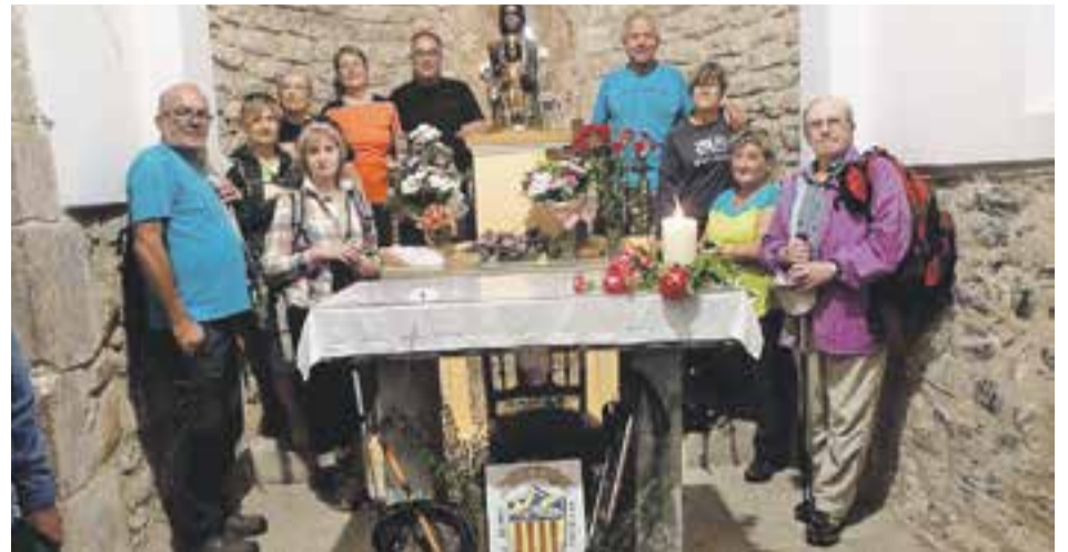
© L'ofrena floral a l'ermita de la Mare de Déu de Les Arenes. || CEDIDA

Són el nombre de degustacions que es van servir durant els 3 dies de celebració de la Mostra Gastronòmica