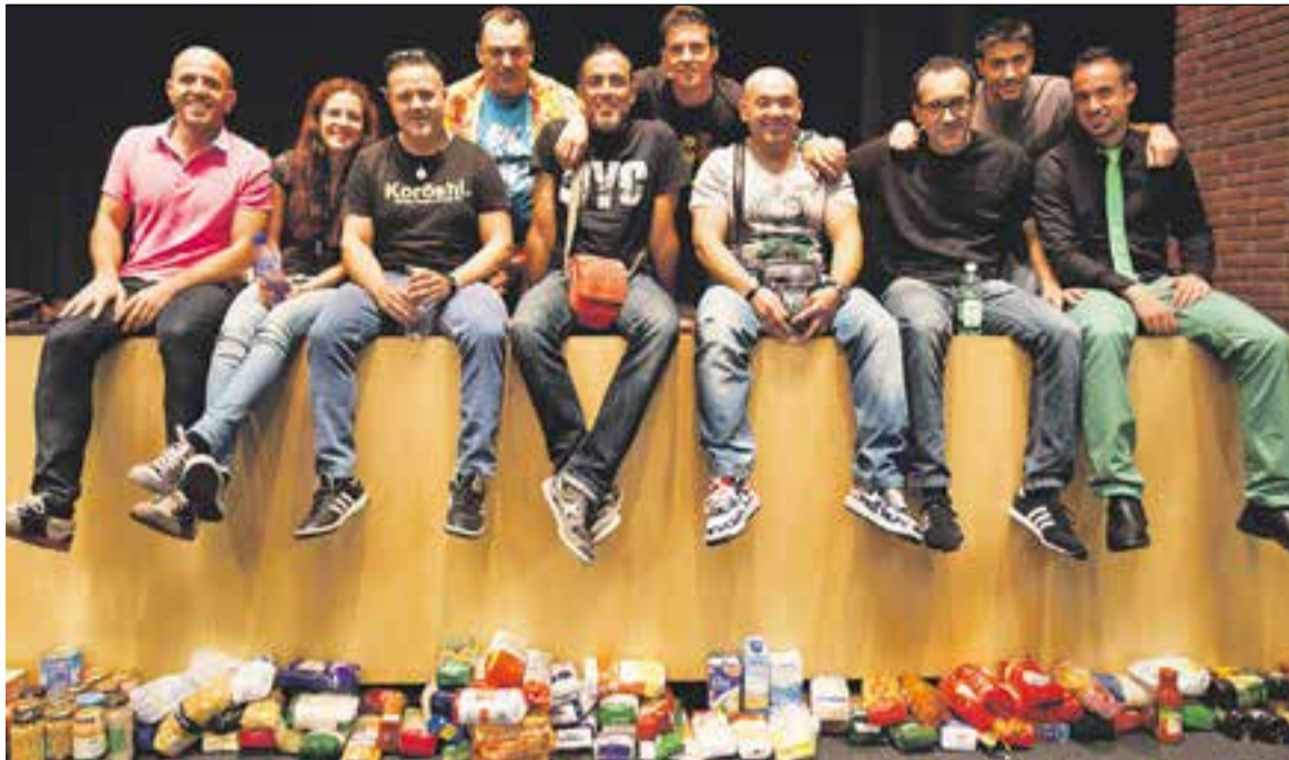
© El grup de monologuistes que van actuar a l'Auditori dissabte passat per recaptar menjar. || Q. PASCUAL