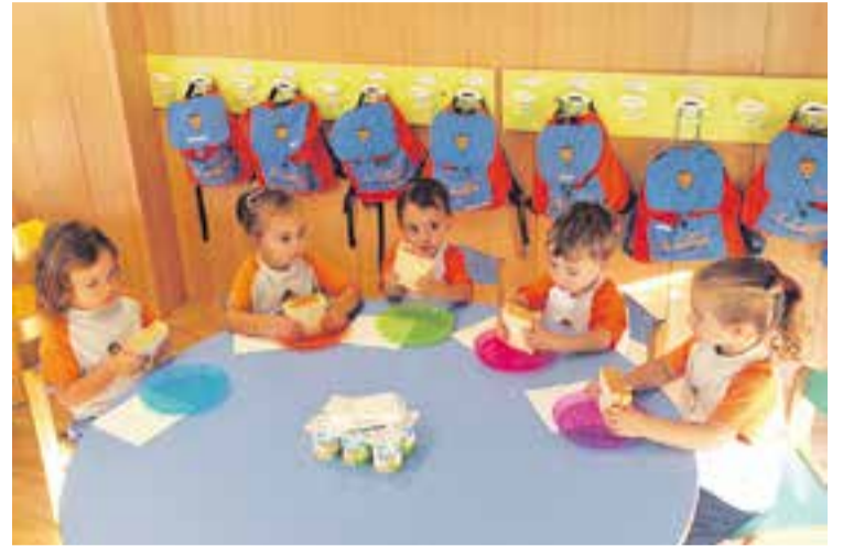
Esmorzar saludable a la llar d'infants La Baldufa de Castellar.