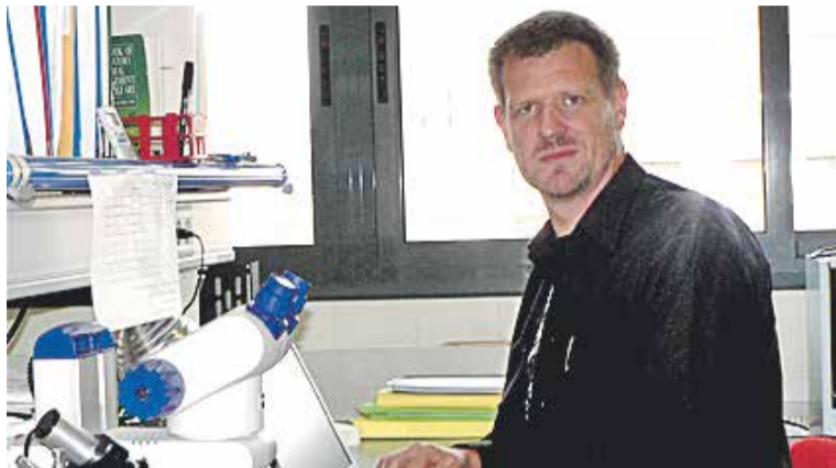
El doctor David Bueno al laboratori de la UB.

Les xerrades del cicle tractaran aspectes com el llenguatge, la psicomotricitat, l'esport o la motivació. En aquest sentit, l'especialista en genètica assegura que el que ens motiva