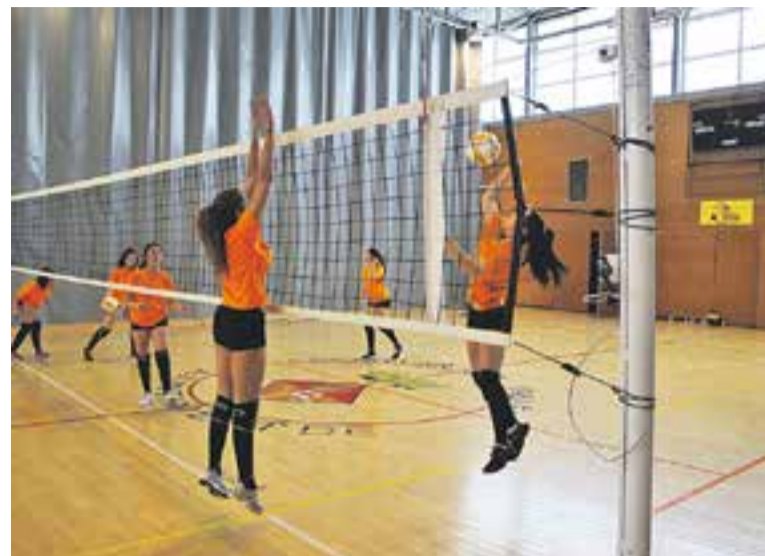
Imatge d'un entrenament de la secció de voleibol del FS Castellar.

EL SÈNIOR MASCULÍ || Al marge d'aquests tres equips, el Futbol Sala Castellar ha arribat a un acord amb l'Escola El Casal perquè un quart equip, en aquest cas masculí, entreni en les instal·lacions del col·legi. De moment, però, no competirà. +