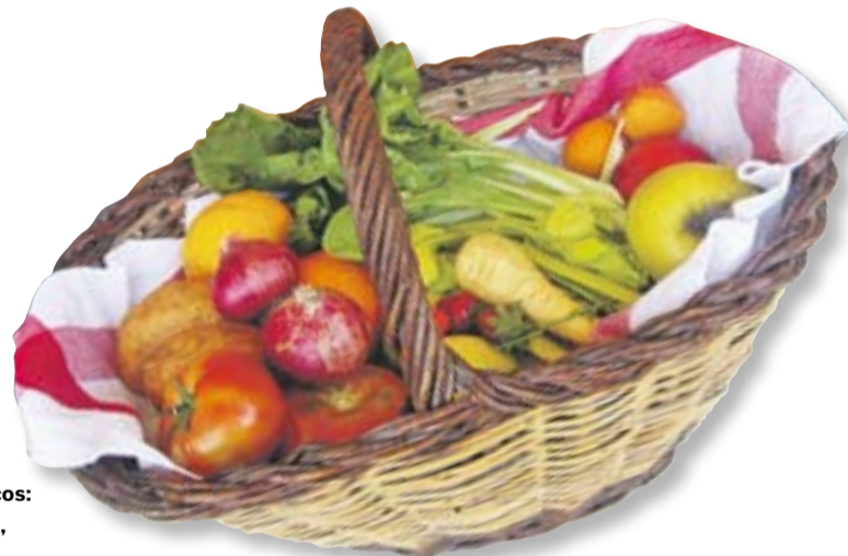
Cistell d'aliments de proximitat frescos: poma de Girona, fruita de temporada, cebes, patates Kennebec, bledes, tomàquets per amanir i altres. || M. A.

podem comparar; el consumidor hauria d'exigir que se li expliqués d'on vénen".