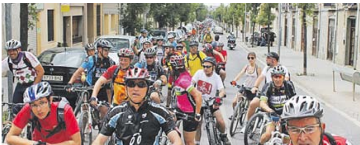
Arribada dels ciclistes als carrers de Castellar.

BICICLETADA POPULAR | CANDIDATURES ALTERNATIVES