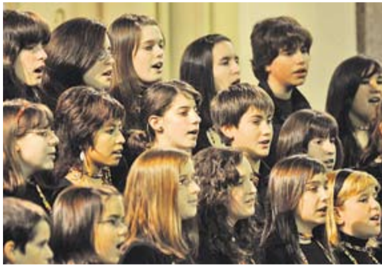
Moment d’un dels concerts d’El Cor de la Nit (2009).

Musicorum va néixer a Esplugues de Llobregat l’octubre