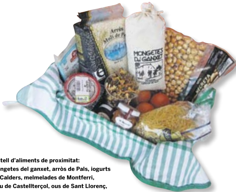
Cistell d'aliments de proximitat: mongetes del ganxet, arròs de Pals, iogurts de Calders, melmelades de Montferri, tofu de Castellterçol, ous de Sant Llorenç, bolets secs de Moià, pasta de Caldes de Montbui, i avellanes de Reus.