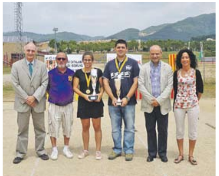
© L'entrega de premis als campions, diumenge. || CBC

ol a Utrecht (Holanda). Torrents ha estat escollit gràcies al resultat obtingut al campionat d'Espanya d'Atletisme celebrat a Durango, en què va ser cinquè als 3.000 metres, amb un extraordinari temps de 8'37''68, que és marca mínima mundial. +