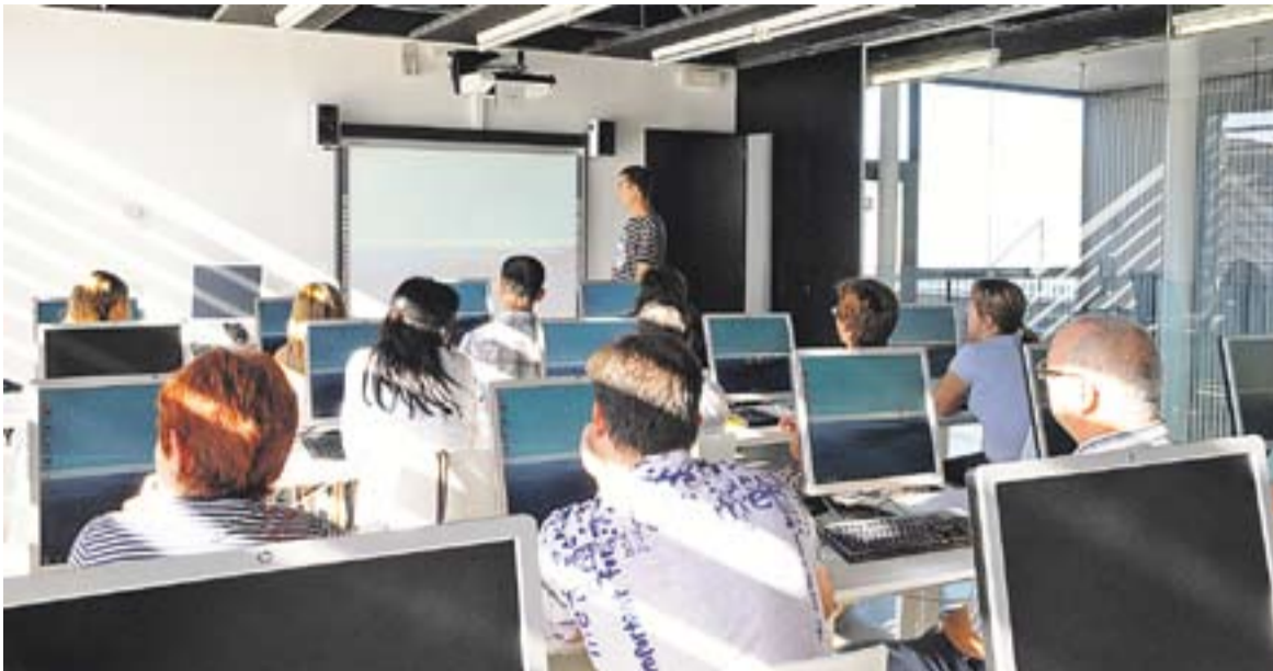
© Una imatge d'arxiu d'un curs de formació al Mirador. || JOSEP GRAELLS