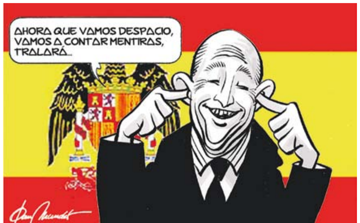
Els seus melics.

Les beques no són almoïna. Són, com diuen els rectors, una ajuda social. No un premi ni un càstig per ningú