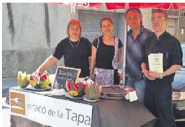
RACÓ DE LA TAPA