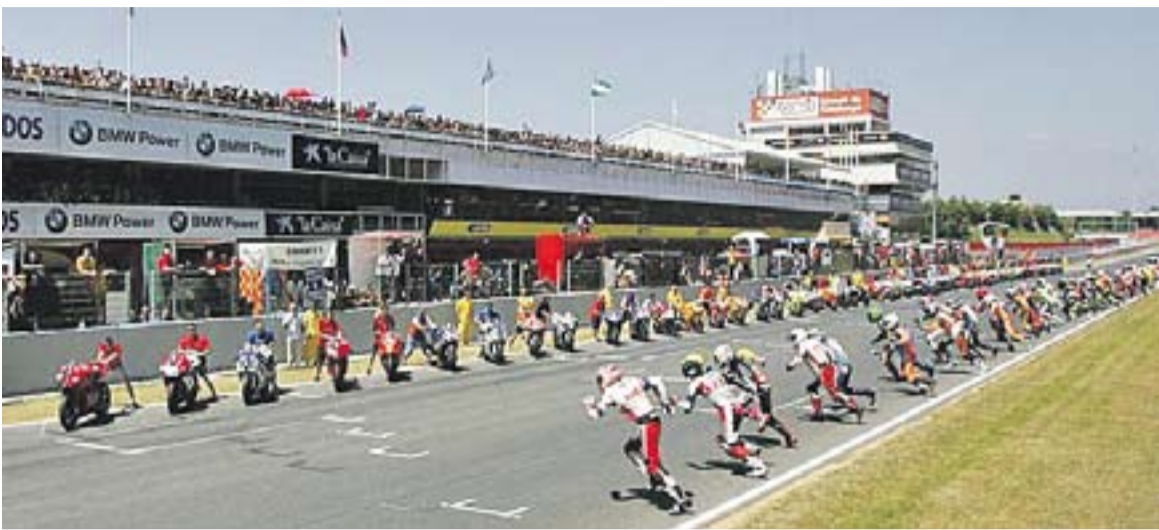
La sortida de les 24 hores de motociclisme en una de les passades edicions.