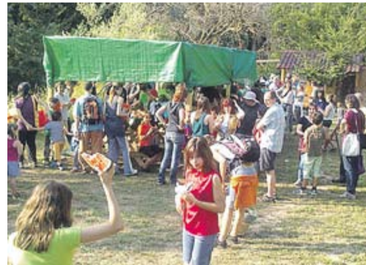
© Els participants a la sortida durant la sindriada. || ERC CASTELLAR

TOQUEM DE PEUS A TERRA | TERCERA PASSEJADA