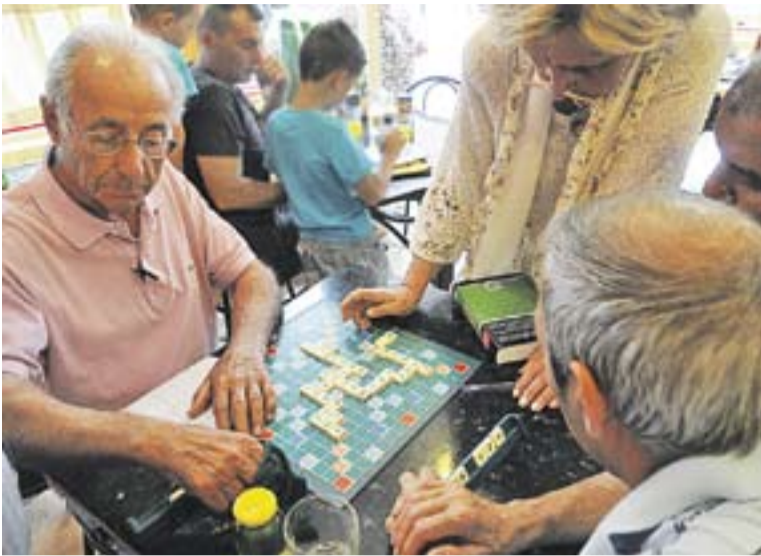
Grup de voluntaris en una partida d'Escrabble al Cafè de Castellar.