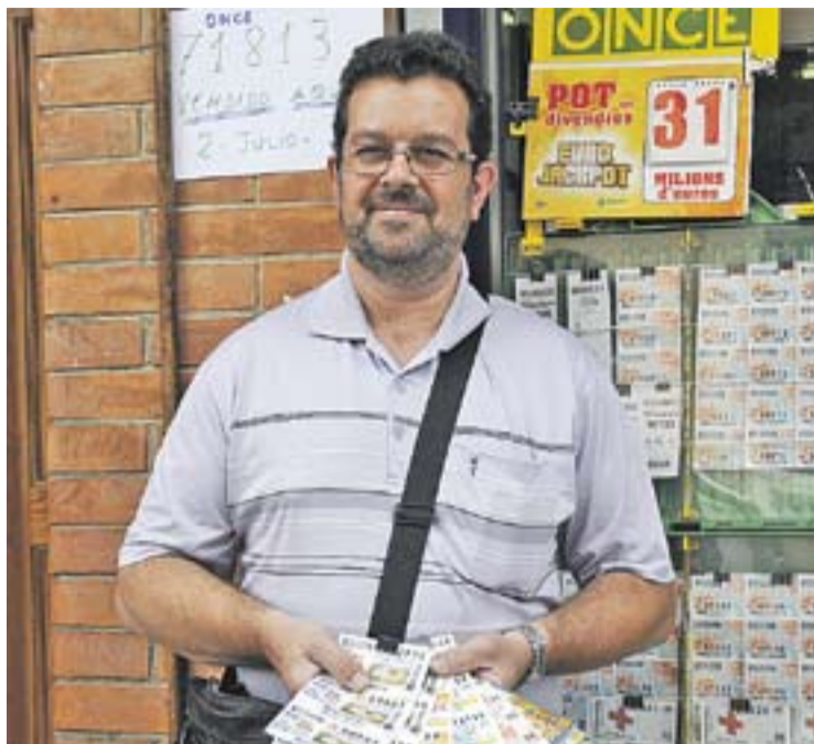
© Enric Algarra, en el seu punt de venda al carrer Sant Pere Ullastre. || J. G.

El presumpte propietari de la plantació va ser detingut a Guadajajara per la Guardia Civil el passat dia 8 de juny, i va passar a disposició judicial. No es descarten noves detencions. †