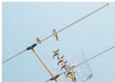
Orenetes sobre una antena