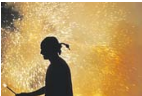
Festa popular de l'ETC

Envia'ns fotos fetes amb el mòbil: lactual@castellarvalles.cat