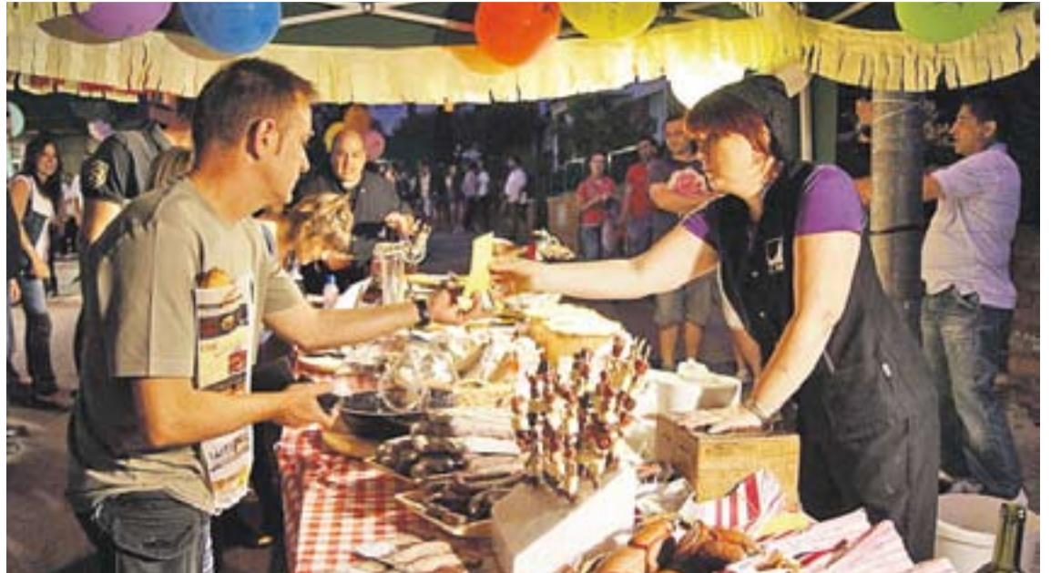
Un client fent la compra ben entrada la nit a l'Avinguda Shopping Night