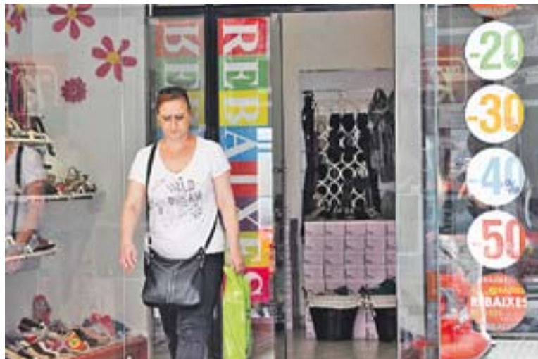
Una clienta surt de fer una compra de rebaixes en una sabateria dimarts.

El fet que no s'hagin produït temperatures altes fa que els comerciants encara tinguin molt producte per vendre fins al punt de trobar-se amb el fet que "allò que hauries de rebaixar encara no ho has venut" , apunta Ogaya. Per exemple, el president de Comerç Castellar assenyala que si un botiguer té un tipus de producte per quan fa molta calor, i que aquesta encara no ha arribat fins ara "posar-lo en rebaixa ara vol dir perdre tot el benefici que podies tenir" . En aquest sentit, el secretari general de la Confederació