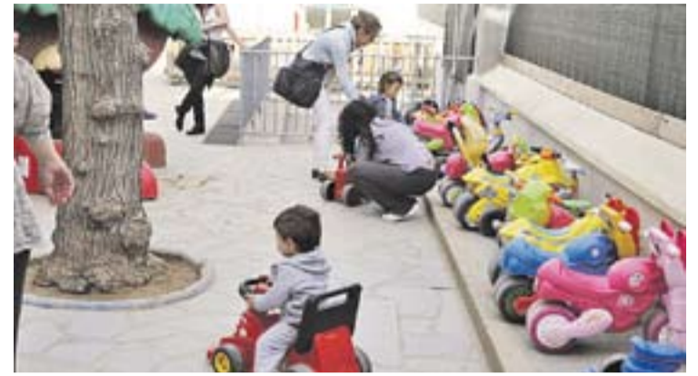
Portes obertes a l'escola bressol El Coral, l'abril passat.