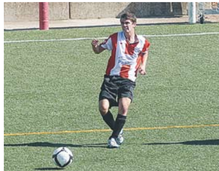
Els castellarencs sumen tres victòries i un empat fora de casa.

castellarencs empatats a tres victòries i tres derrotes a la taula, al vuitè lloc de Copa Catalunya. Amb aquest resultat, la zona de fases de permanència queda a una victòria per sota. La setmana que ve juguen a la pista del Roser. †