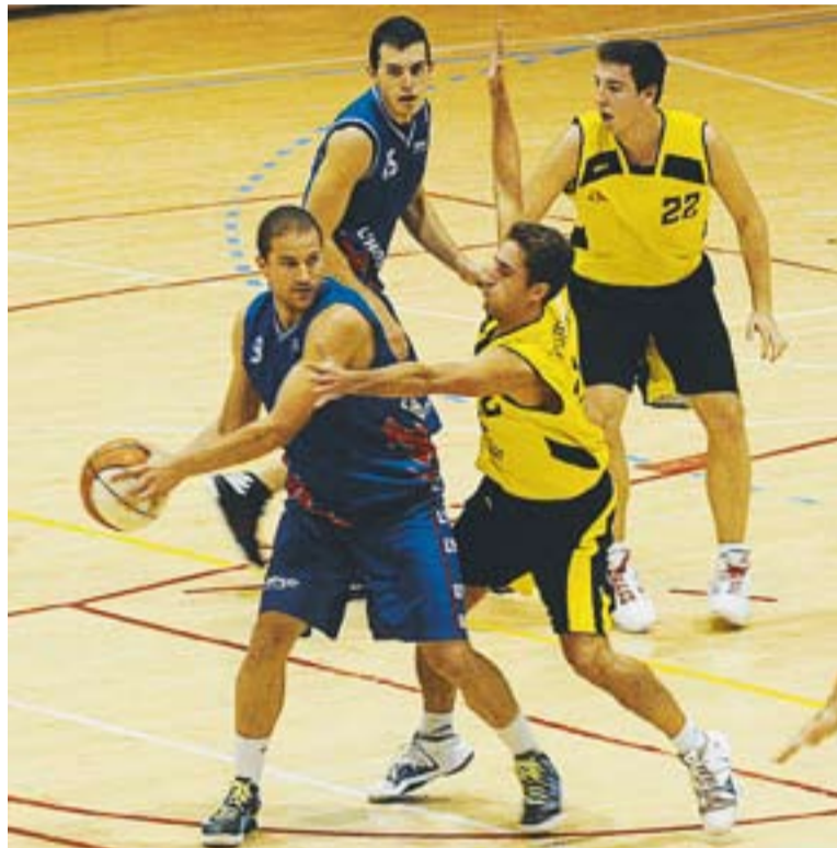
© Oriol Parcerisa lluita una pilota en el partit de diumenge. || JOSEP GRAELLS

Els castellarencs van fer un brillant resultat en l'últim període i amb un ràpid parcial de 10 a 0 es