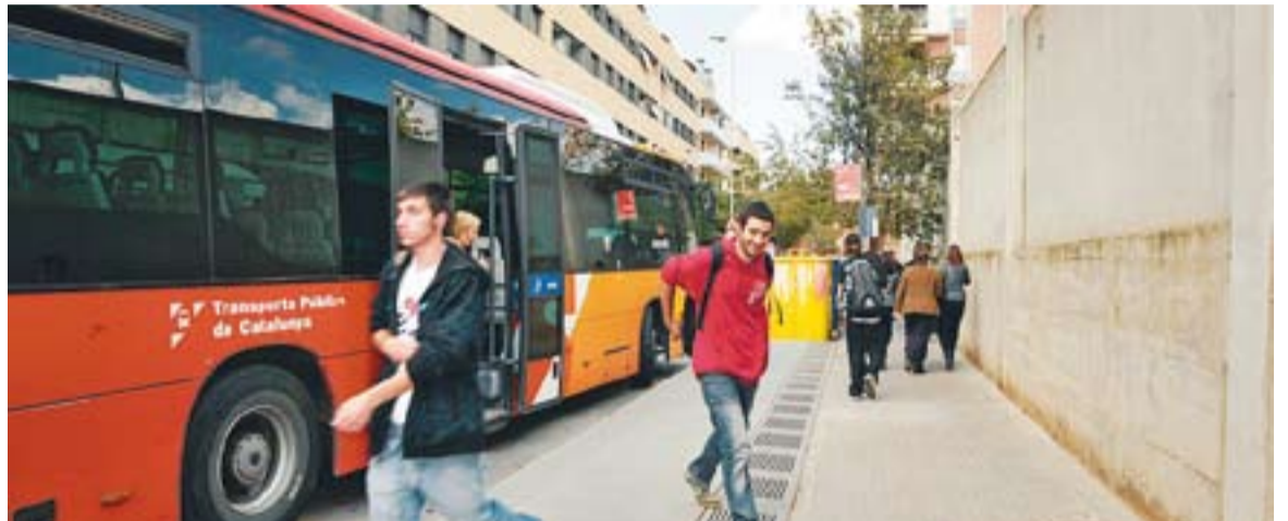
Un autobus de La Vallesana a la parada del carrer Tarragona.

NOMÉS ALS AUTOBUSOS || Els nous títols es podran comprar als mateixos autobusos i a les estacions de bus de Sabadell i Terrassa. A més, Sarbus està estudiant l'ampliació dels punts de venda de cara al 2013. En aquest sentit, el regidor de Mobilitat ha apuntat que la companyia està negociant "amb algun quiosc o estanc per posar