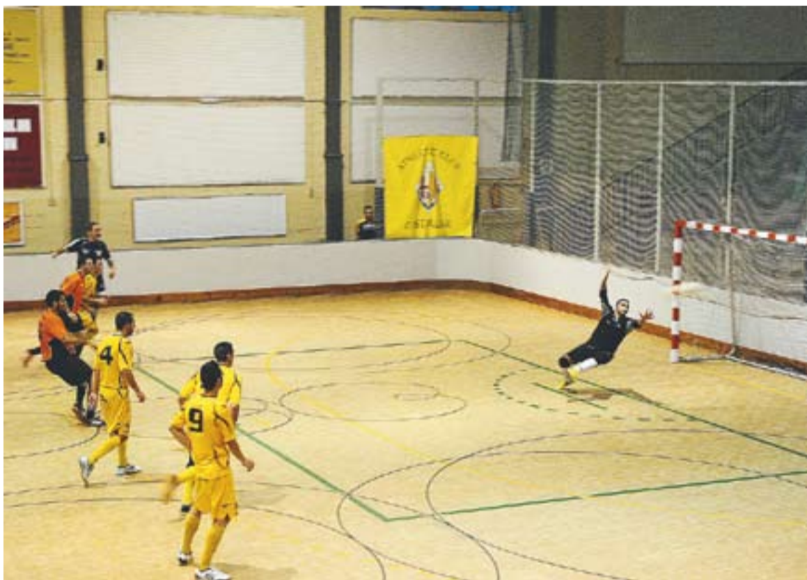
Gol de doble penal a càrrec del FS Castellar.