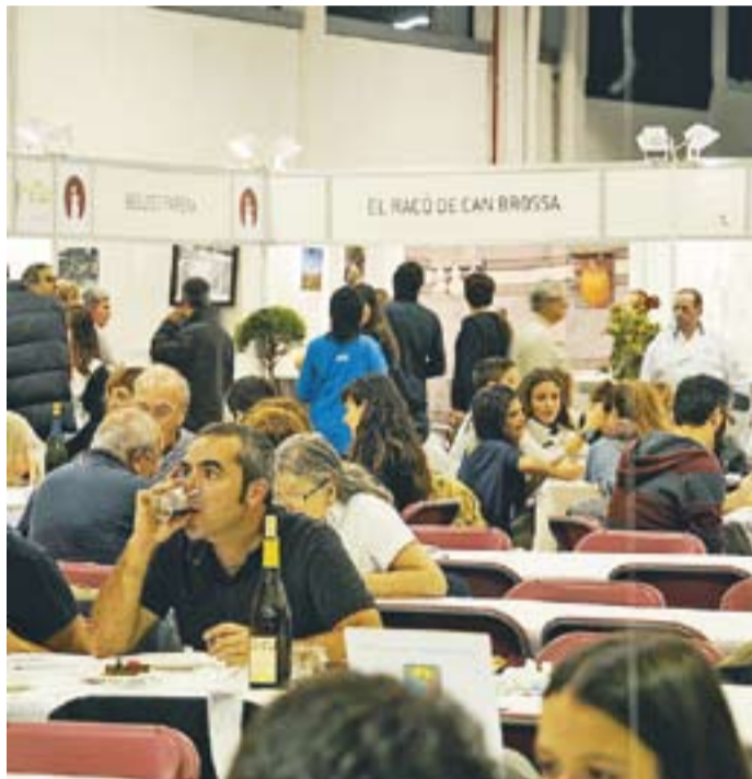
A l'esquerra, diversos assistents gaudeixen de l'oferta gastronòmica. A la dreta, dos 'petits cuiners'.

Al sopar, els presents van gaudir d'un menú compost per vuit plats molt variats i compatibles amb tots els gustos. Les possibles eleccions anaven des de les pizzes de la pizzeria La Volta a la sopa de fredolics del restaurant Garbí. "Cadascú té el seu