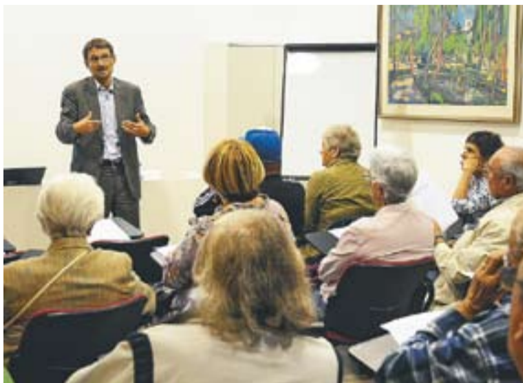
Trabado, durant la conferència que va fer a El Mirador

La salut mental sempre ha tingut moltes mancances. Fins els anys 90