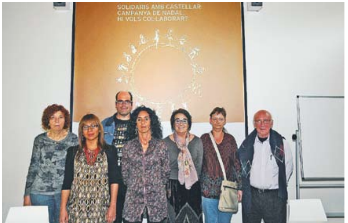
⊕ Representants de les entitats que formen part de la Comissió d'Inclusió Social del Consell Sociosanitari amb Massagué || J.G.

Els dos darrers dies de la campanya, 9 i 10 de novembre, els membres de la Borsa de Voluntaris de la vila s'instal·laran a les portes dels supermercats del municipi per tal d'informar-ne amb detall a la ciutadania i de fer recollida de productes in situ. "Durant el novembre es posarà en marxa la segona part de la campanya, on els voluntaris faran els lots. A par-