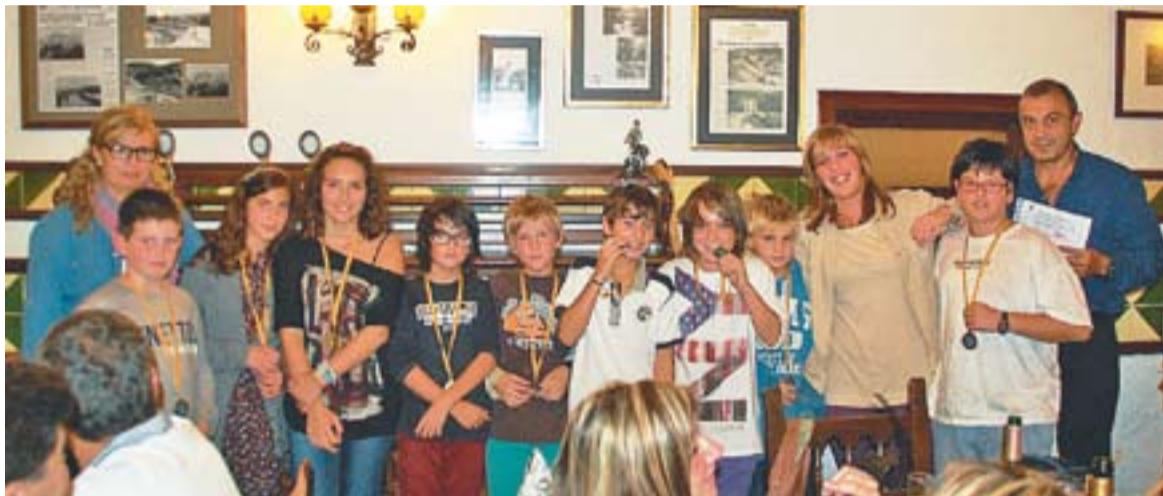
Els més joves del Club Tennis Castellar van ser protagonistes al sopar de cloenda.

L'entitat celebra amb premis el sopar de cloenda i aquest cap de setmana organitzarà el Clínic Tennis Wilson obert a socis i no socis