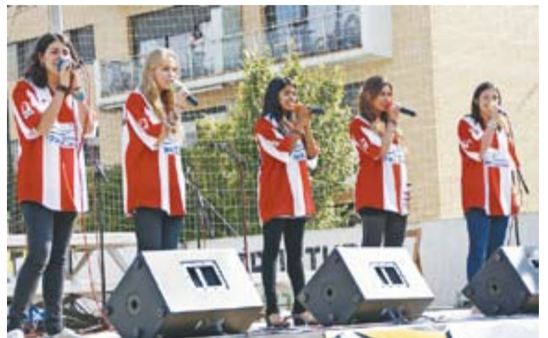
Les Macedònia que pleguen, en l'actuació del centenari de la Unió.