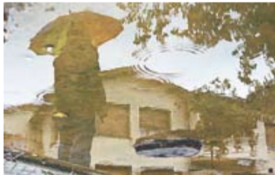
Dia de pluja de tardor