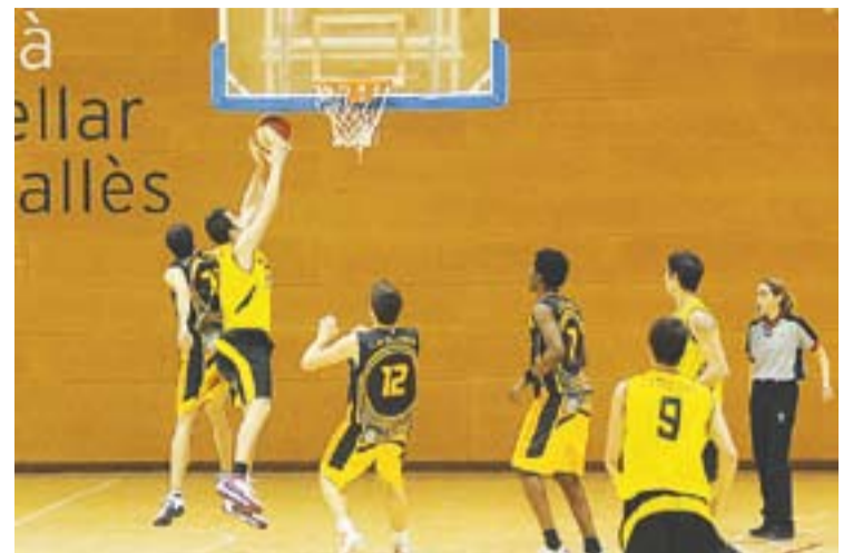
© El triomf fora de casa es segueix resistint. || JOSEP GRAELLS

La UE Castellar baixa dues posicions i ara és onzè. Aquest proper cap de setmana descansen i el següent rebran el Sabadell B a casa. +