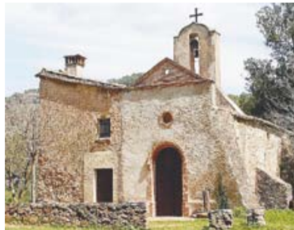
Ermita de Les Arenes.