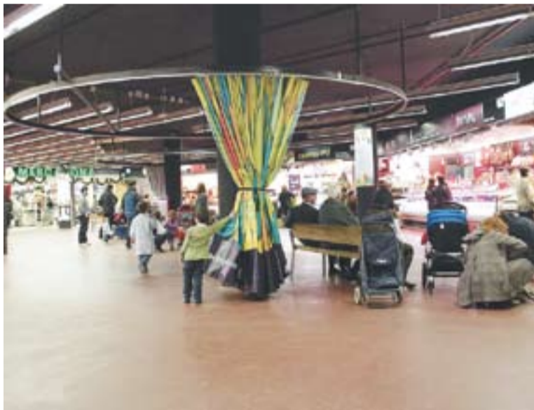
Imatge del Mercat Municipal, divendres passat.

mitat de les rebaixes fa que caiguin les vendes d'aquest sector”, afegeix Masqué. “Molta gent esperarà a les rebaixes per comprar roba i complements”, comenta la dinamitzadora.