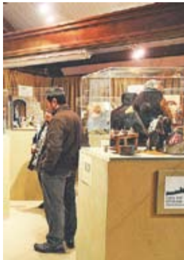
Exposició d'oficis al primer pis.

L'exposició d'enguany s'ha titulat Oficis, tradicions i pessebres . Està dedicada als oficis tradicionals i adquireix un caràcter emotiu i singular. "I és que els pessebres no només representen la realitat històrica i religiosa, sinó també a nosaltres mateixos" . +