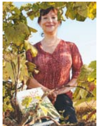
© Portada del llibre de Gisela Pou. || J.G.

La novel·la de Pou està inspirada en el món del cava i tot allò que l'envolta. Es tracta d'una història que narra traïcions, venjances, amors i desamors en el si d'una de les famílies més poderoses del Penedès, la família dels Brucart. || M.A.