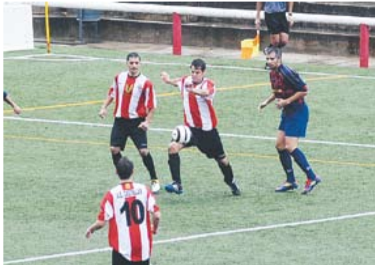
Els castellarencs a casa en un partit d'aquesta temporada.

El Castellar va tenir ocasions per avançar-se i va arribar a enviar una pilota al pal, però a la mitja hora de joc l'àrbitre va xiular penal a l'àrea visitant. "L'àrbitre ha picat, era una piscina clara. El penal no ha existit", opinava el tècnic Quico Díaz. El gol local va fer canviar la tònica del partit. El Canovelles va arraconar-se a la seva zona i a mida que anaven passant els minuts Díaz ha tret més pólvora a dalt. El Castellar va acabar el partit amb cinc davanters però el gol es va continuar resistint. Ni Juanito, en ratxa en els últims