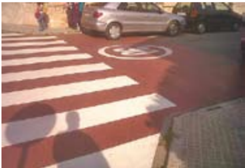
A la zona 30 Autor: Jordi Niñerola

Envia'ns fotos de Castellar fetes amb el mòbil: lactual@castellarvalles.cat