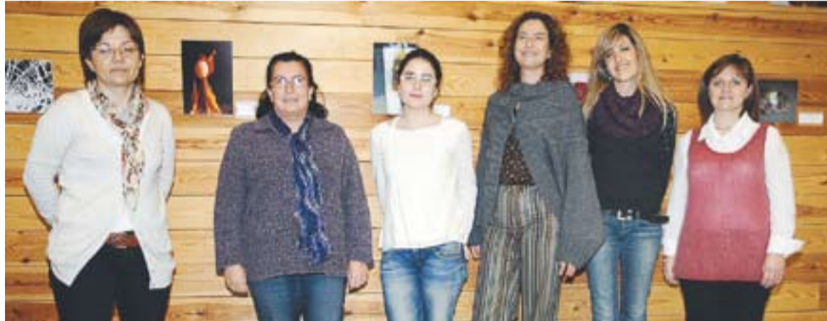
© Guanyadores del concurs de fotografies 'La química quotidiana' i responsables municipals. || J. GRAELLS

D'altra banda, els tres tallers emmarcats en la programació van atraure l'atenció d'unes 200 persones. El més multitudinari, amb 90 participants, va ser el que va realitzar La Mandarina de Newton el 3 de novembre, que portava per títol "Cuinant Ciència". Un nombre semblant de participants, 80 en aquest cas, van assistir a "Reaccional", el