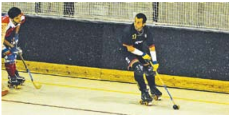
El primer empat a domicili no ha evitat l'últim lloc.

Després de 12 jornades disputades, a només tres d'arribar a la meitat de temporada, el Castellar ocupa zona de fases de permanència a Copa Catalunya. És només a una victòria de sortir-ne. Abans d'agafar vacances rebran el Masnou al Puigverd. +