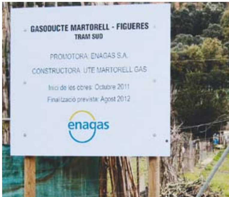
Cartell al riu Ripoll indicant per on travessarà el gasoducte.

L'empresa Enagas és la promotora del gasoducte, les obres del qual van començar a finals de novembre. En el seu moment, l'Ajuntament de Castellar del Vallès va presentar al·legacions al projecte. A l'estiu de 2008 va anunciar que, sumant-se a les reivindicacions d'altres municipis més afectats com Sabadell i Sentmenat, proposaria de forma conjunta un traçat alternatiu que seguiria l'autopista AP-7, un itinerari que ja segueix el gasoducte després de sortir del Vallès. L'Estat, però, va descartar aquest traçat alternatiu adduint motius de seguretat. No obstant,