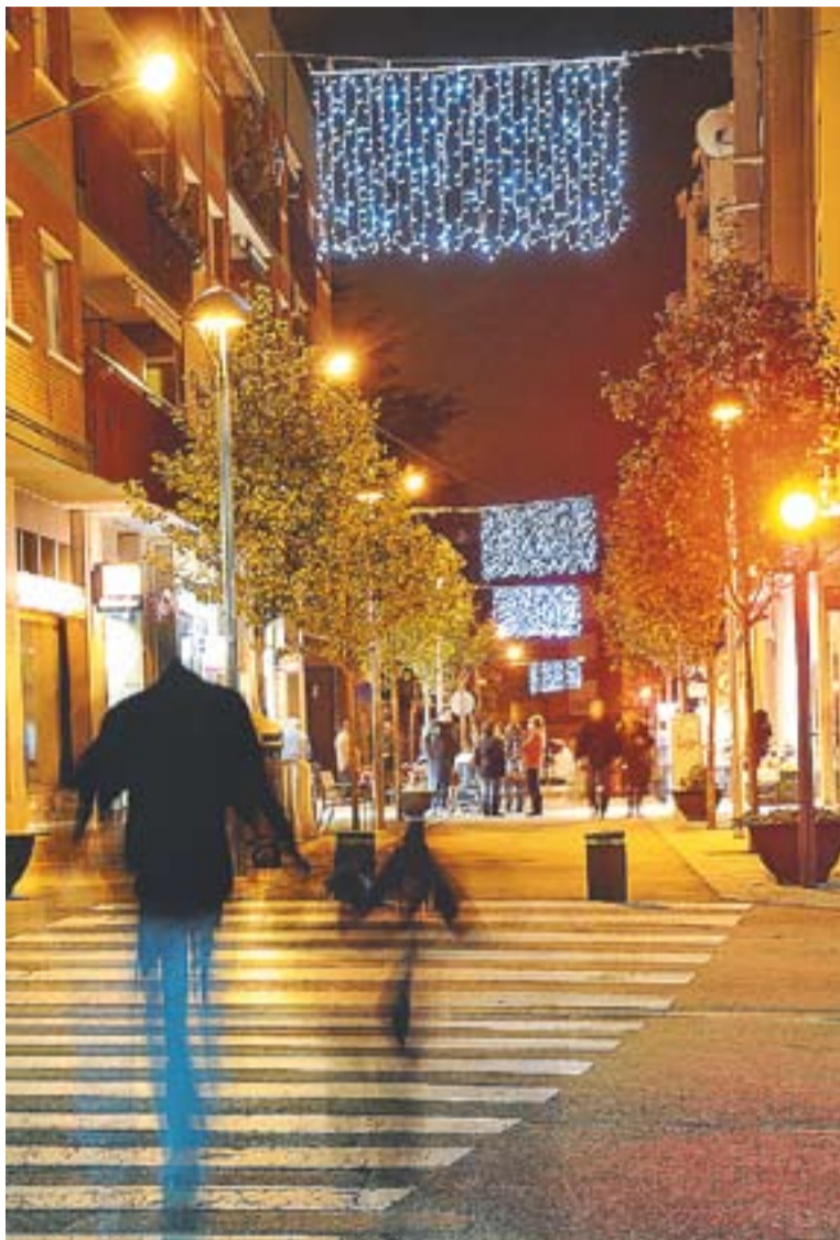
Enllumenat de Nadal al carrer Montcada.