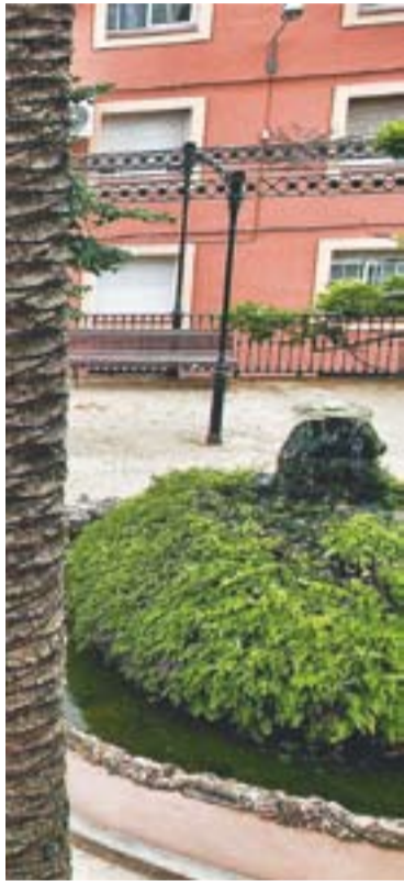
© A dalt i d'esquerra a dreta, casaments als jardins del Palau Tolrà, a Ca l'Alberola i a l'Església de Sant Esteve. || JORDI SERRA