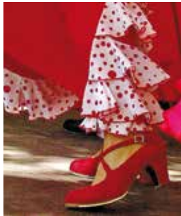
Aires Rocieros Castellarencs