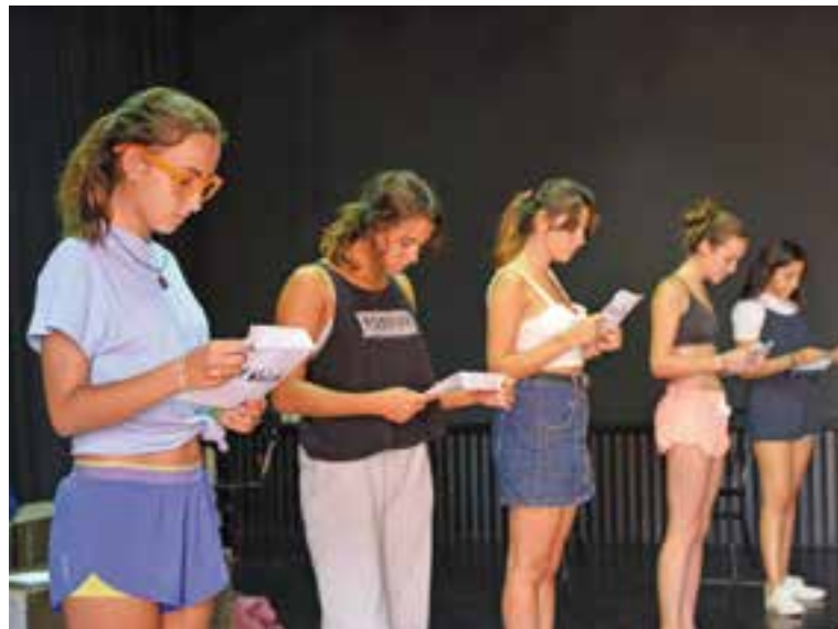
Les actrius de 'Fama' de l'INS Puig de la Creu durant un assaig.