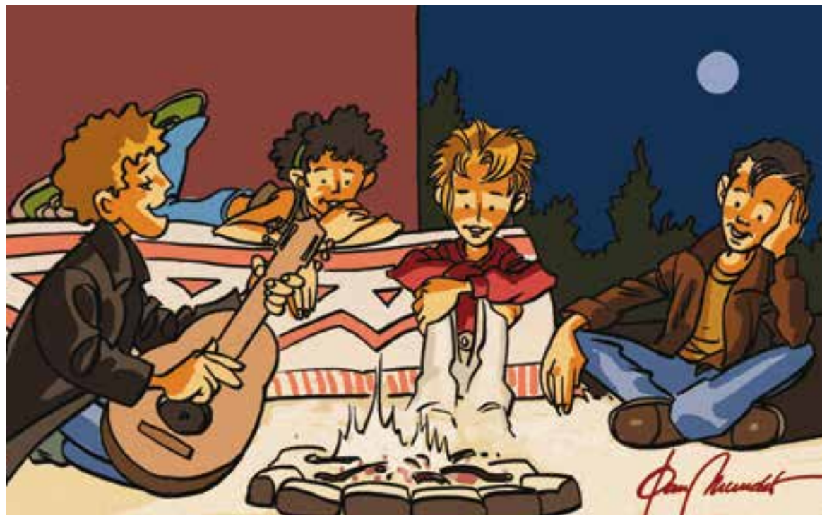
© Sense edat. | JOAN MUNDET

50 anys, de Colònies i d'esplai, una llarga trajectòria, un itinerari iniciat amb les intuïcions sorgides d'una necessitat i que han trobat la seva concreció amb unes conviccions que concreten la raó de ser de les colònies i l'esplai: la importància de cada persona, de la participació en grup, del sentir-se poble, de la pertinença a un país, dels