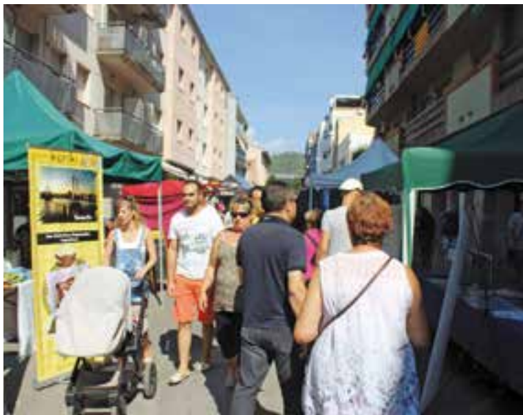
Una imatge de l'Street Market de l'any passat. || AJUNTAMENT

L'activitat es farà als carrers Sala Boadella, Hospital i Montcada, i algunes botigues del carrer Major