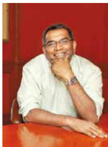
L'autor David Davidar.

A l'inici, s'explica la violació d'una noia que està a punt de casar-se. Amb aquest fet trontolla tot al poble. Sistema de castes, convivència entre les religions, etc. L'autor plasma molt bé el paper de la dona a l'Índia i tot el que han de patir en silenci. + || M. A.