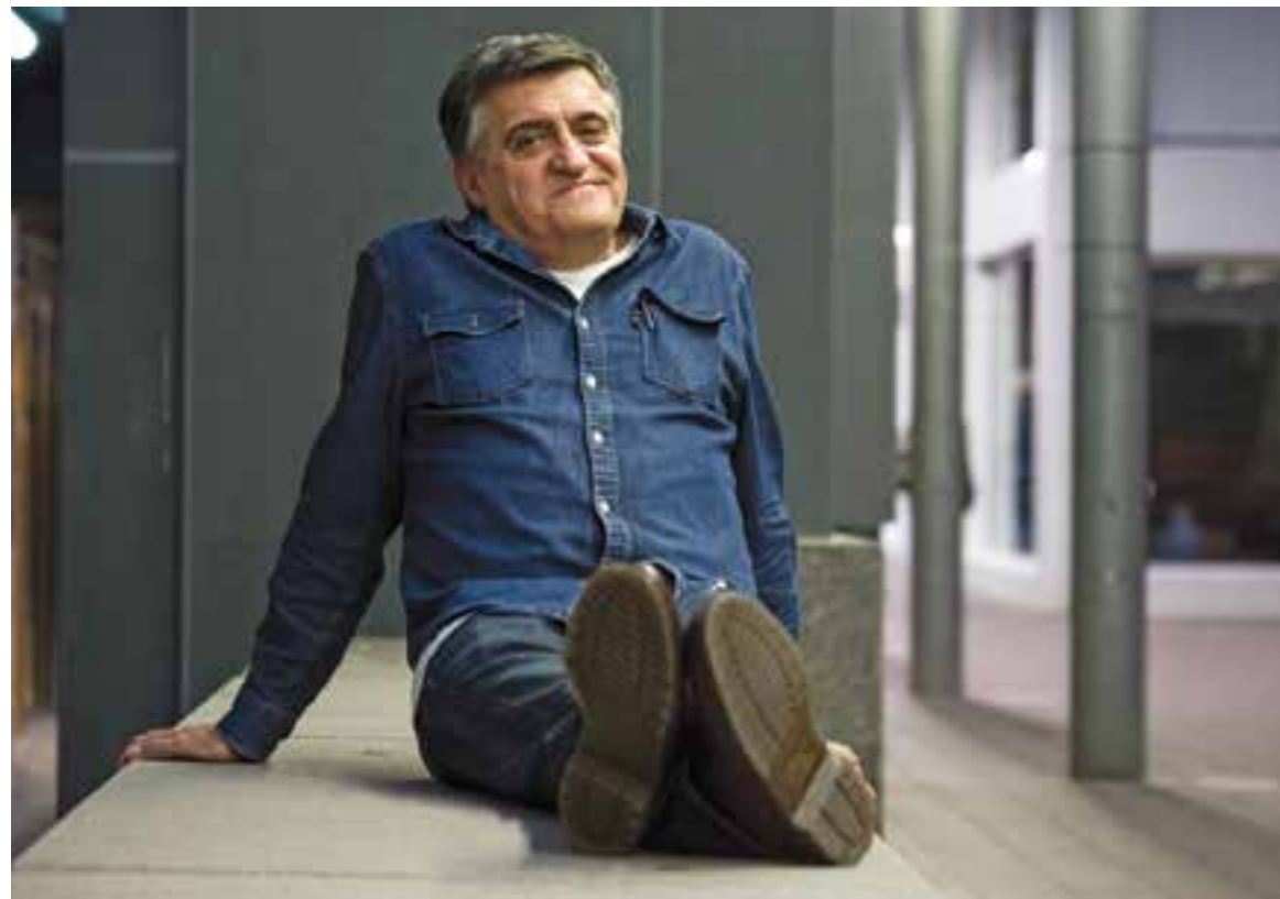
El Gran Wyoming convidarà tots els vilatans a la festa aquest vespre, a partir de les 21.15 a la plaça d'El Mirador.