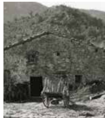
Arxiu d'Història de Castellar