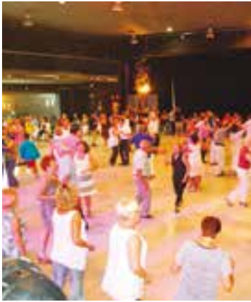
Amics del Ball de Saló