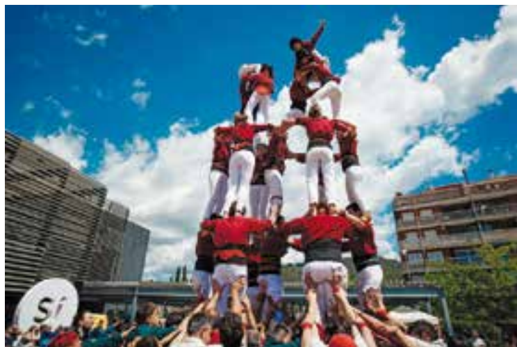
Record del tercer aniversari dels Castellers de Castellar.

I ara! No ens esperàvem aquest èxit. Cada any ha estat inimaginable. Hem anat de gira al Japó i tot! No ens ho hauríem pensat mai. Cada cop tenim un públic més transversal. A Castellar esperem, sobretot, fer el millor concert de la temporada. †