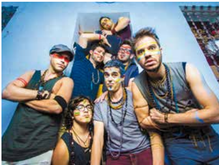
El grup Doctor Prats actua dilluns 11 a l'Espai Vilabarrakes.

Sí, ens agraden molts estils diferents, si estan ben fets, des del pop fins a l'electro swing i el funky. La marca de la casa és no tenir marca. Fem el que en diuen festival fusió.