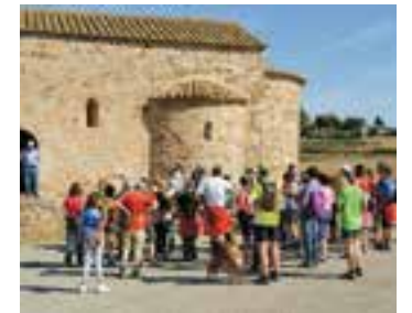
Un tast a Sant Pere Ullastre.

El diumenge de Festa Major, el dia 10 de setembre, arrencarà una nova edició del Tast d'Excursionisme, que arriba a la 19a edició. En aquesta ocasió, l'equip del Centre Excursionista de Castellar (CEC) ha dissenyat un itinerari d'11 quilòmetres que es pot fer en un temps de poc més de 5 hores, segons han provat ells mateixos. El traçat del tast és moderat i arrencarà des del local social de l'entitat, al carrer Colom s/n i seguirà pel Pla del Palau, Torrent del Ginebra, Parany de Cadafalch i visites als forns d'obra, de calç i de pega del torrent Mal, Alzina Balladora, coll Roig, fonts Ates, Sot de Goleres i Arxiu d'Història.