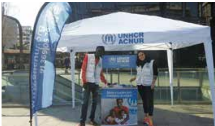
Estand informatiu d'ACNUR.