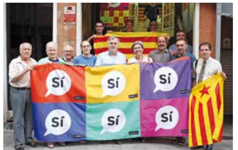
Representants de PDeCAT, Decidim, ERC, ANC i CAL, dimecres passat

Finalment, la CAL ha anunciat que no participarà a l'acte de la plaça Catalunya però sí a la tradicional ofrena independentista al carrer de les Roques a les 10 hores, un acte que també comptarà amb l'assistència de l'ANC, ERC, PDeCAT i Decidim. +