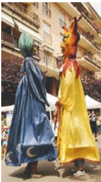
© El Sol i La Lluna també van participar