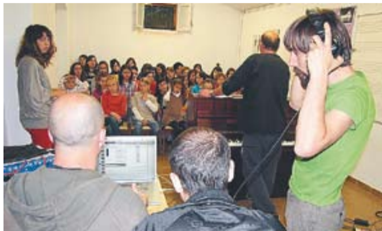
© Enregistrament de la coral amb Standstill, grup convidat al Primavera Sound.

Actualment, Standstill s'ha convertit en una banda sense fronteres ni límits estilístics i té un discurs musical extremadament ric, tant en les formes com en els detalls. "Hi ha qui ja anuncia el seu