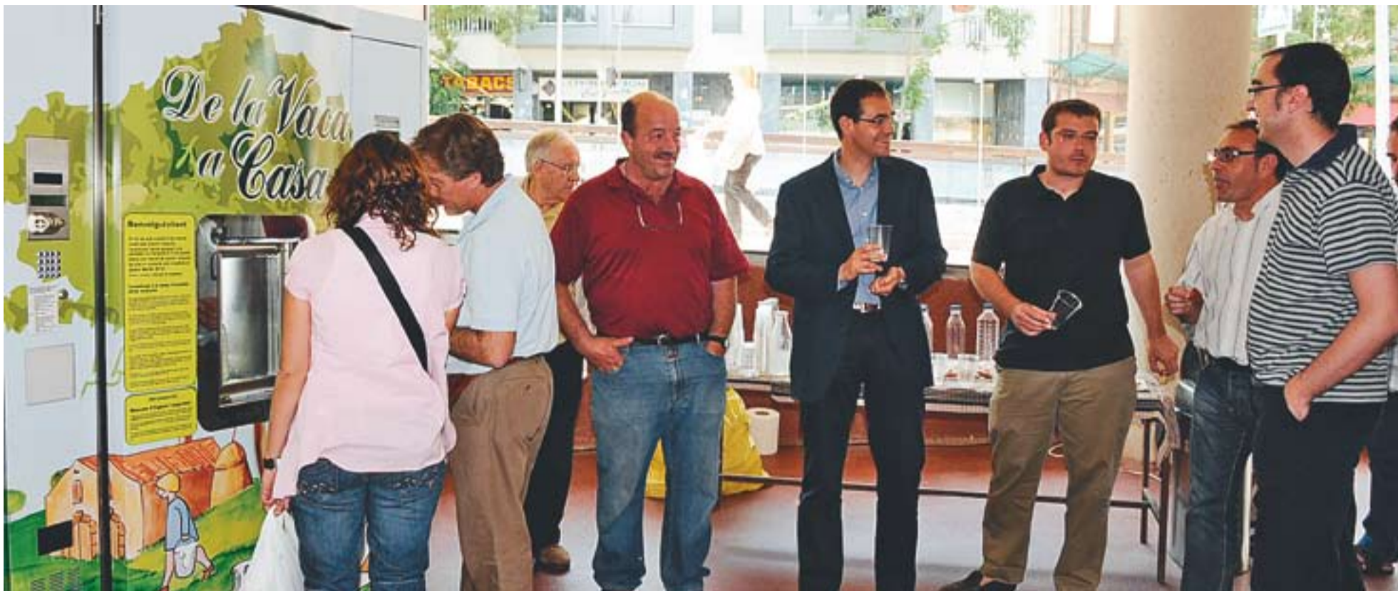
© A l'esquerra, els primers clients de la màquina de llet instal·lada a l'interior del Mercat Municipal. A la dreta, l'alcalde i altres regidors de l'equip de govern. || JOSEP GRAELLS