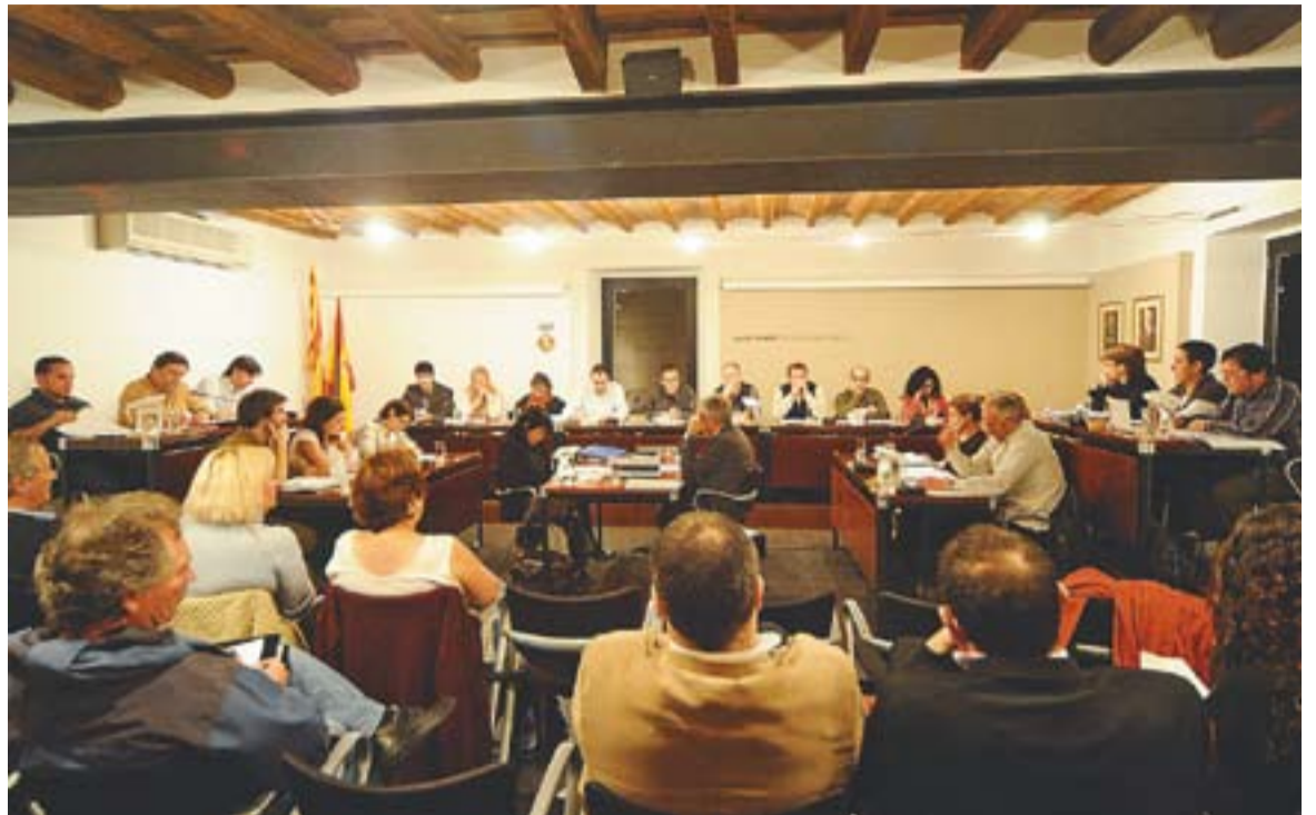
⊙ Imatge d'arxiu d'un ple municipal, en concret el del passat mes de novembre.

A les restriccions pròpies del Pla de Sanejament de l'Ajuntament de la vila i del pressupost de 2010, se sumaran ara les mesures extraordinàries de l'estat acabades d'aprovar. Aquestes tindran una afectació directa en la gestió i en les finances municipals que, va