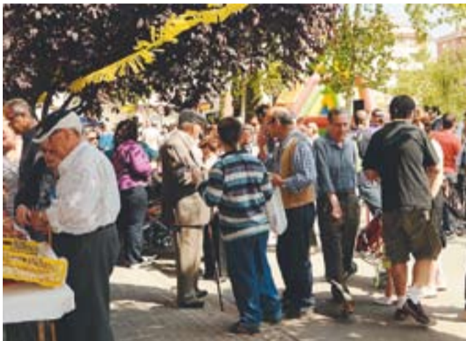
Els comerciants van aconseguir que la gent sortís al carrer.

Els botiguers de Prat de la Riba van sortir al carrer per promocionar-se