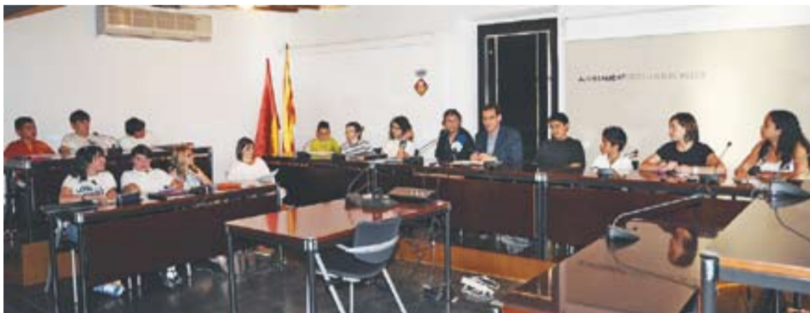
© Els representants del Consell d'Infants amb l'alcalde i la regidora de participació, Antònia Pérez. || JOSEP GRAELLS

L'alcalde, Ignasi Giménez, ha recollit les demandes del Consell d'Infants