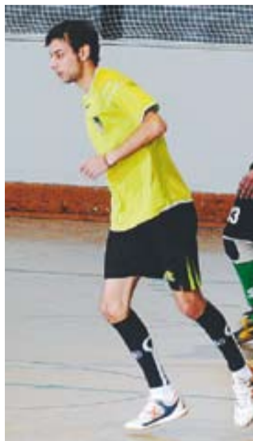
Els dos equips del Futbol Sala Castellar, el filial de l'Athlètic 04 i l'Atlètic Almendra han acabat la lliga.