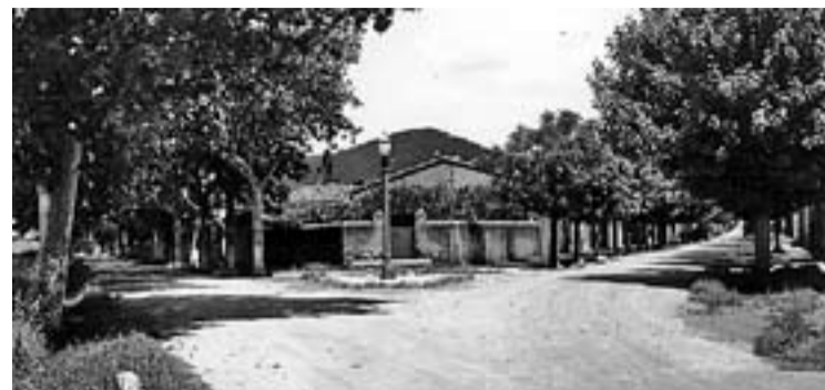
© Imatge dels Pedrissos, fotografia de portada del núm. 7 de la revista 'Recerca'.

El 2 de juliol s'ha programat un concert del Cor III als jardins del Palau Tolrà, motivat per la participació en el 25è aniversari de la Coral Xiribec. Després de les vacances d'estiu, el dia 4 de setembre el Cor de Mitjans i el Cor III faran un concert conjunt amb un cor alemany, als Jardins del Palau. Finalment, el dia 7 de novembre a les 19 hores, el Cor III té previst un concert al Casal de Cultura d'Ullastrell, amb la cantant de gospel Sònia Moreno. ➔