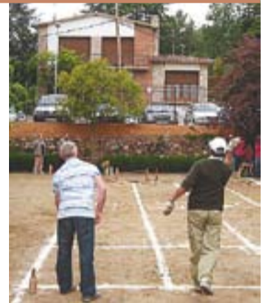
© Bitlles a Santa Quitèria. || J.GRAELLS

El tradicional repartiment de pa de la festa de la patrona de Sant Feliu va ser l'acte més multitudinari. També va acollir un bon nombre de públic i de participants la tirada de bitlles catalanes a l'antiga escola. || C.D.