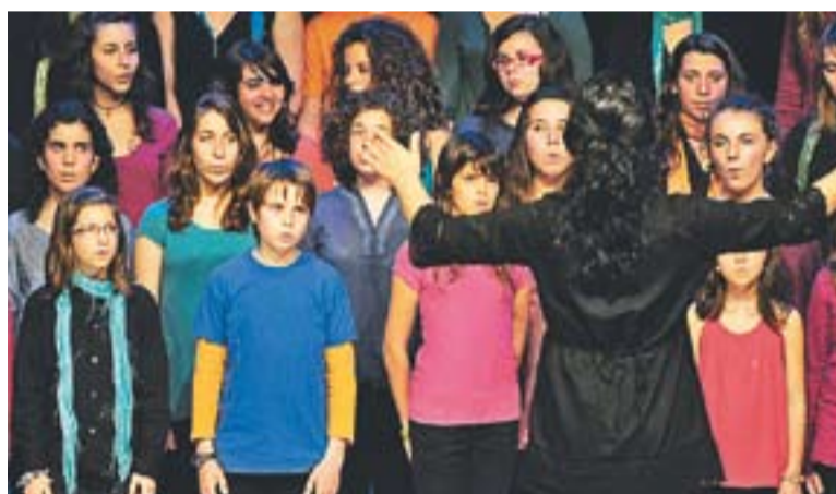
Actuació de l'Orfeó Català i la Coral Sant Esteve, a l'Auditori.

últim treball com a millor disc de l'any ", apunta Sala.