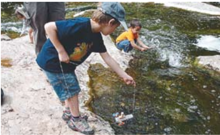
© Els nens van provar si les barques fetes al taller podien navegar en el riu. || OFICINA 21